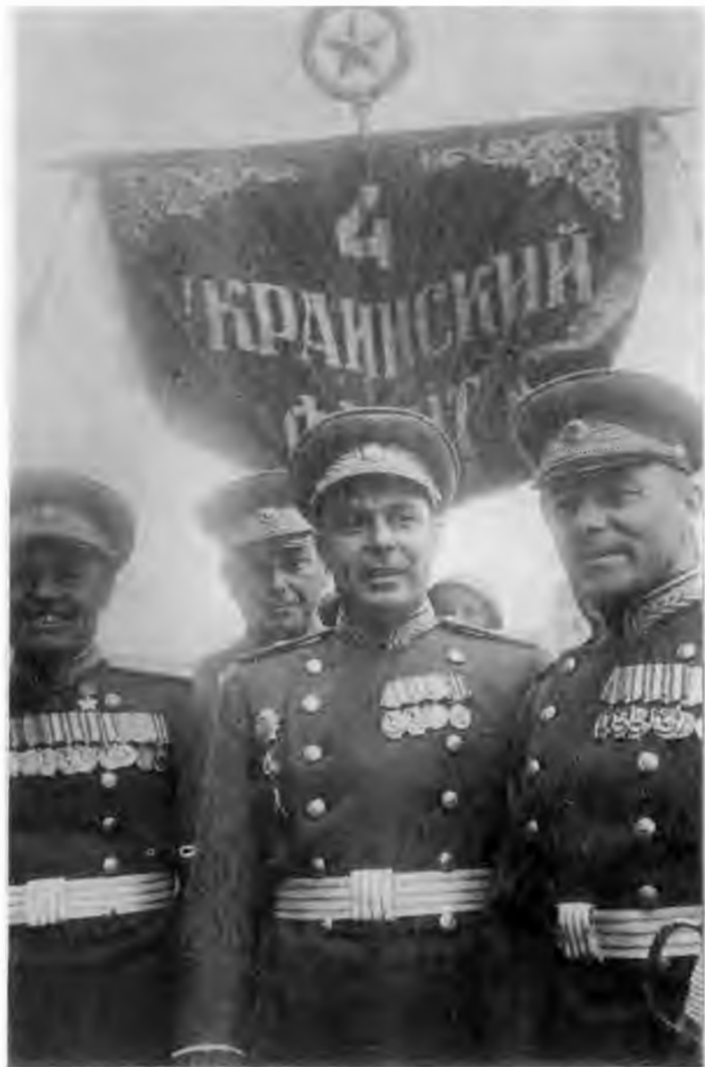
На Параде Победы. 1945 г.