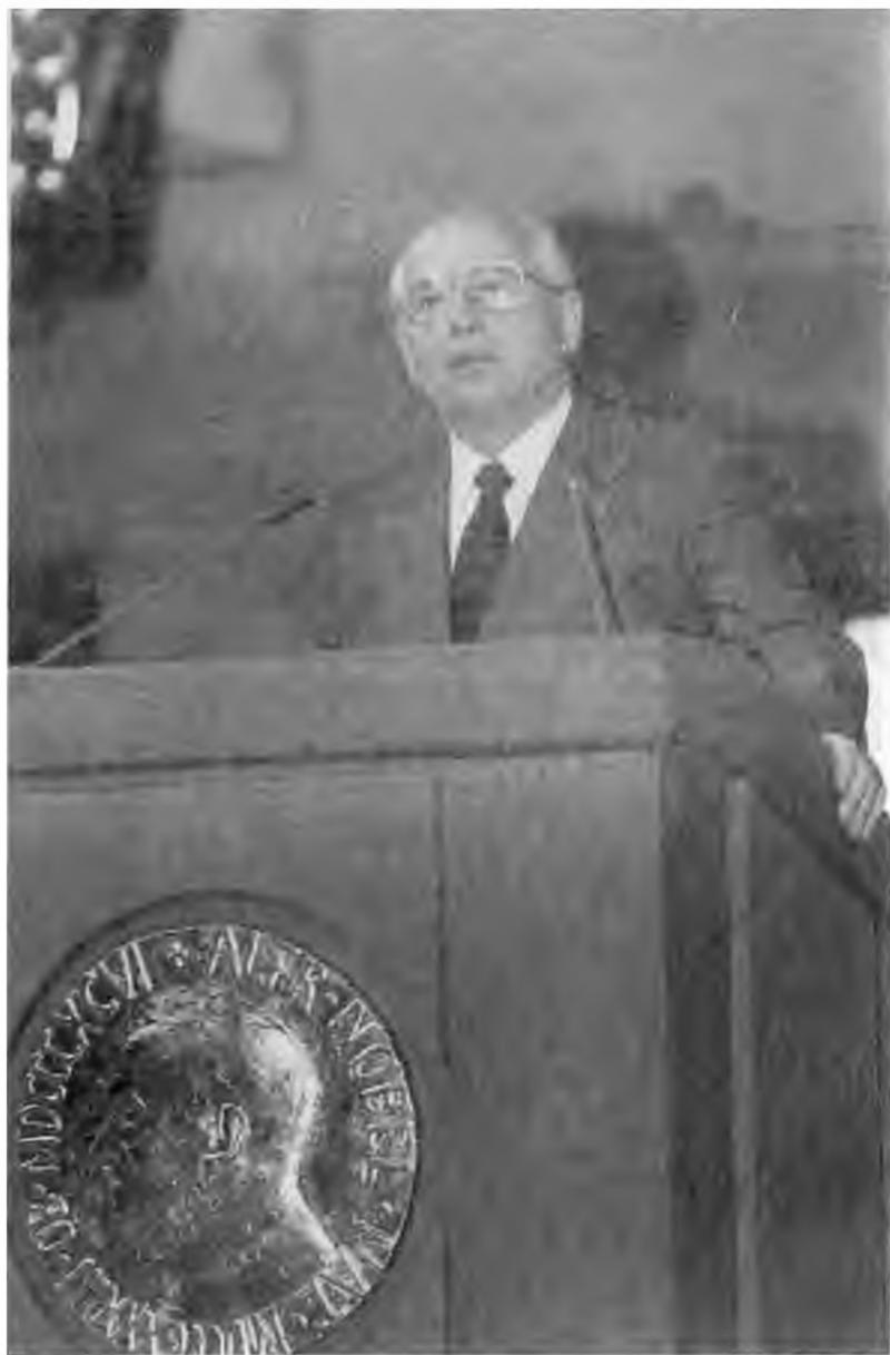
Выступление при вручении Нобелевской премии мира. Осло. 1991 г.