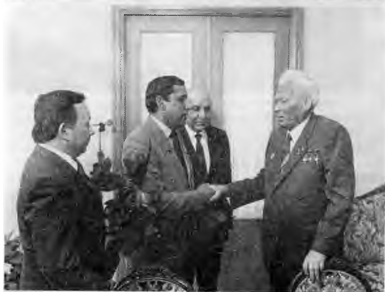
В индийском посольстве в Москве в связи с трауром по погибшей Индире Ганди. 1984 г.