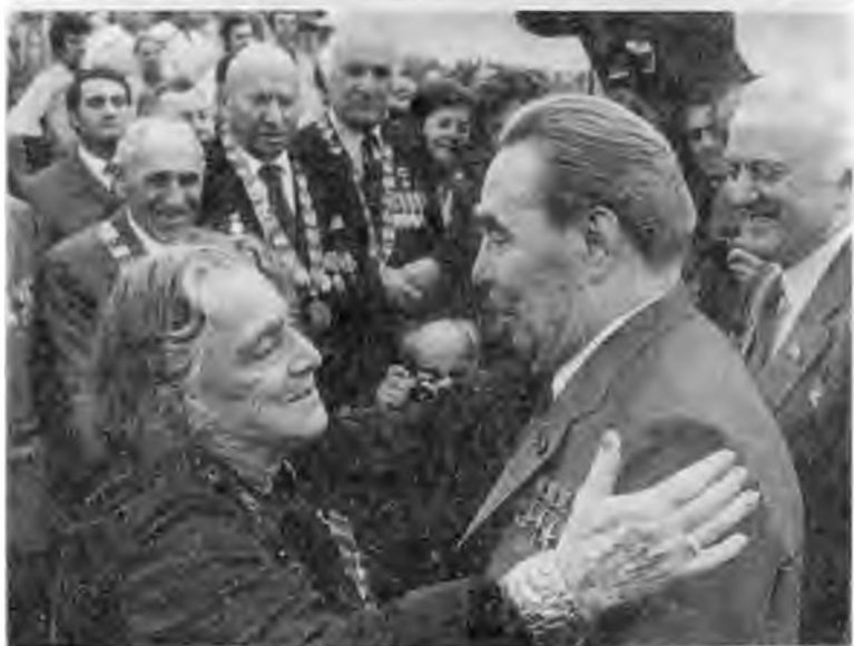
Открытие Игр XXII Олимпиады в Москве. 1980 г. «Дорогой гость». Прибытие в Тбилиси. 1981 г.