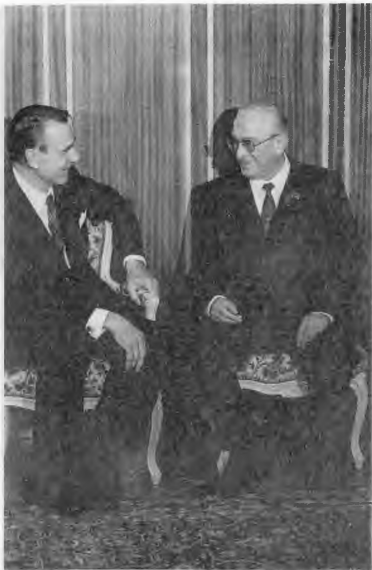
С Президентом Финляндской Республики Мауно Койвисто, Москва. 1983 г.