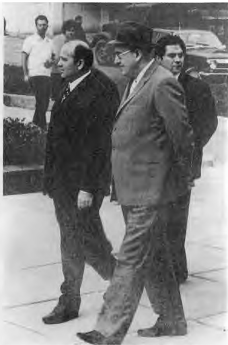
В Пятигорске состоялось близкое знакомство Ю.В. Андропова и М.С. Горбачева. 1974 г.