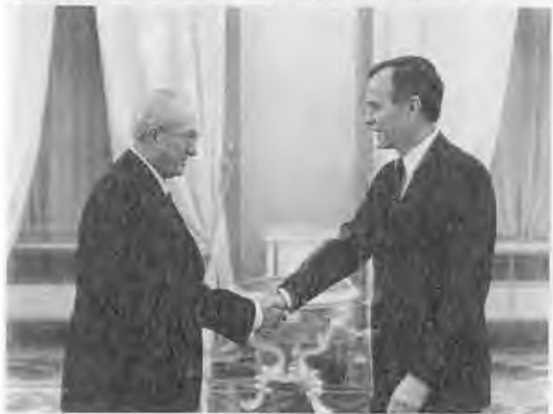
Проводы Эриха Хонеккера на Внуковском аэродроме. 1983 г. С вице-президентом США Джорджем Бушем. Москва. 1982 г.