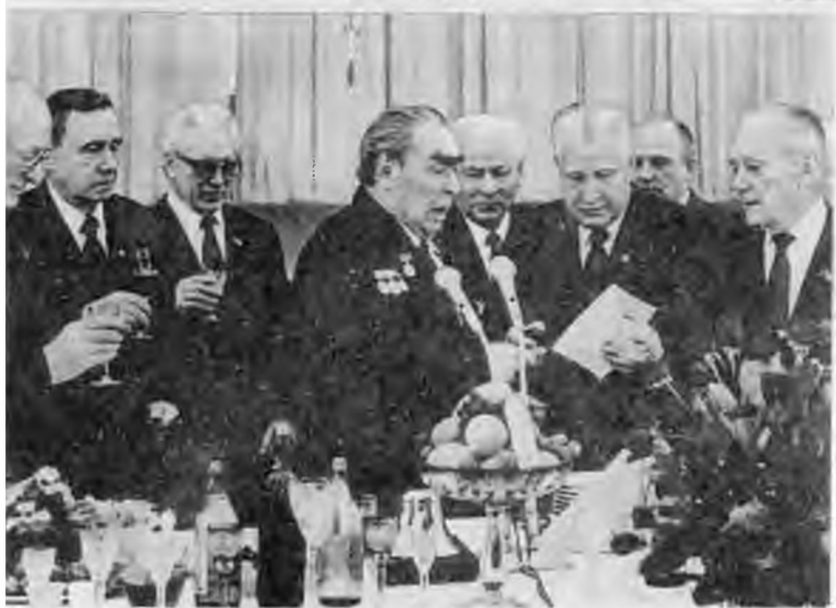
Орден Победы маршалу Брежневу. 1978 г. День рождения генсека. Еще одна награда...