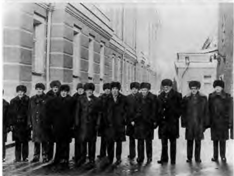
Последняя зарубежная поездка Брежнева. Встреча с председателем Христианско-социального союза Францем Йозефом Штраусом. Бонн, 1981 г.