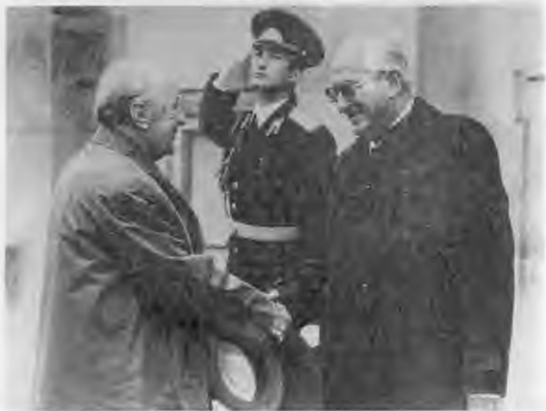
Беседа с президентом ДРВ Хо Ши Мином. 1963 г.