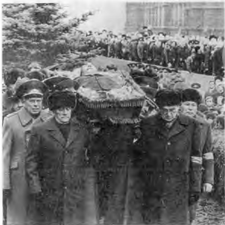
Похороны. 15 ноября 1982 г.