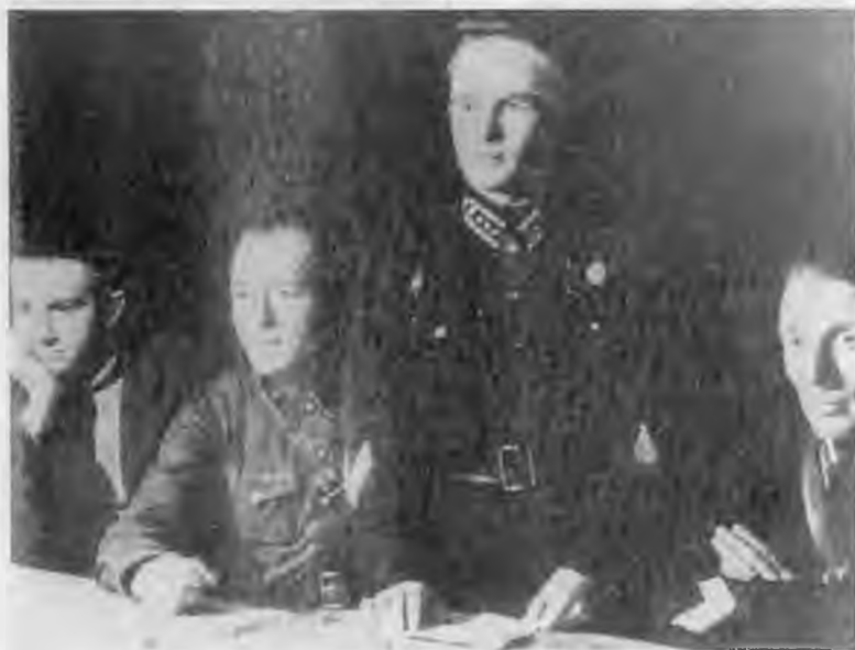
Ю.В. Андропов (в центре) — студент техникума водного транспорта. Рыбинск. 1936 г.