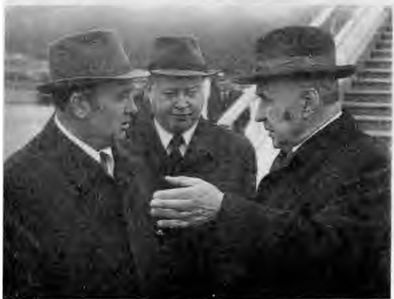
На отдыхе с Ю.В. Андроповым в Кисловодске. 1976 г. С А.Н. Косыгиным. 1972 г.