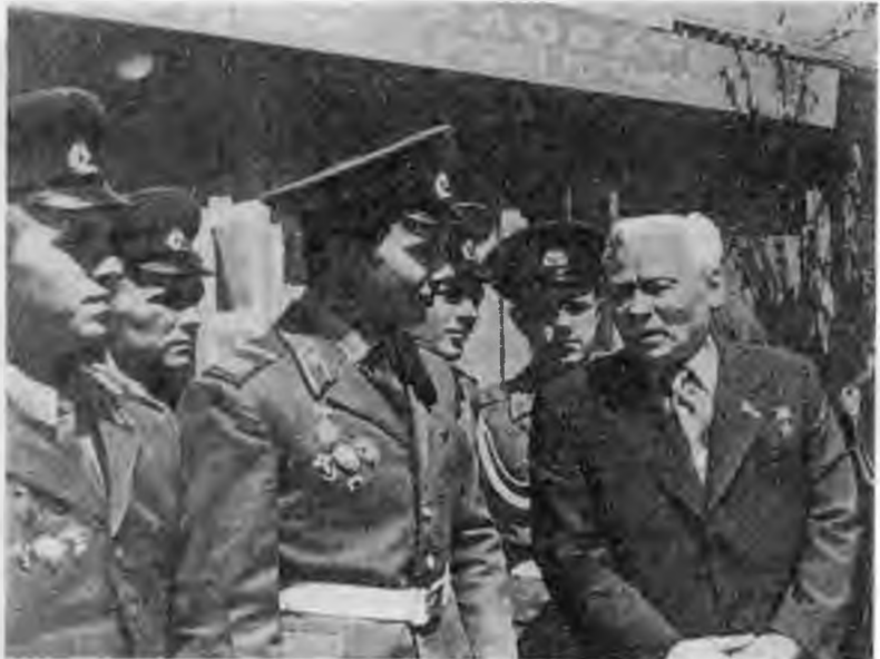
Делегаты партийной конференции погранотряда. Второй справа, в верхнем ряду — К.У. Черненко. Казахстан. 1932 г. В родном погранотряде 47 лет спустя.