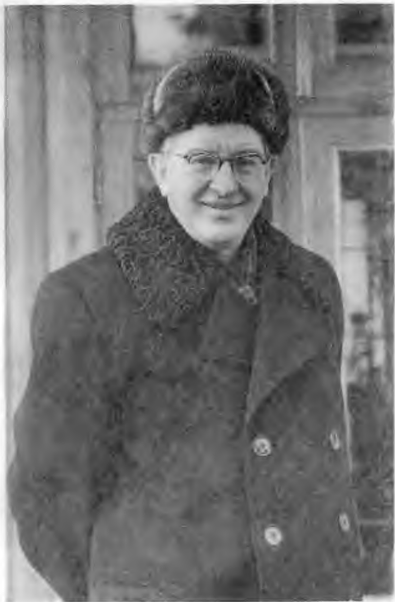
В Завидове. 1967 г.