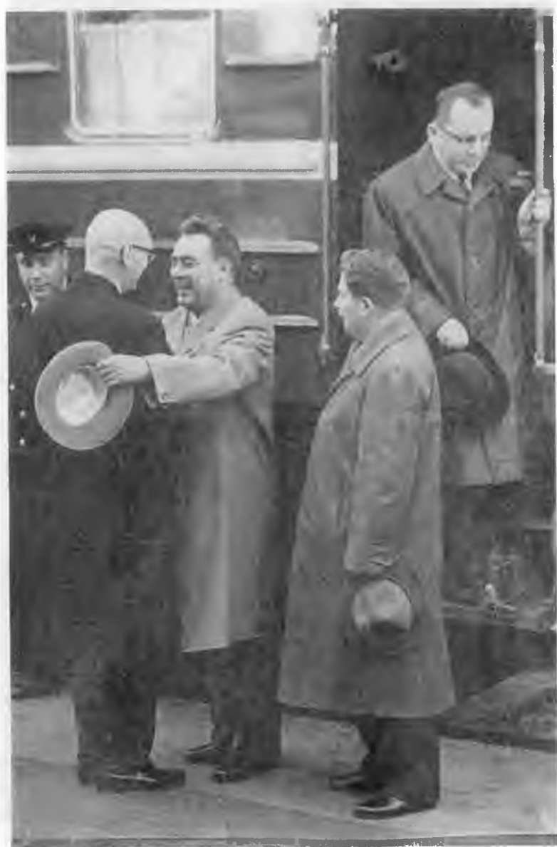
Встреча с президентом Финляндии Урхо Калева Кекконеном в Хельсинки. 1961 г.