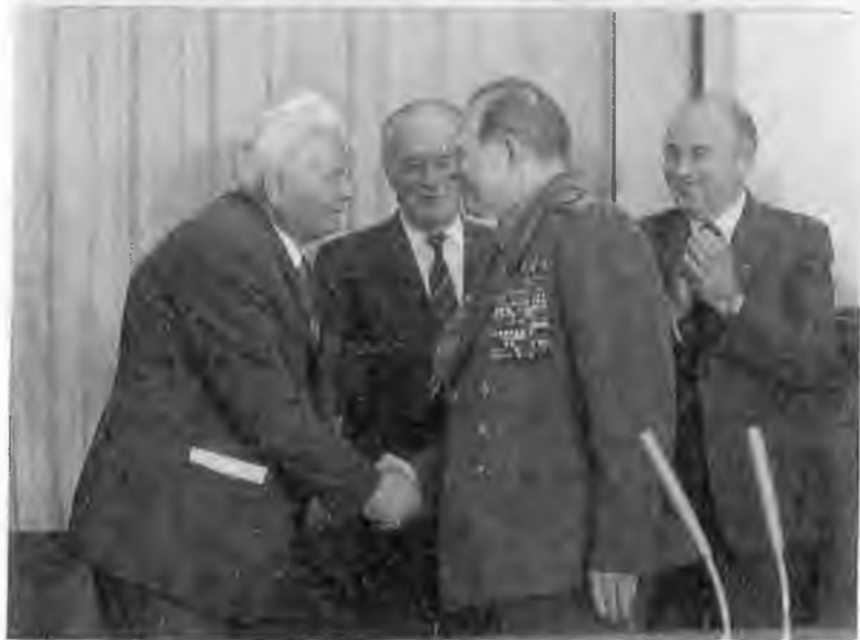
Первый прием нового генсека в Кремле. 1984 г.