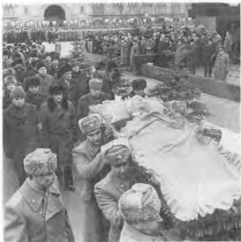
Похороны. 13 марта 1985 г.