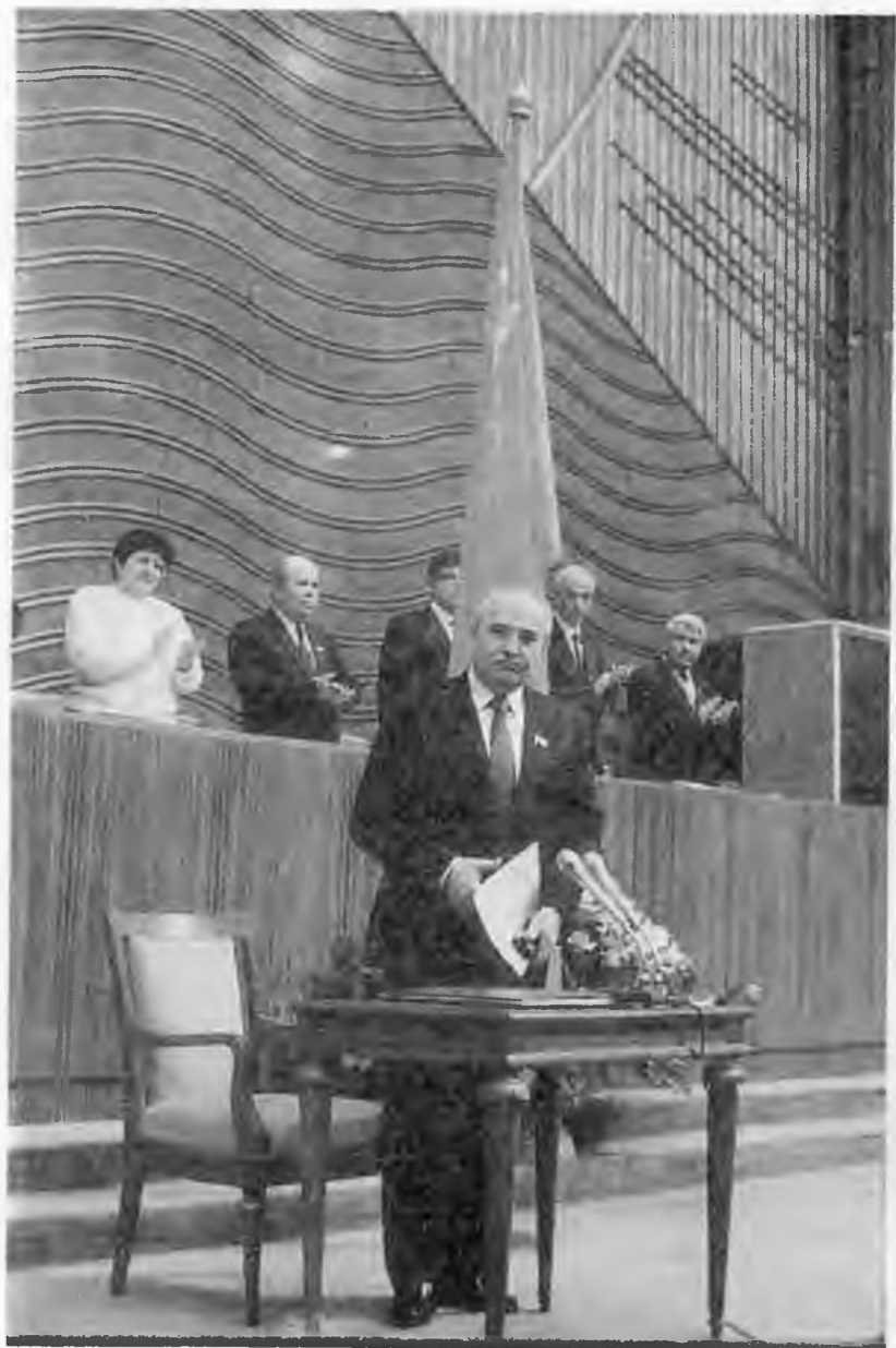
Первый президент СССР принимает присягу. 15 марта 1990 г.