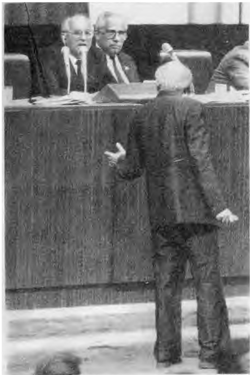
Полемика с А.Д.Сахаровым. Второй съезд народных депутатов СССР. 1989 г.