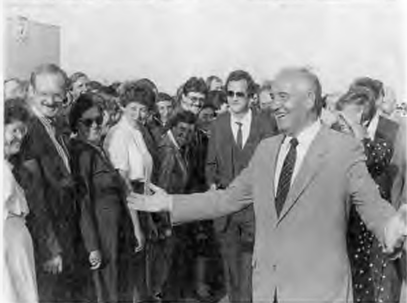
1985 год положил начало поездкам М.С.Горбачева по стране, встречам с людьми. На фото сверху: Ленинград. Май 1985 г. Внизу: с земляками в Ставрополе. 1985 г.