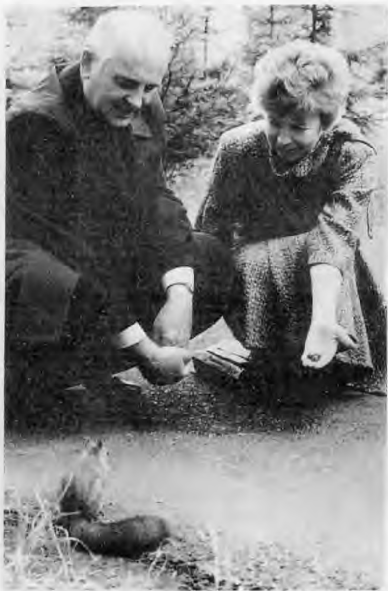
На берегу Енисея. 1986 г.