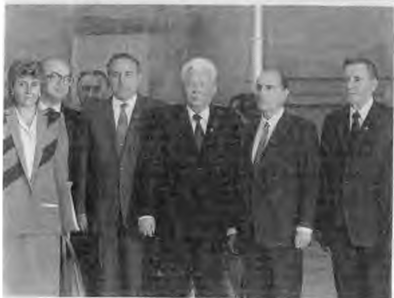
Дружеская встреча с Густавом Гусаком. В Кремле с Франсуа Миттераном. 1984 г.