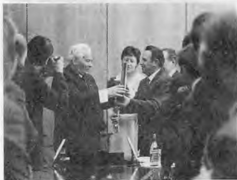
На заводе «Серп и молот»: беседа с рабочими; вручение сувенира. 1984 г.