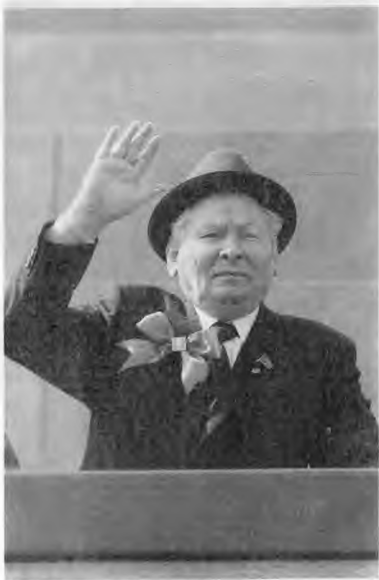
Во время праздничной демонстрации трудящихся 1 мая 1984 г.