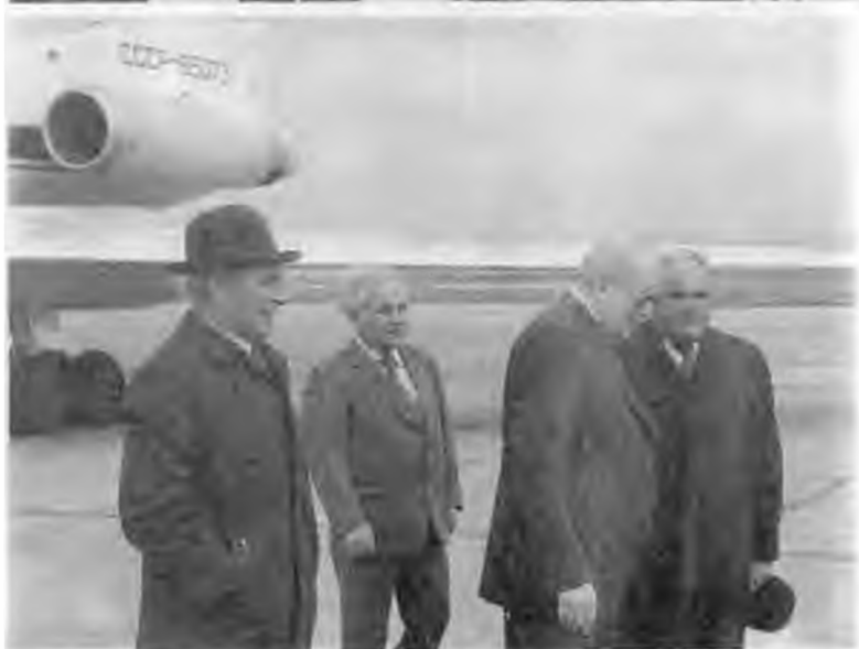
Ю.В. Андропов и А.Н. Косыгин после визита в КНДР. Владивосток. 1961 г.