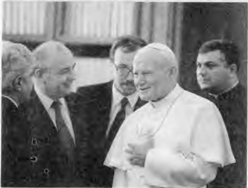
С Маргарет Тэтчер в Кремле. 1987 г.