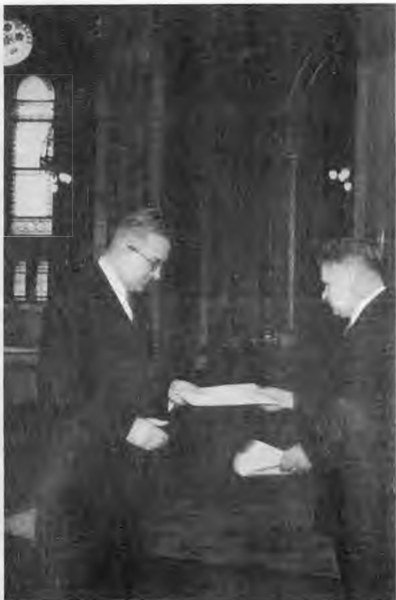
Вручение верительных грамот Председателю Президиума ВНР Иштвану Доби. Будапешт. 1954 г.