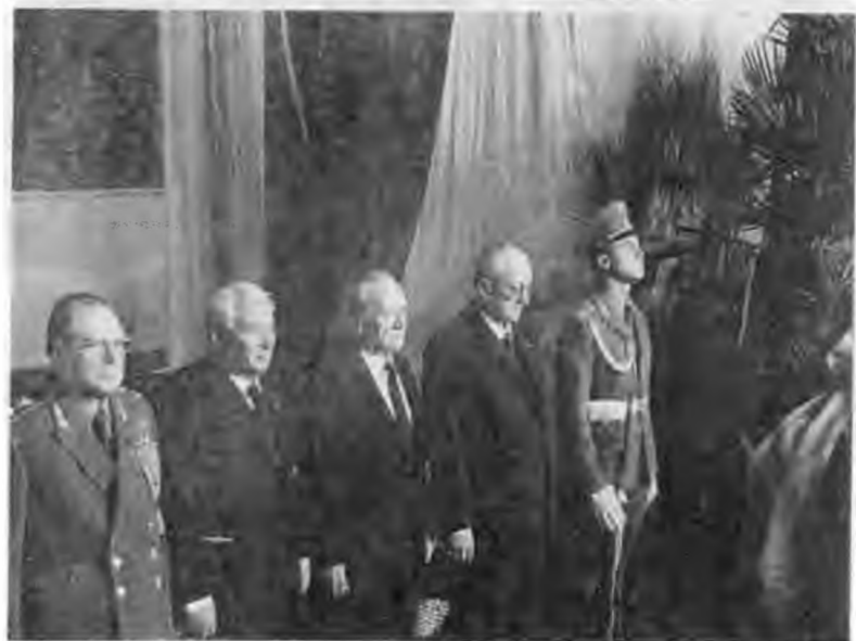
В президиуме XIX съезда ВЛКСМ. Май 1982 г. В почетном карауле у гроба благодетеля. Ноябрь 1982 г.