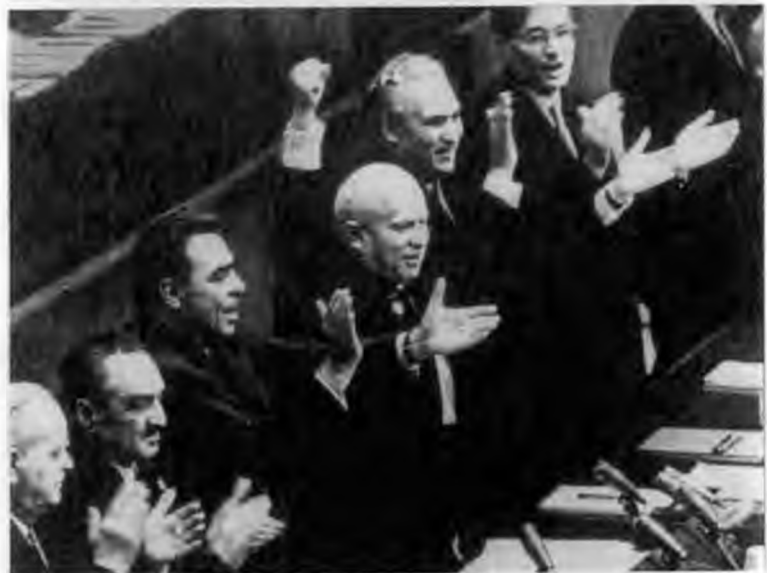
Первый секретарь Запорожского обкома партии Л.И.Брежнев на «Запорожстали». 1946 г.