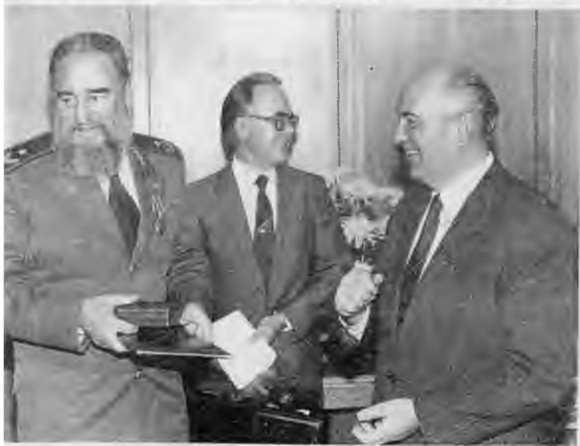
С президентом США Джорджем Бушем в Ново-Огареве. 1991 г. Вручение ордена Ленина Фиделю Кастро в Кремле. 1986 г.