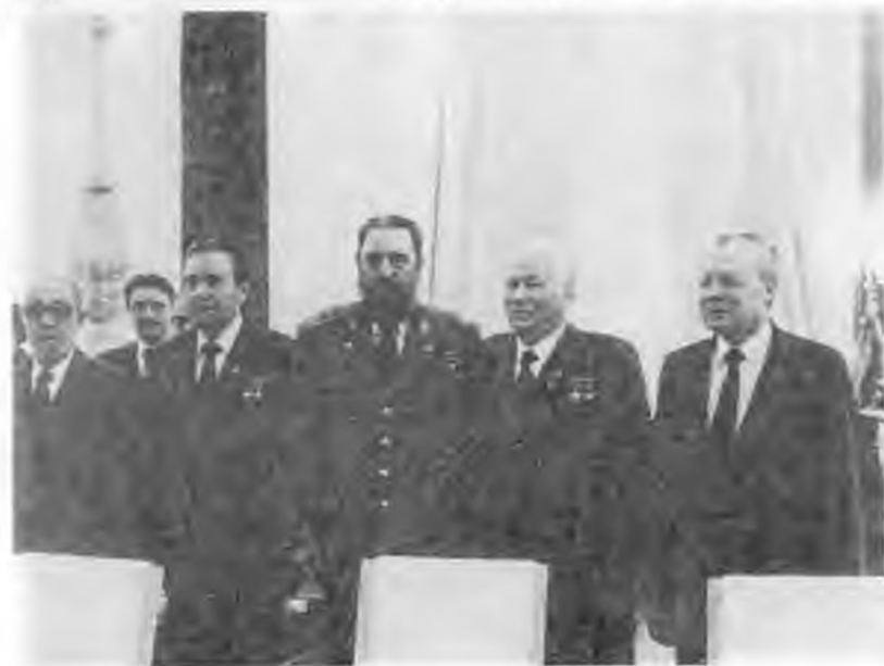
Переговоры с президентом Мадагаскара Дидье Рациракой. 1984 г. Во время встречи с Фиделем Кастро. 1984 г.