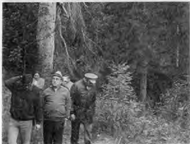
Прогулка по Черному морю На отдыхе в Кисловодске. 1976 г.