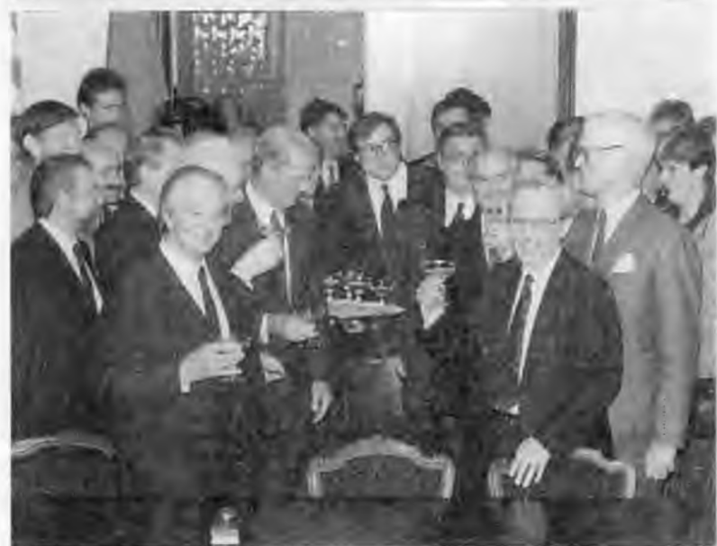
Посадка дерева дружбы с премьер-министром Японии Тосики Кайфу. Токио. 1991 г.