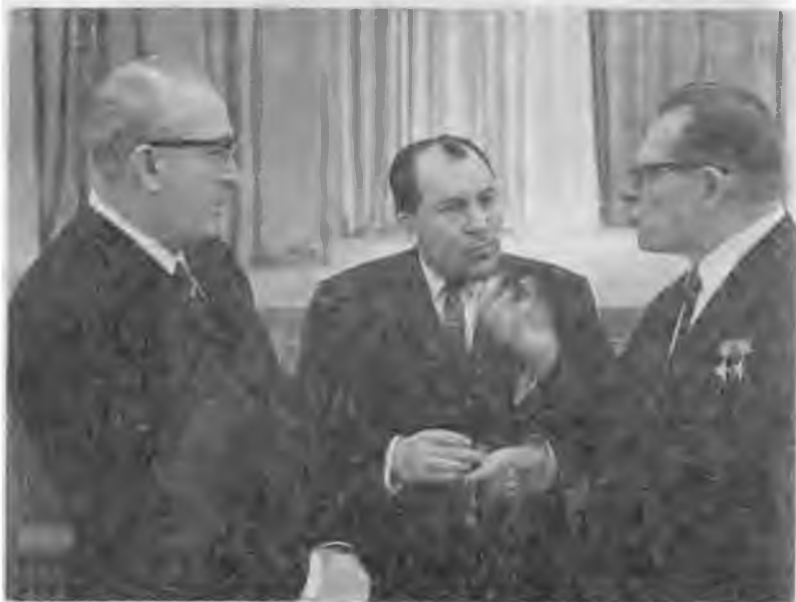
На Онежском тракторном заводе в Петрозаводске, где Андропов начинал свою политическую карьеру. 1982 г. С Д.Ф.Устиновым (справа)