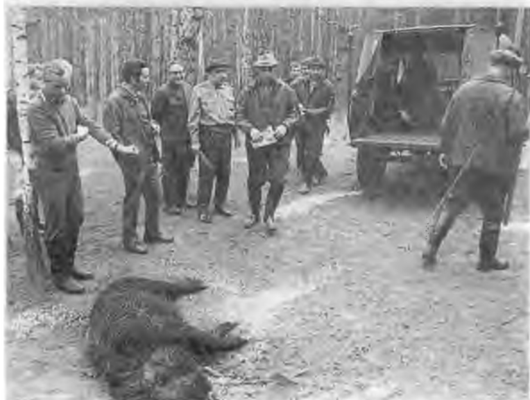
Беседа с премьер-министром Индии Индирой Ганди. Дели. 1973 г. С Генри Киссинджером после охоты в Завидове. 1973 г.