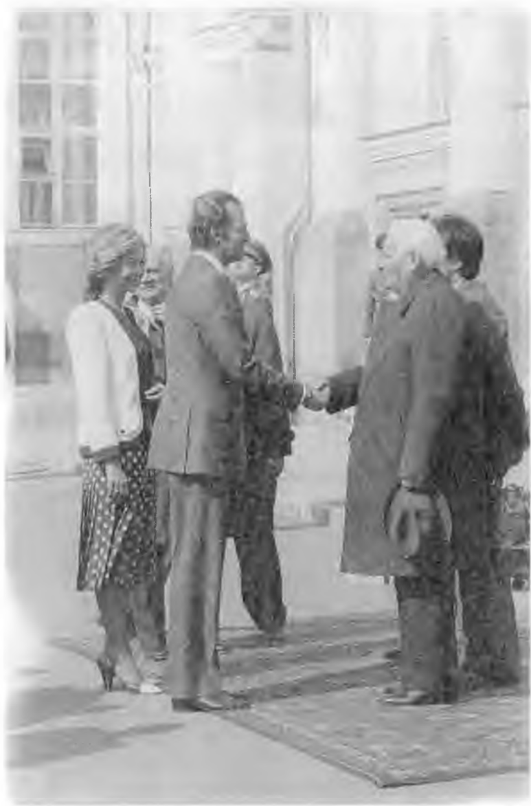
Визит в СССР короля Испании Хуана Карлоса I. 1984 г.