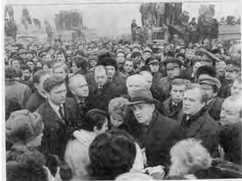
Посещение Чернобыльской АЭС. 1986 г. В разрушенном землетрясением Спитаке. 1988 г.