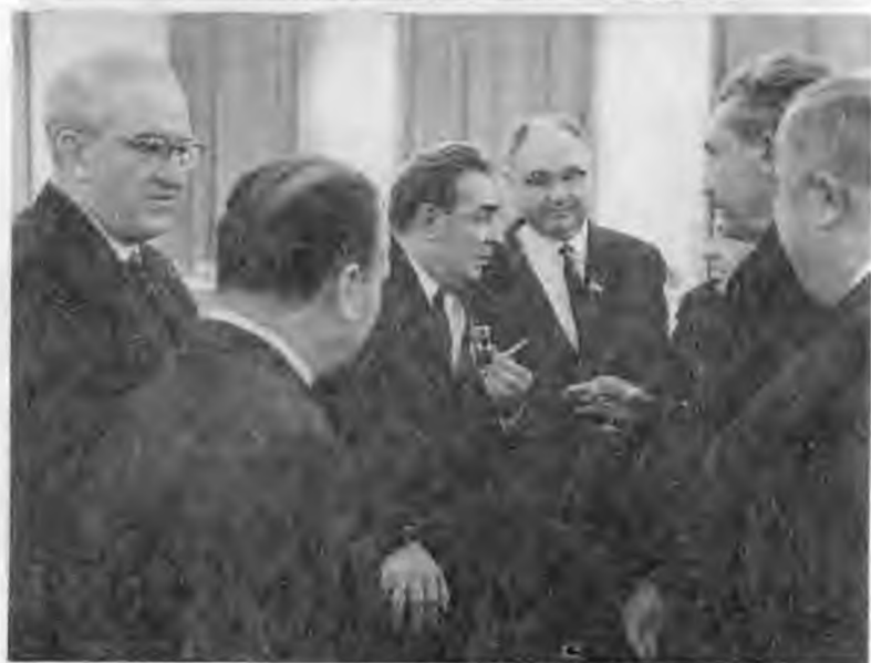
На сессии Верховного Совета СССР. Слева — Н.А.Тихонов, 1982 г. С Л.И.Брежневым. Пока на втором плане. Конец 70-х гг.