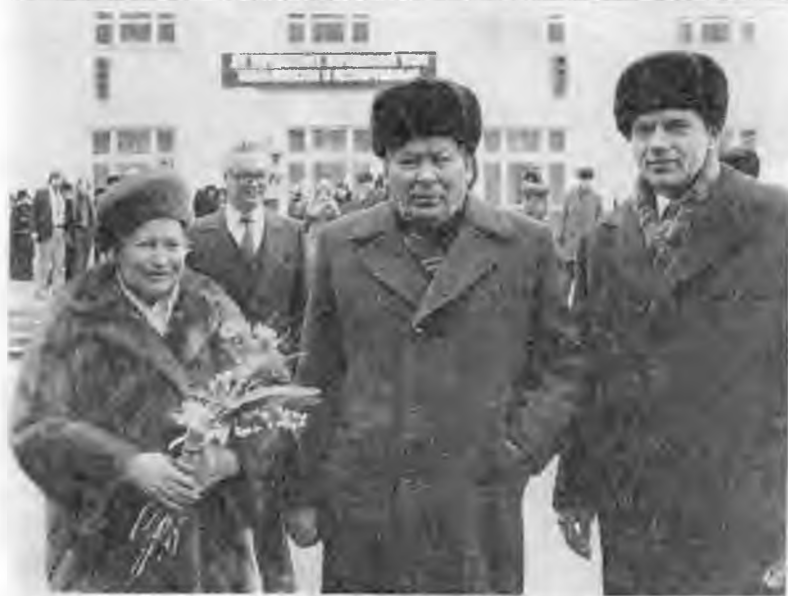
В одном президиуме с действующим генсеком и двумя будущими лидерами КПСС. Сессия Верховного Совета СССР. 1981 г.