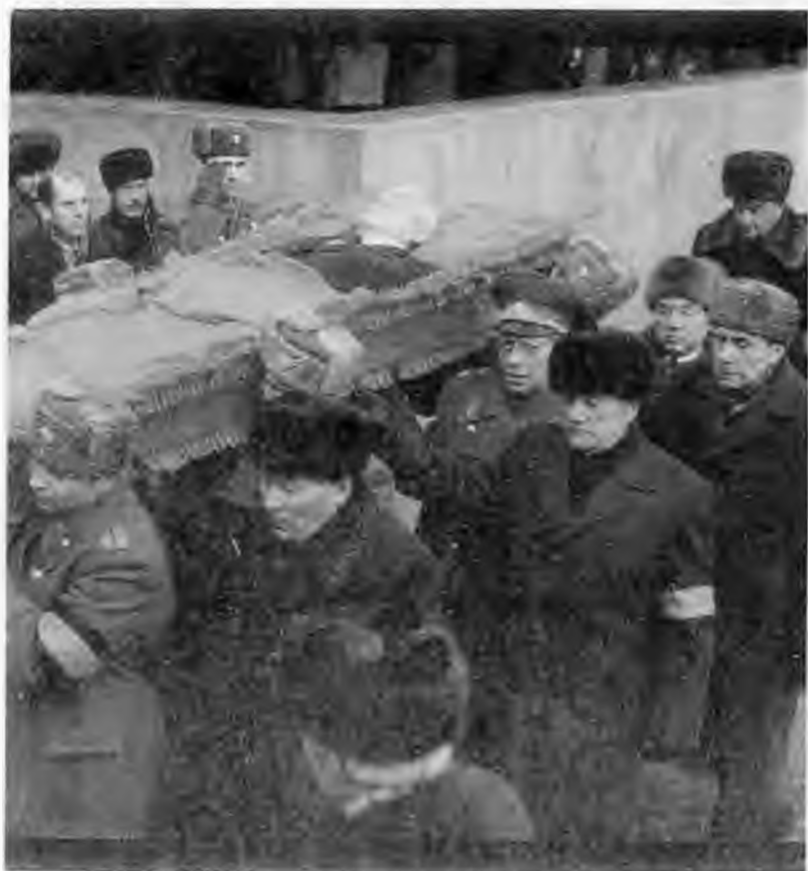
Похороны. 14 февраля 1984 г.