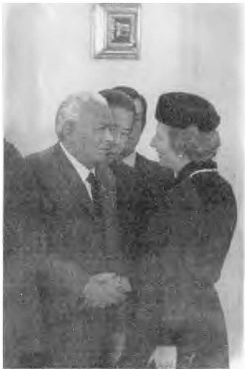
С Маргарет Тэтчер. 1984 г.