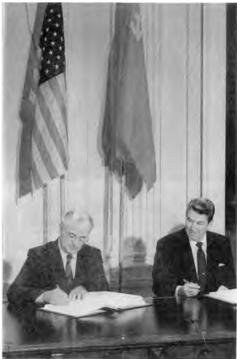
Подписание Договора между СССР и США о ликвидации ракет средней и меньшей дальности. Вашингтон. 8 декабря 1987 г.