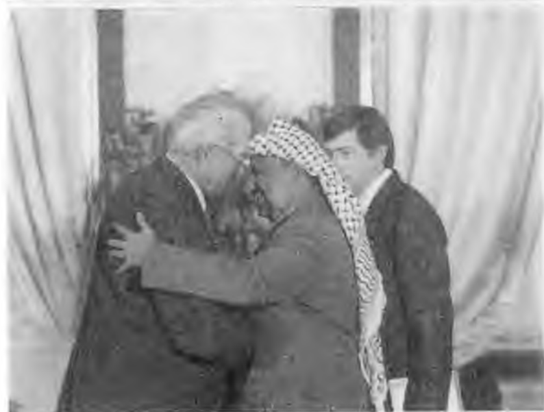
Густав Гусак встречает советскую делегацию во главе с Ю.В.Андроповым. Прага. 1983 г.