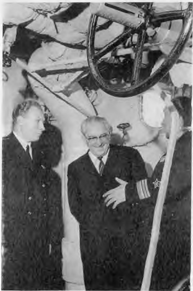
Осмотр противолодочного корабля «Кронштадт»