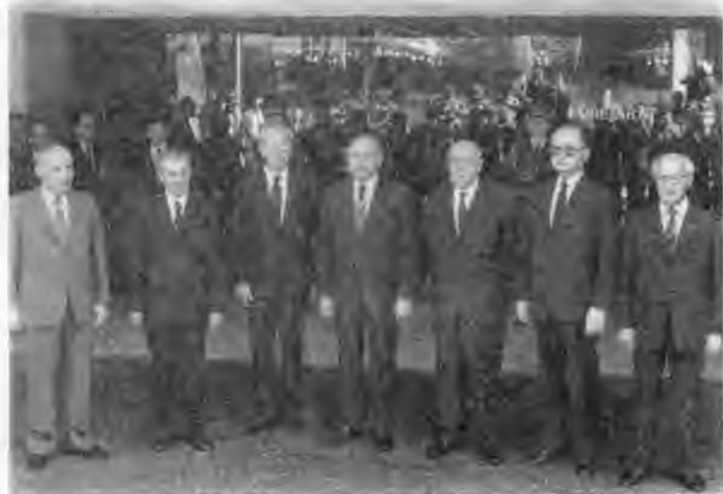
В президиуме XI съезда Социалистической единой партии Германии. Справа — Эрих Хонеккер. 1986 г.