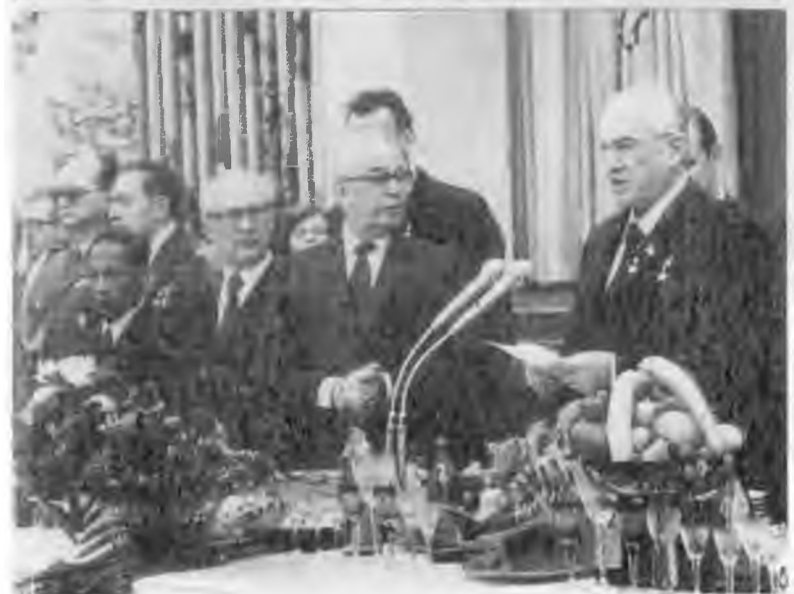
Встреча с Генеральным секретарем ООН Пересом де Куэльером. Москва. 1983 г.