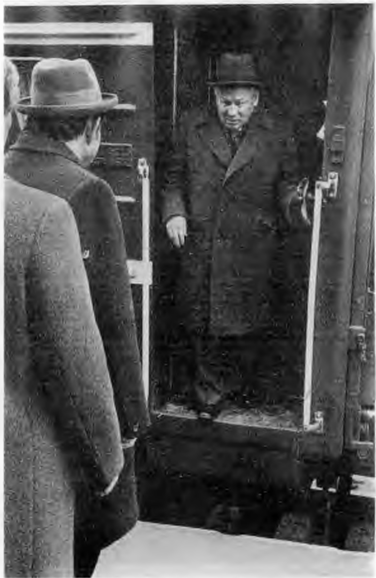
Возвращение из отпуска. 1984 г.