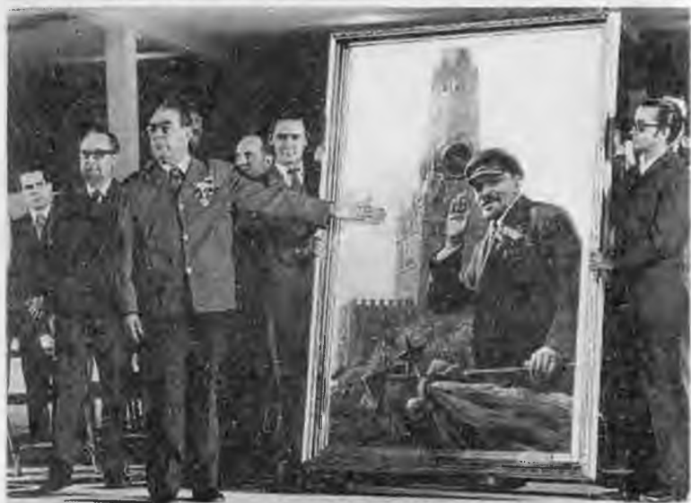
На приеме у президента Австрии Рудольфа Кириллегера во время переговоров с Джимми Картером о подписании ОСВ-2. Вена. 1979 г. Торжественное открытие школы имени Ленина на Кубе. 1974 г.