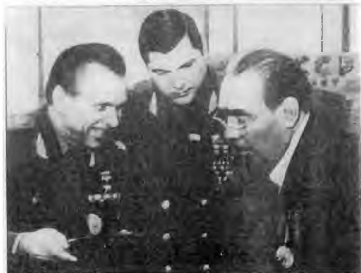
На встрече с ветеранами 18-й армии. 1980 г.

Н.А.Щелоков и Ю.М.Чурбанов преподносят генсеку к его 75-летию золотые часы, списанные министерством по акту как «подарок товарищу Гусаку». 1981 г.