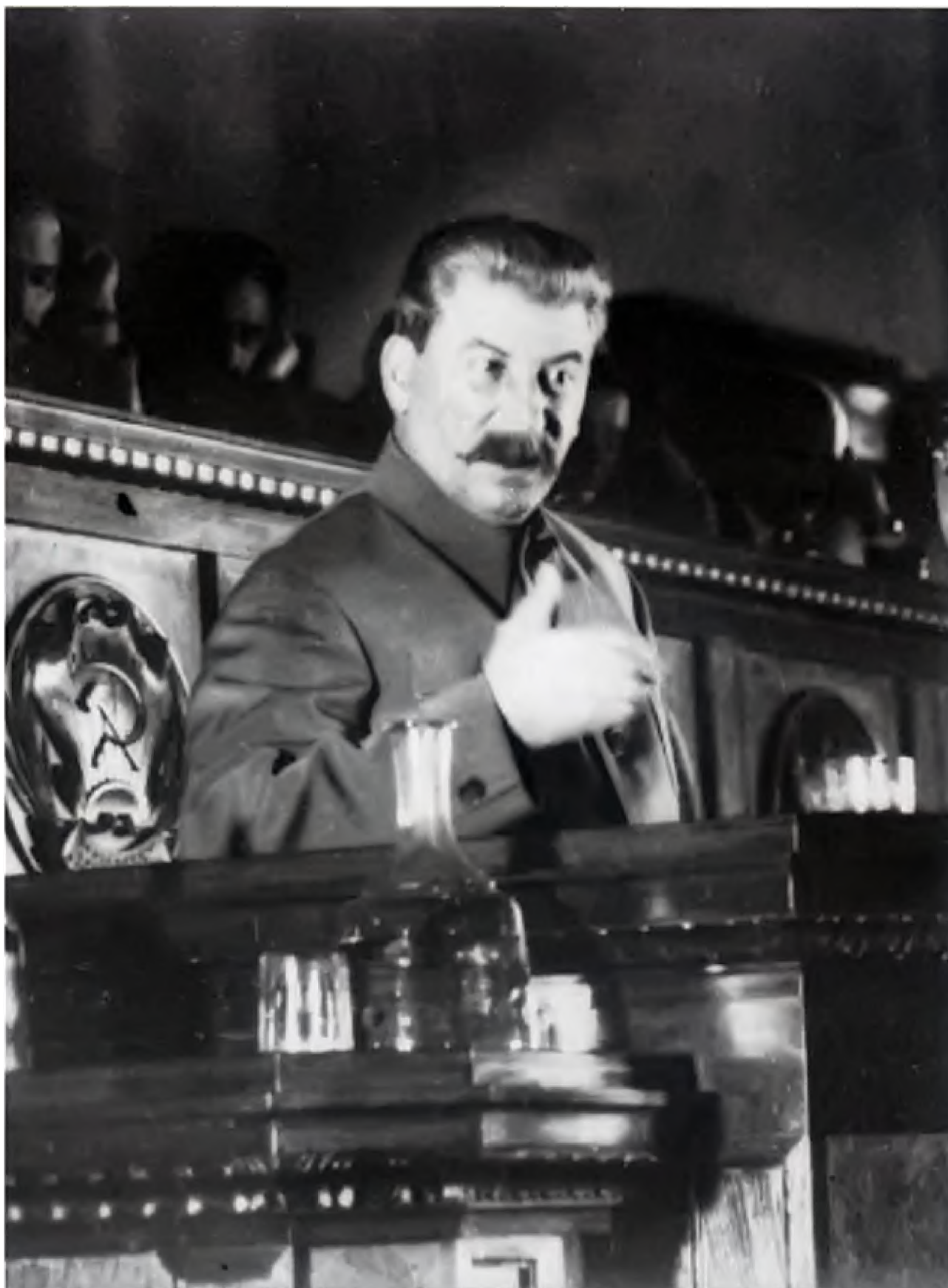
Сталин выступает с докладом в Большом Зале Кремлевского дворца (1936 год.). Обратите внимание на выразительную жестикуляцию вождя.