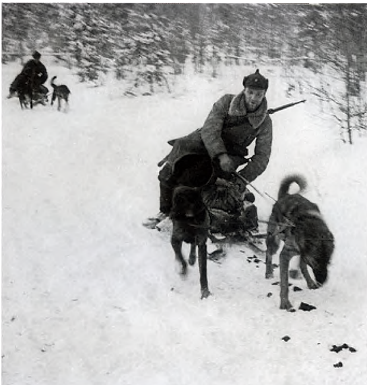
Соба́чи упряжки на передовой во время Советско-финской войны (1939-1940 годы).