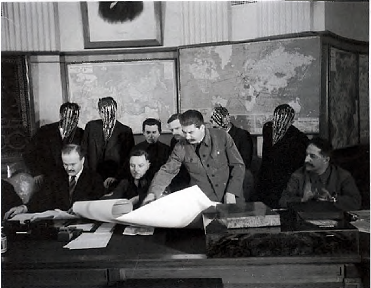
Сталин, Молотов, Ворошилов, Андреев, Ежов, Орджоникидзе, Микоян и другие во время приема делегации трудящихся Грузинской ССР в Кремле, март 1936 г. Лица тех из присутствующих, кто впоследствии был осужден как «враг народа», были вымараны на архивном снимке черным цветом.