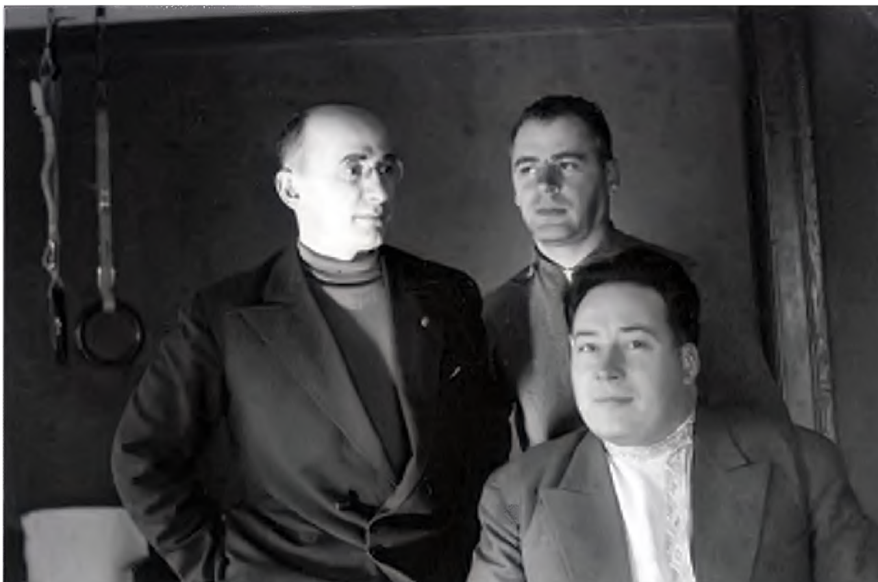
Нарком внутренних дел Берия с сотрудниками НКВД (1939 год)