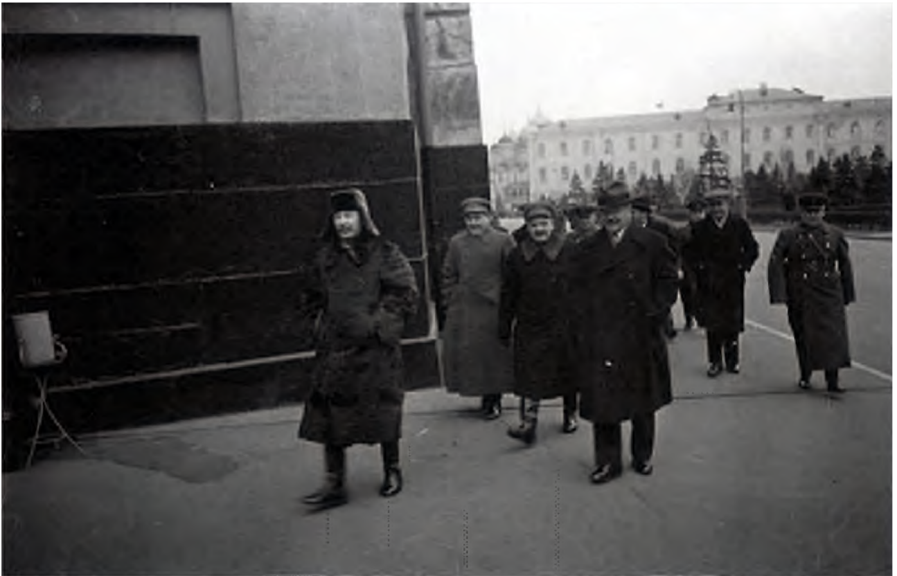
Сталин направляется на Красную площадь на празднование XXII годовщины Октября 7 ноября 1939 года. Он одет в меховой тулуп и шапку-ушанку и в таком виде будет стоять на трибуне Мавзолея Ленина.