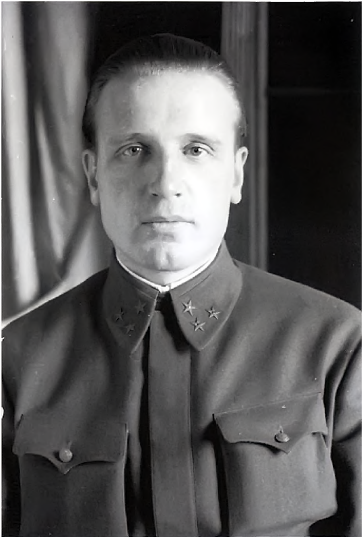
Александр Евгеньевич Голованов (1904–1975).