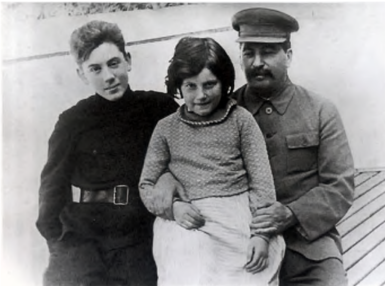
Сталин со своими детьми — Светланой и Василием. 1930-е годы.