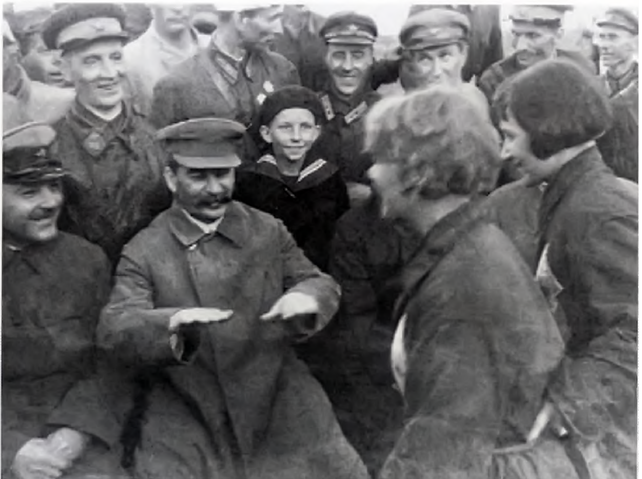
Иосиф Сталин и Климент Ворошилов (слева) беседуют с летчиками и парашютистами на аэродроме в Тушино 02 мая 1935 года.