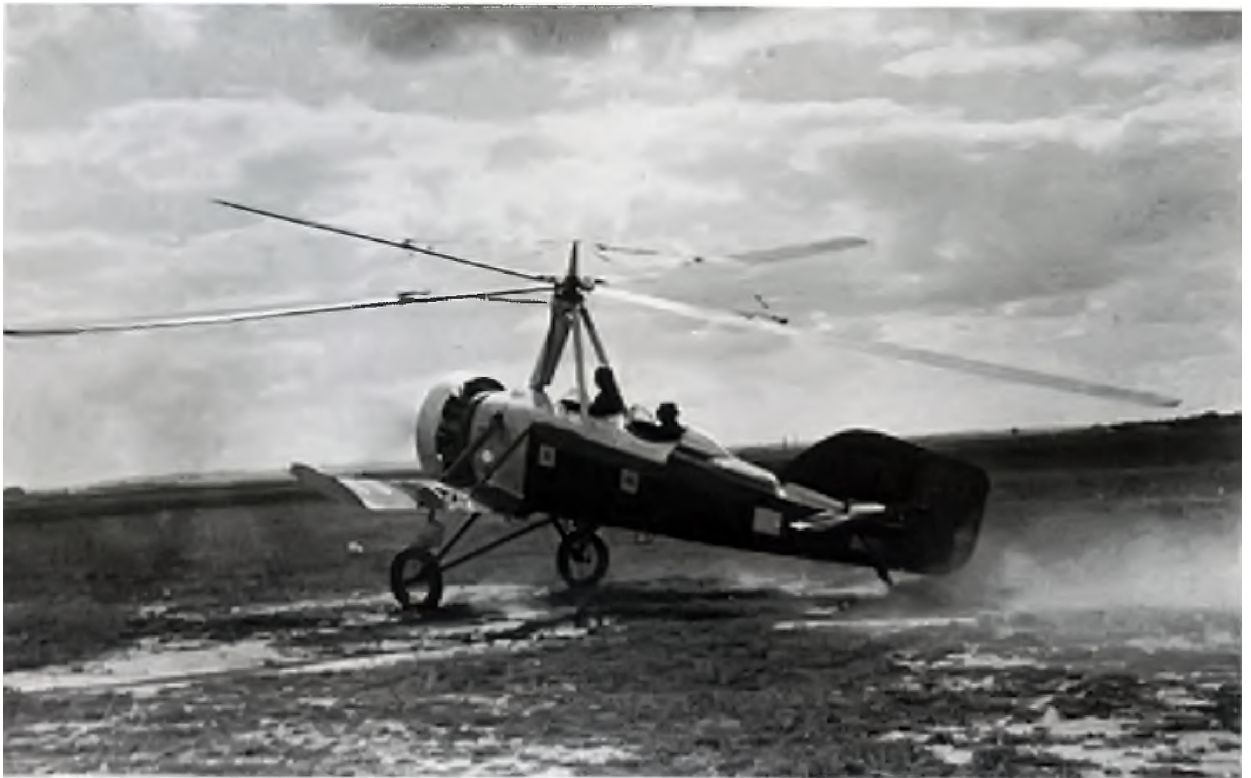
Летчик-испытатель поднимает в воздух один из первых советских автожиров. Такие машины положили начало отечественному вертолетостроению (1932 год).