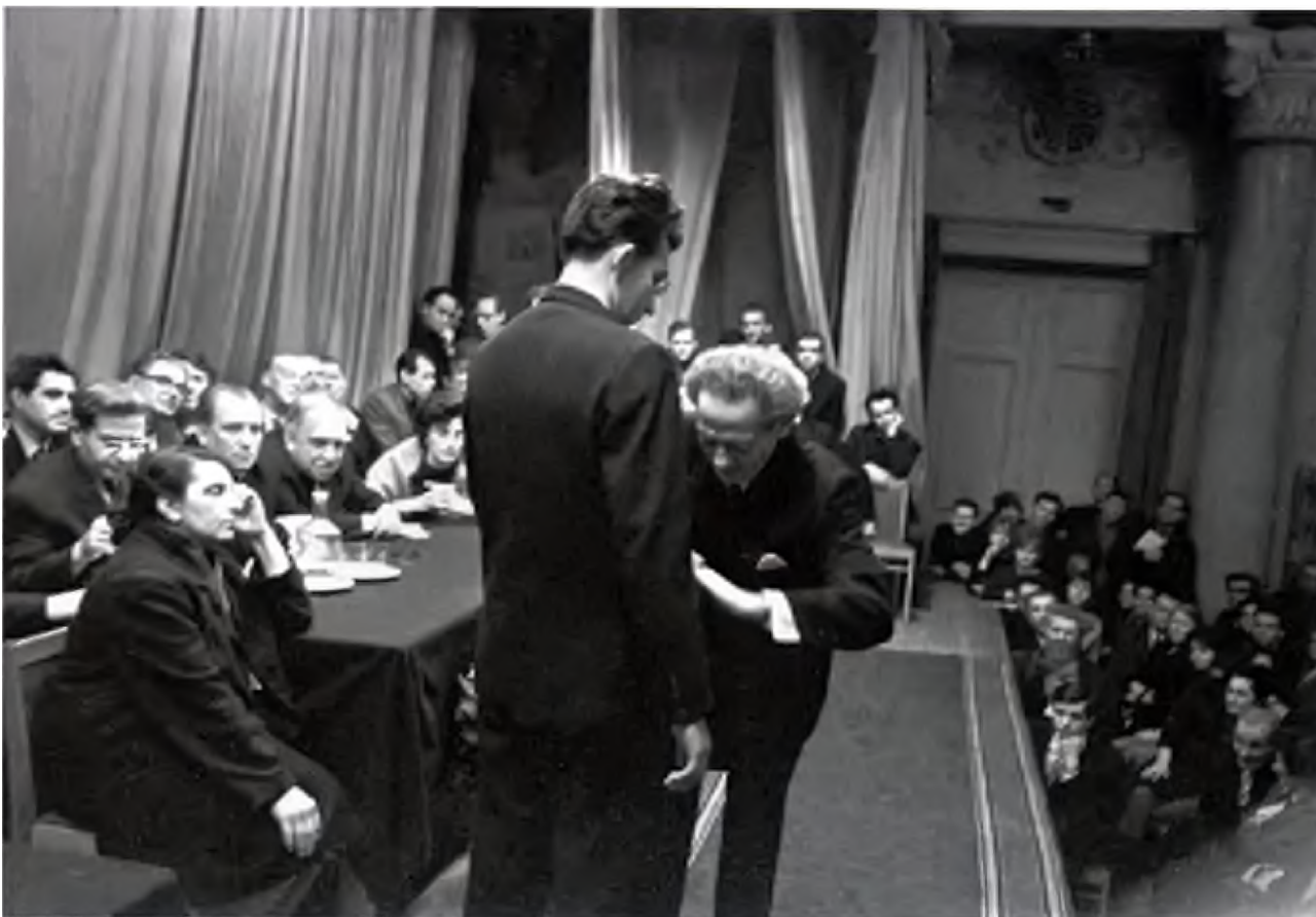
Вольф Мессинг во время одного из психологических сеансов (1966 г.).