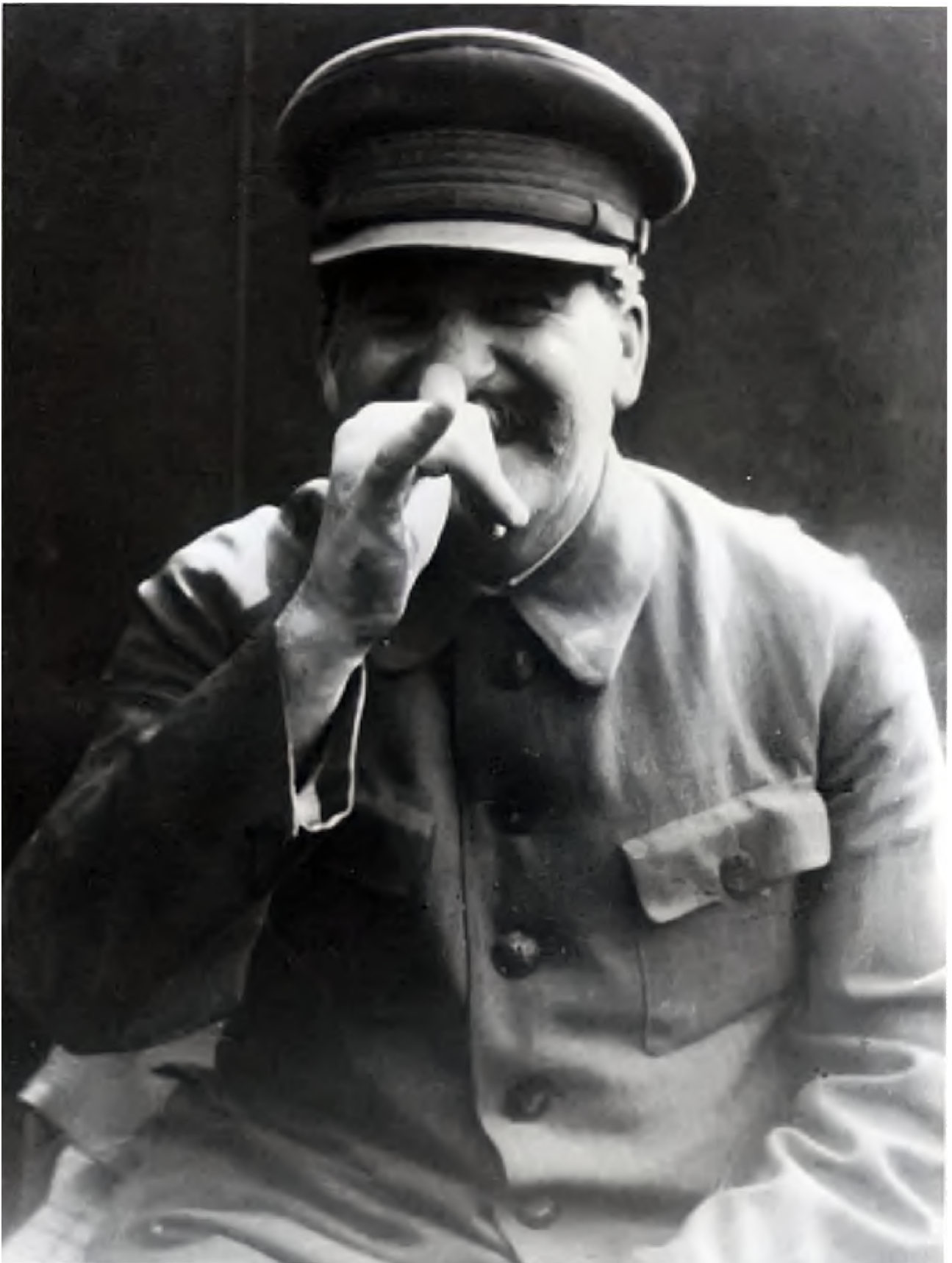
Одна из немногих «неформальных» фотографий Сталина. Точная дата и место съемки не известны, фотография датируется началом 1930-х годов.