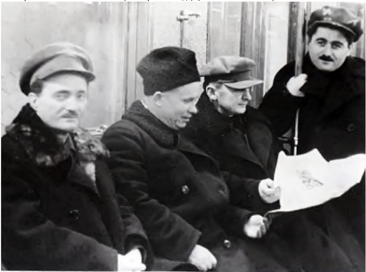
Никита Хрущёв (второй слева) и Лаврентий Берия (второй справа) едут в вагоне Московского метрополитена в день его пуска 14 мая 1935 года.