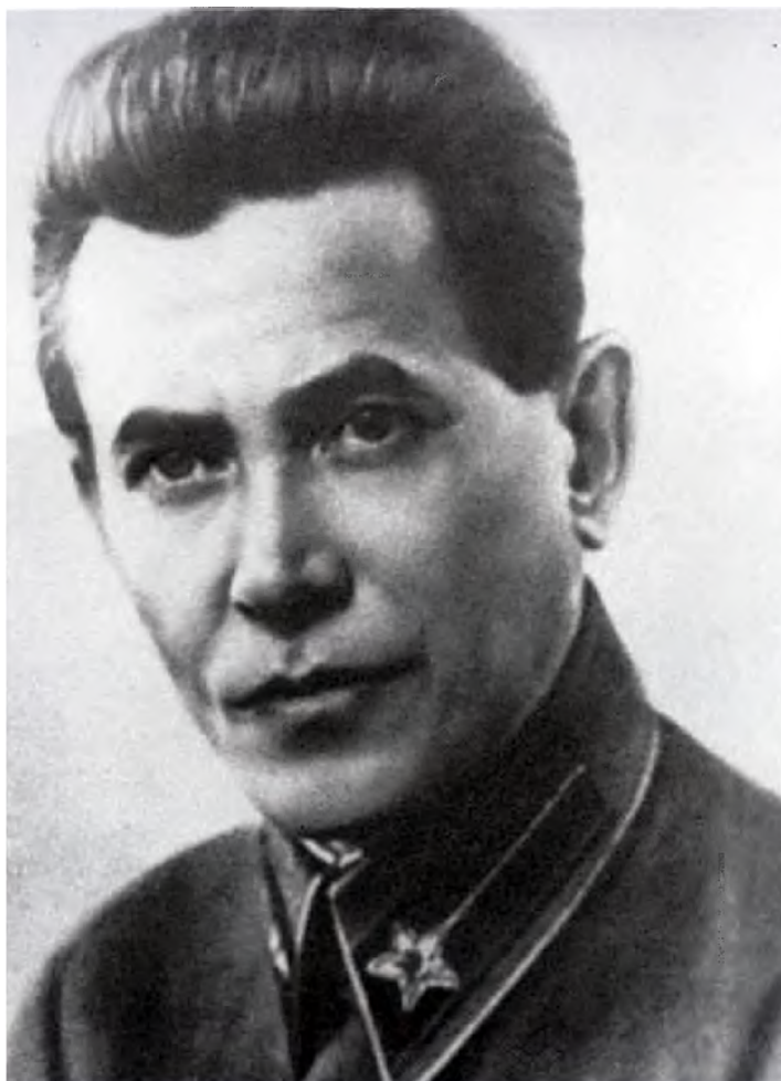
Народный комиссар внутренних дел СССР Николай Ежов.