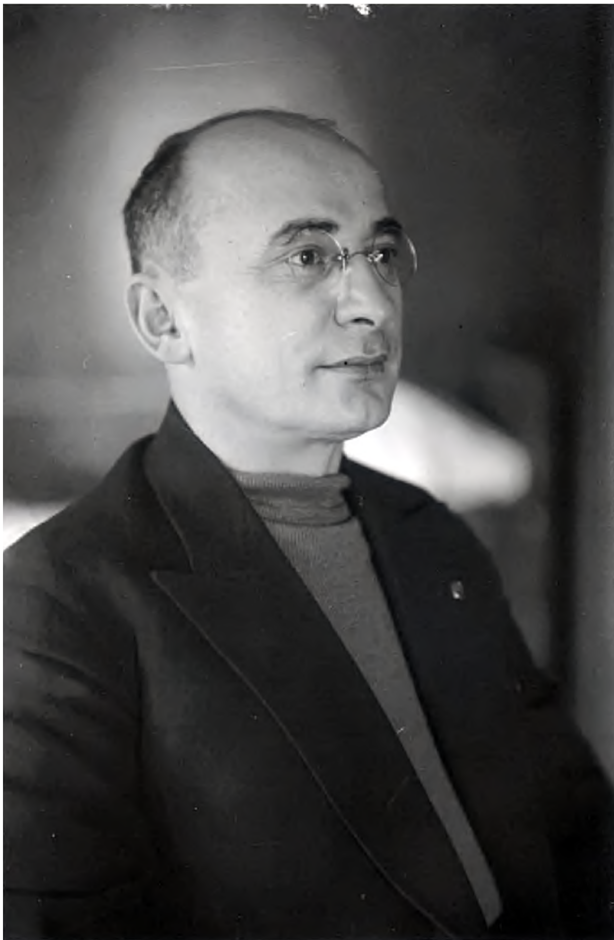
Народный комиссар внутренних дел СССР Лаврентий Павлович Берия (1939 год).