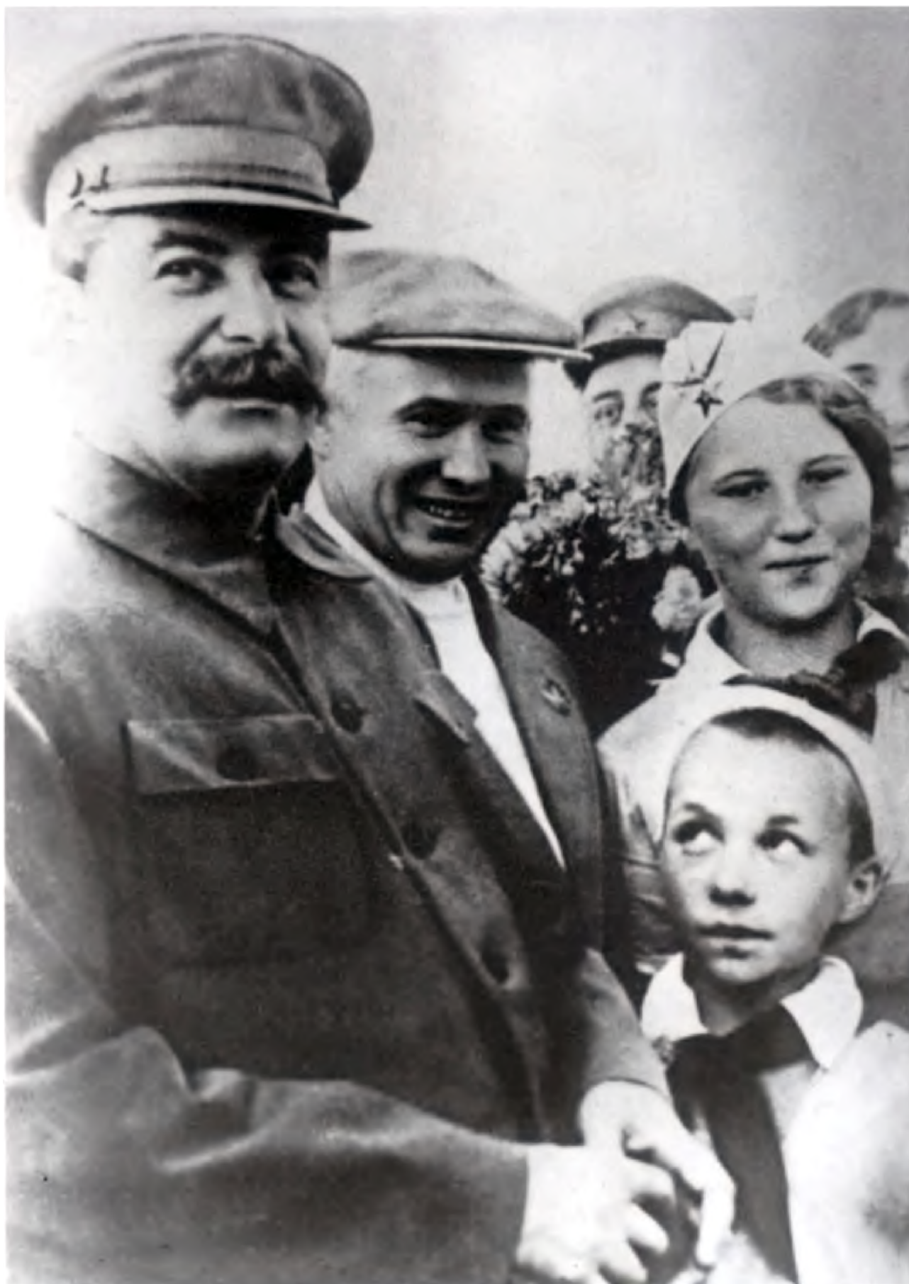
Сталин и первый секретарь МГК ВКП(б) Никита Хрущев среди пионеров на Тушинском аэродроме 16 мая 1937 года.