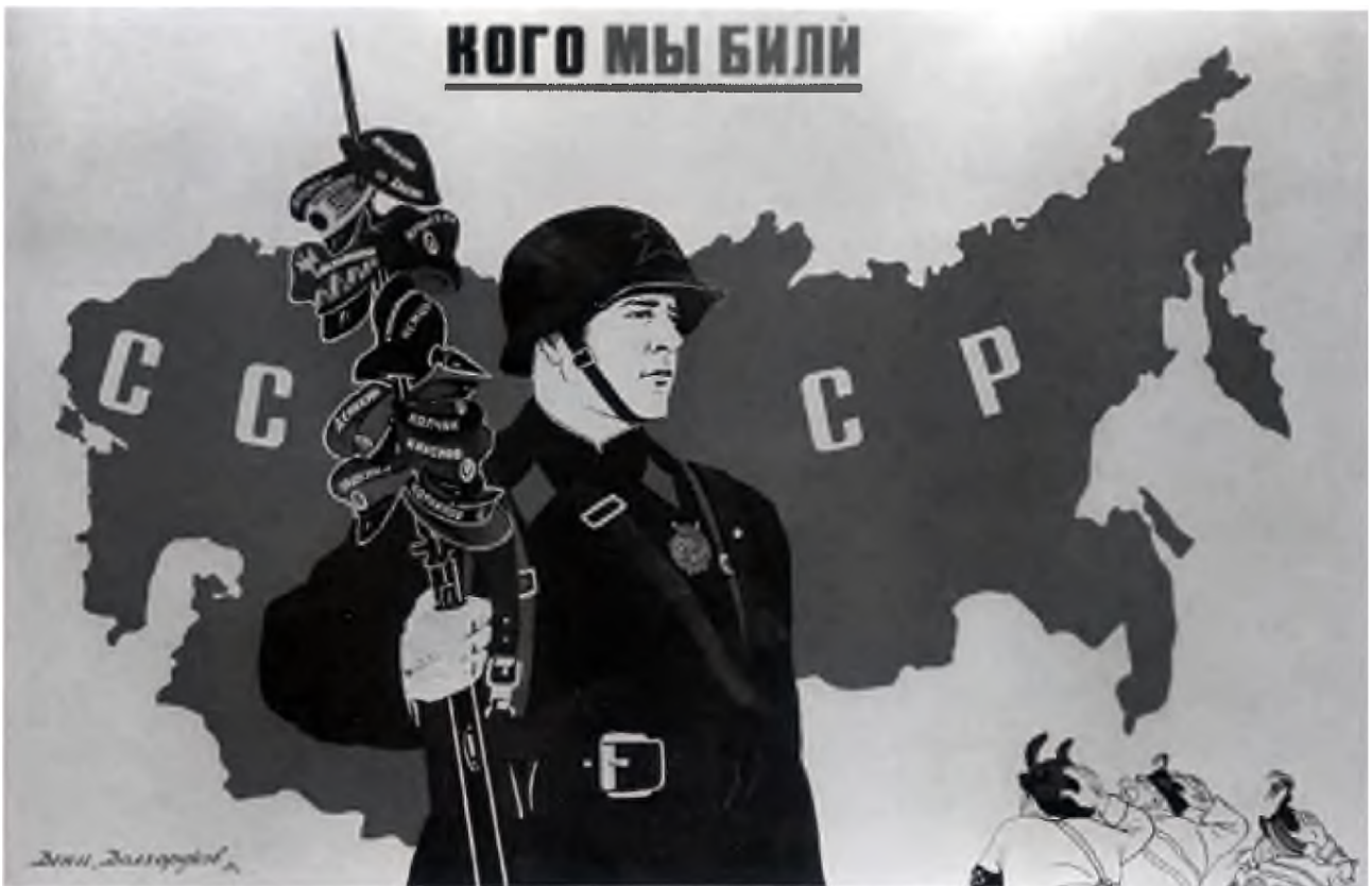
Плакат «Кого мы били» (художники Николай Долгоруков и Виктор Дени, 1939 год).