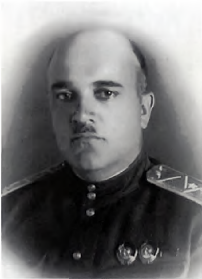
Завенягин Авраамий Павлович. Портрет. Дата неизвестна.