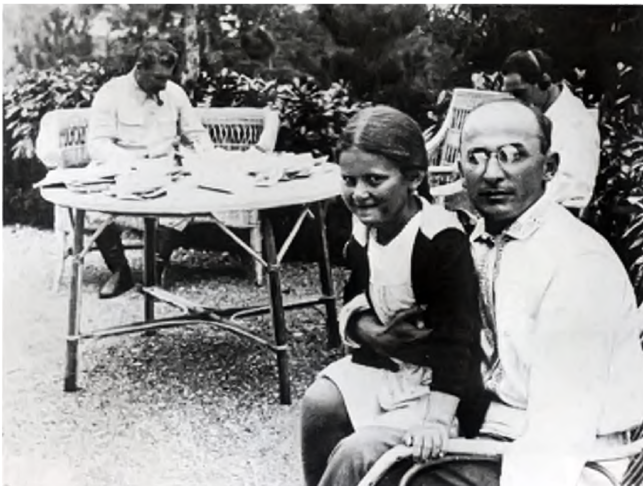
Берия с дочерью Сталина Светланой. 1930-е годы.