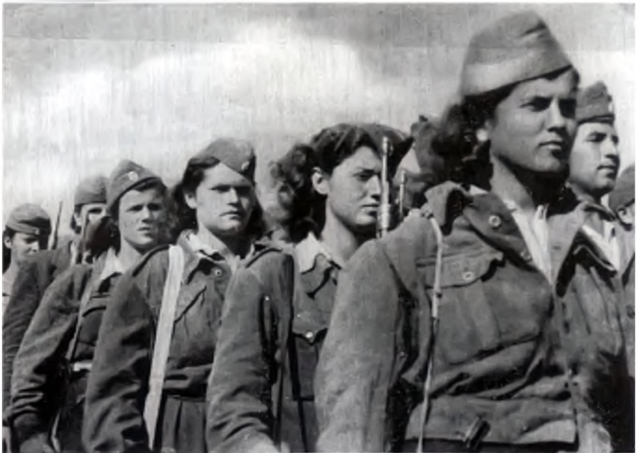
Женщины-бойцы испанской республиканской армии (1938 год.).