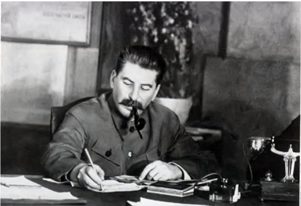
Сталин работает в своем кабинете (1 ноября 1938 года).