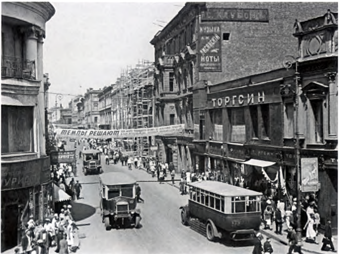
Москва 1939 года. Улица Петровка.