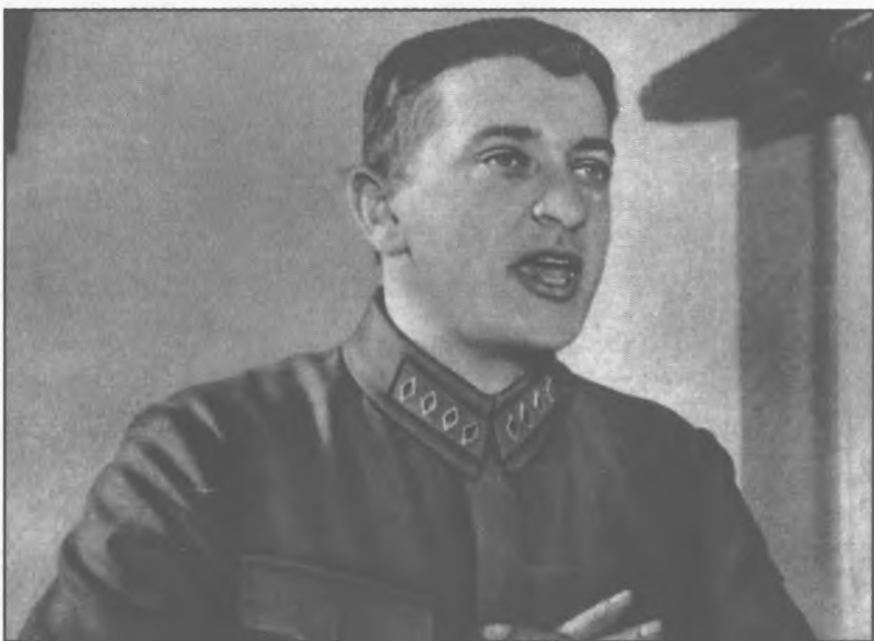
М. Н. Тухачевский читает лекцию в Военной академии имени М. В. Фрунзе. 1928 г.