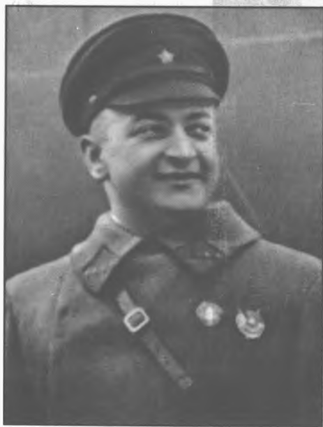
М. Н. Тухачевский. 1936 г.