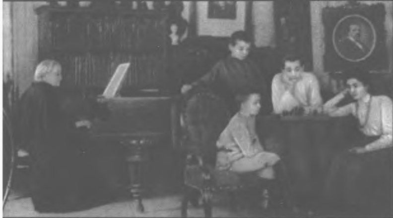
Вечер во Вражском. Первый слева (стоит) – Миша Тухачевский. 1903 г.