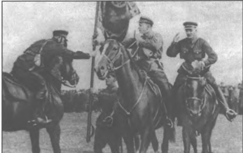
Празднование 10-й годовщины 4-й кав. дивизии. 1929 г.