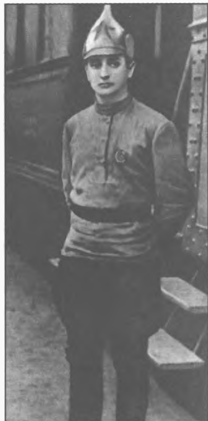
Командующий войсками Кавказско-го фронта. 1920 г.