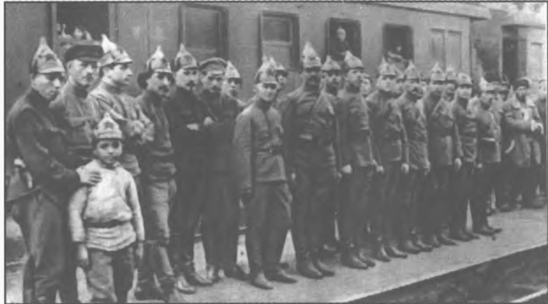
В кругу соратников по Кавказскому фронту. 1920 г.