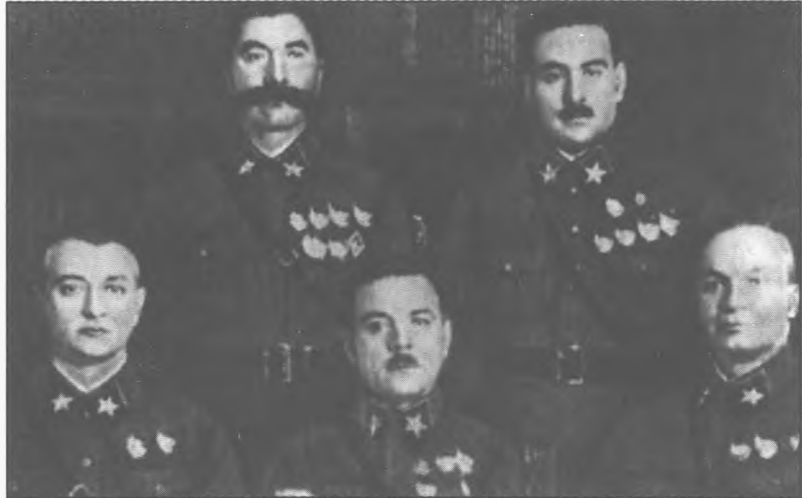
Первые маршалы Советского Союза. Сидят (слева направо): М. Н. Тухачевский, К. Е. Ворошилов, А. И. Егоров; стоят: С. М. Буденный, В. К. Блюхер