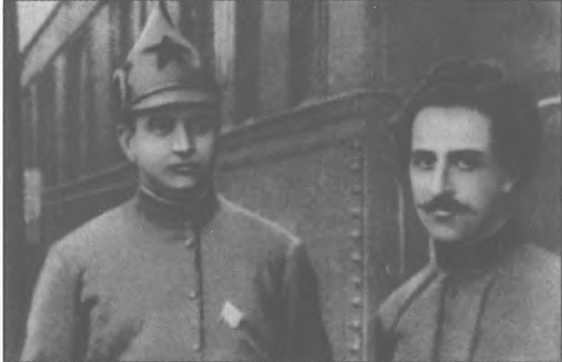
М. Н. Тухачевский и Г. К. Орджоникидзе на Кавказском фронте. 1920 г.