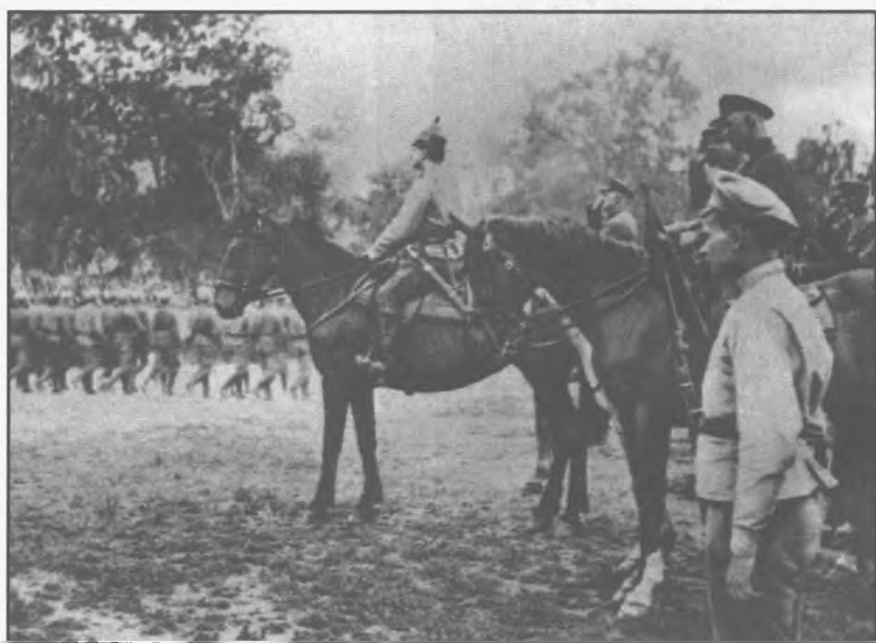
М. Н.Тухачевский на строевом смотре частей Западного фронта. 1920г.