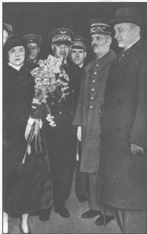
М. Н. Тухачевский в Париже. 1936 г.