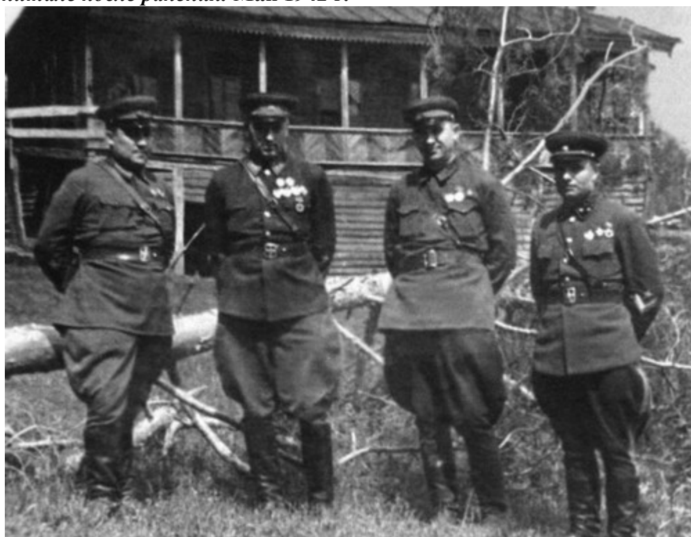
С командным составом 16-й армии. Лето 1942 г.