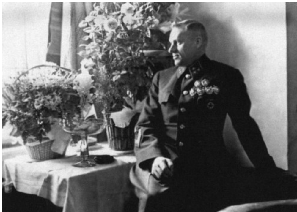
В госпитале после ранения. Май 1942 г.