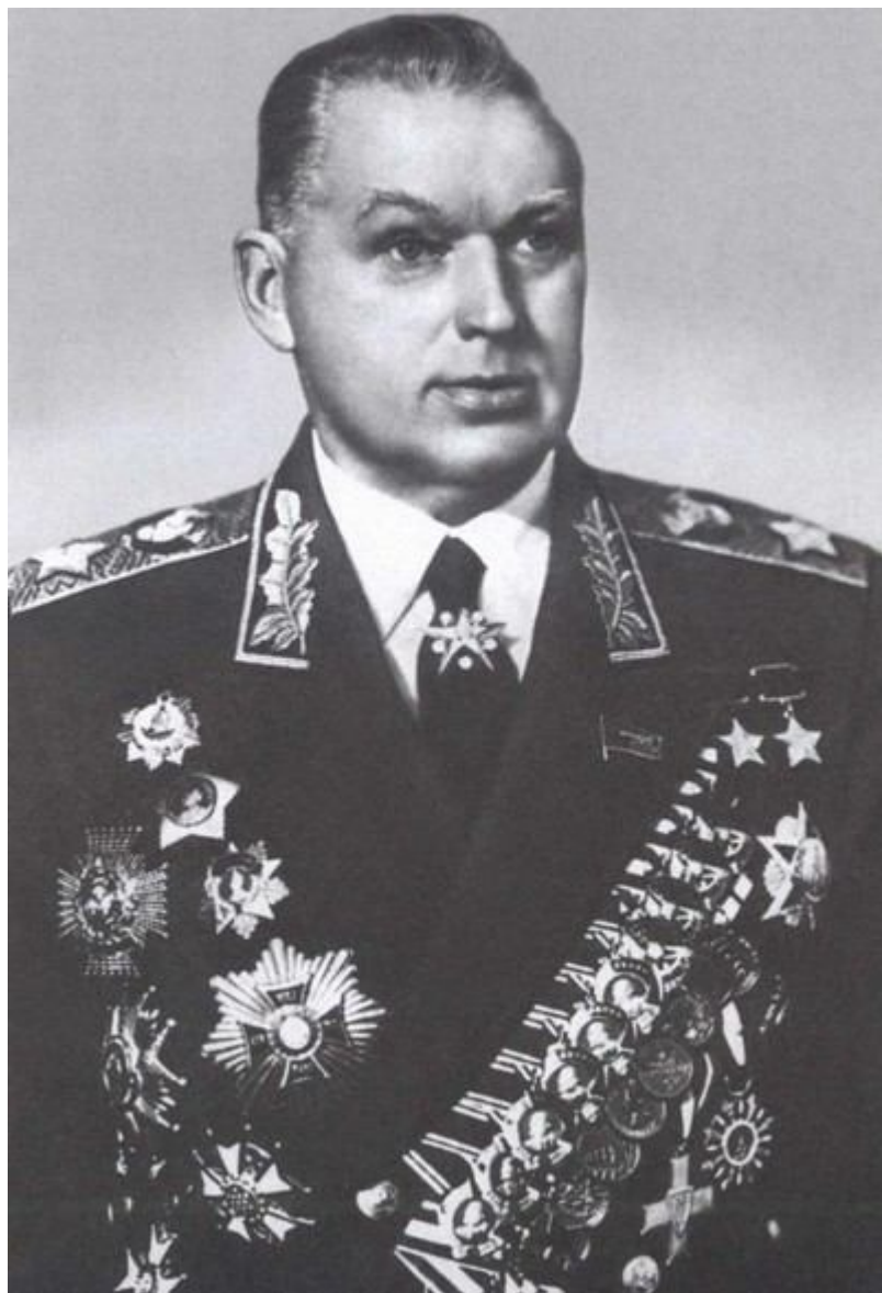
Парадное фото «маршала Победы»