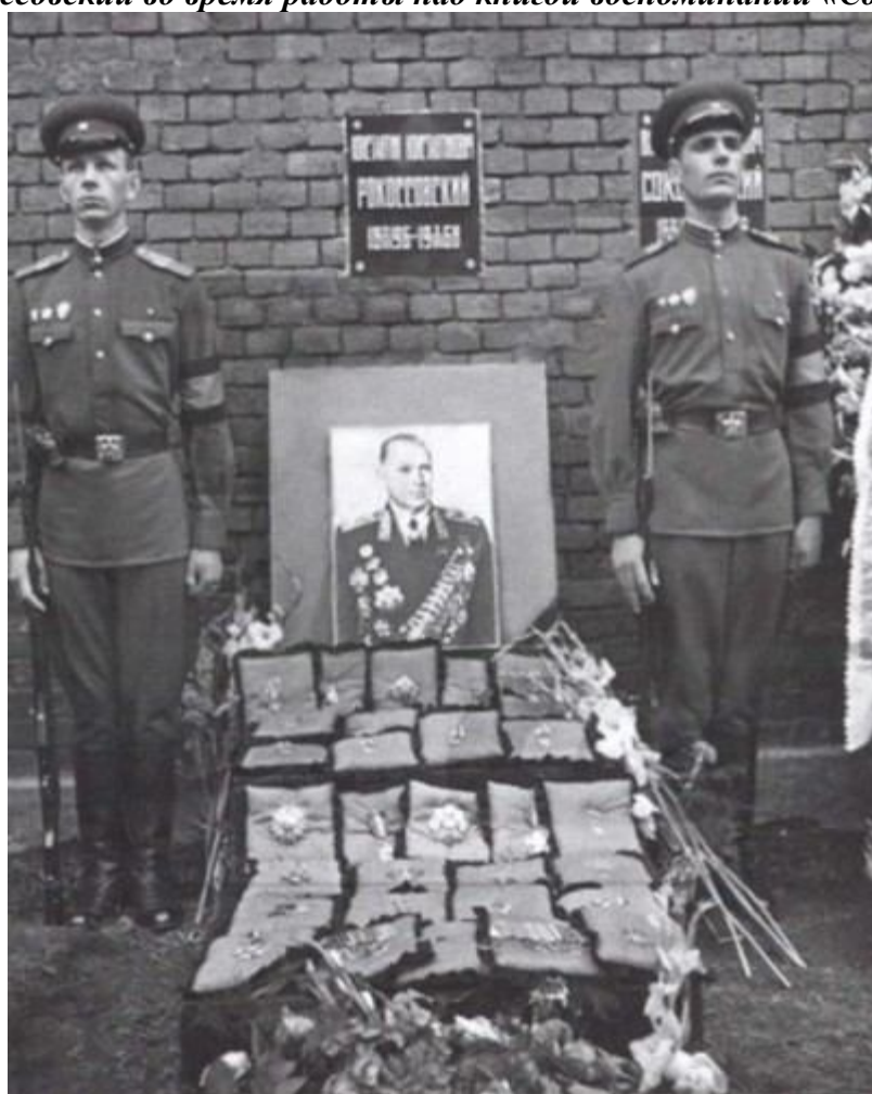
Похороны Рокоссовского. Москва, 5 августа 1968 г.