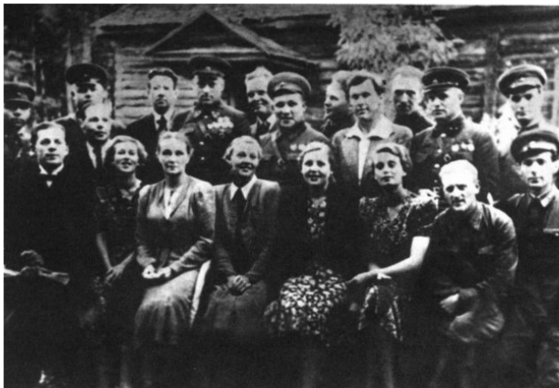
Рокоссовский с группой московских артистов, прибывших на фронт с выступлениями