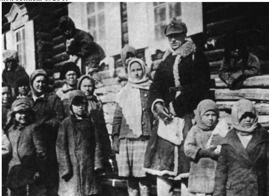
Рокоссовский в Забайкалье. 1931 г.