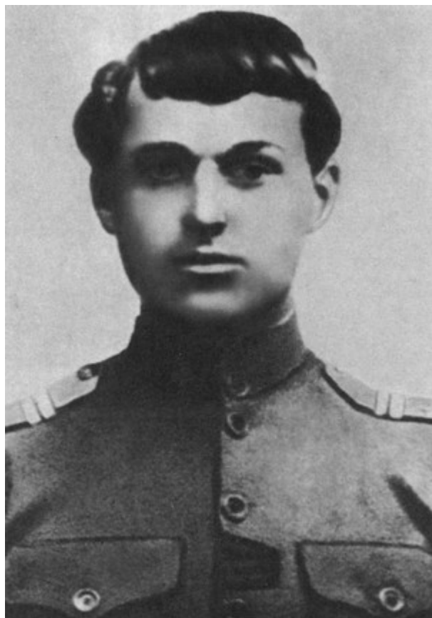
Драгун Константин Рокоссовский. 1916 г.