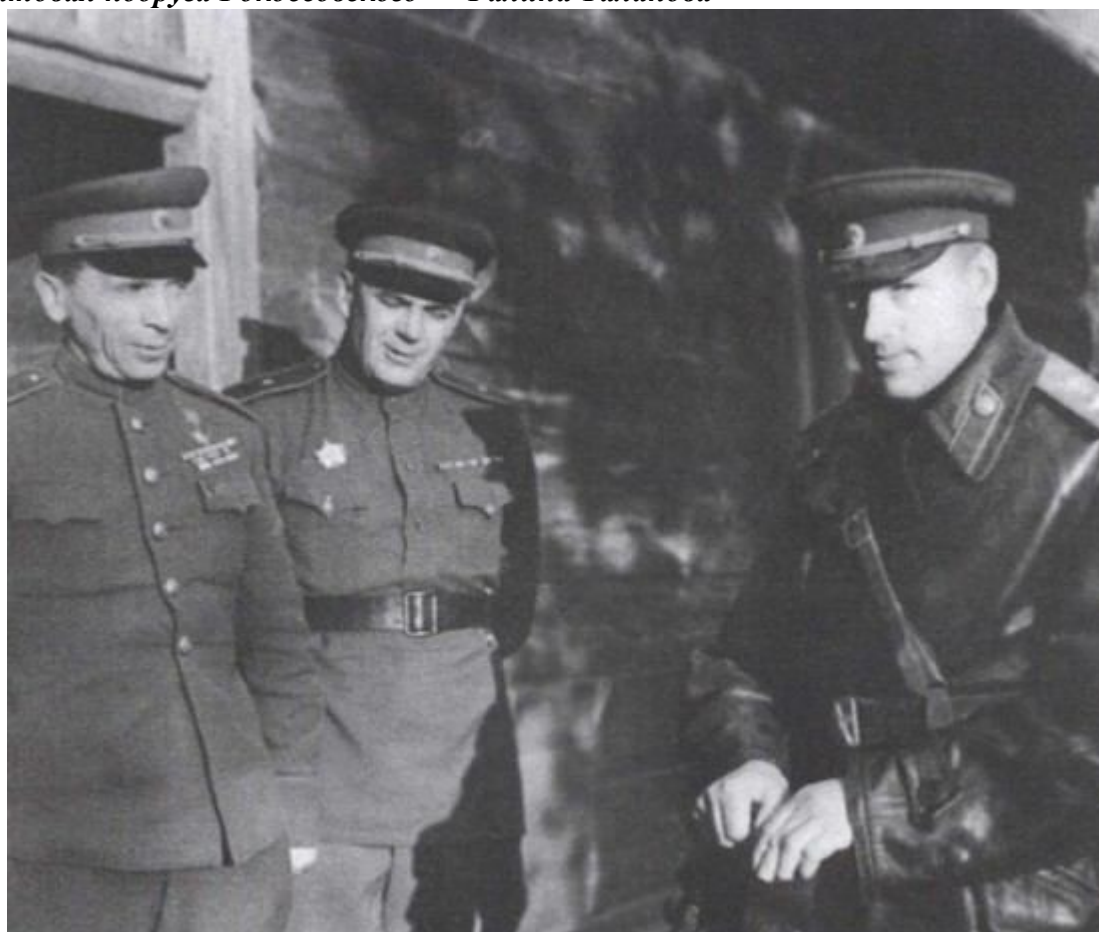
Рокоссовский и Батов в расположении 65-й армии в дни операции «Багратион»