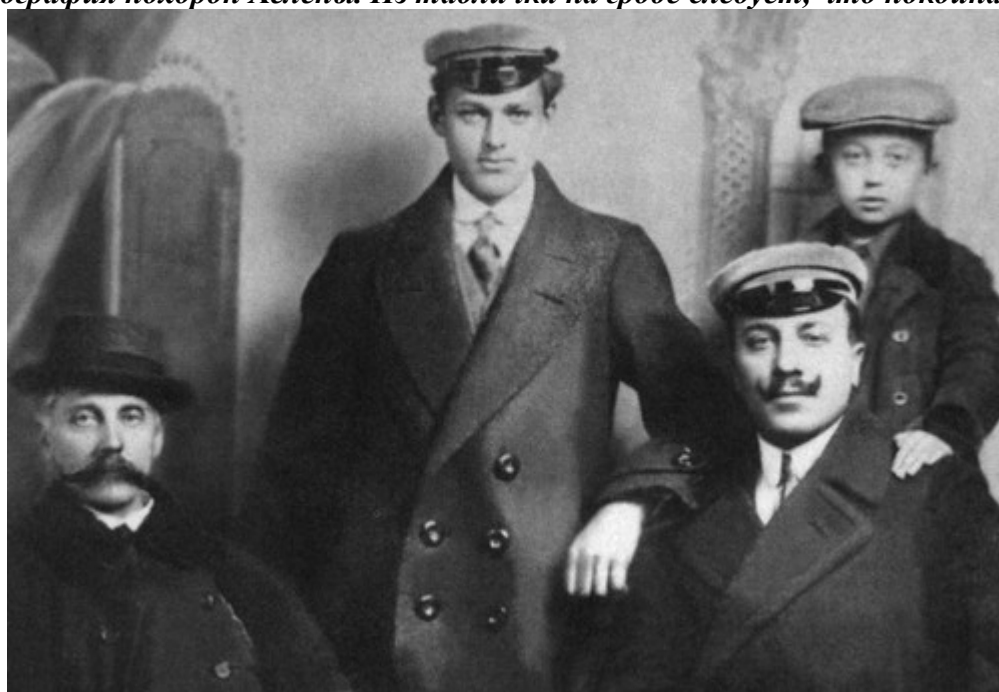
Рокоссовский (в центре) с дядей Константином (первый слева) и двумя его сыновьями — Павлом и Винценты