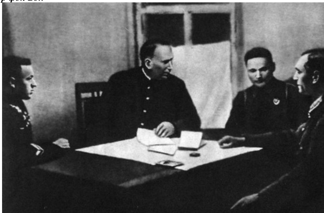
Рокоссовский и генерал Н. Н. Воронов допрашивают взятого в плен под Сталинградом фельдмаршала Паулюса