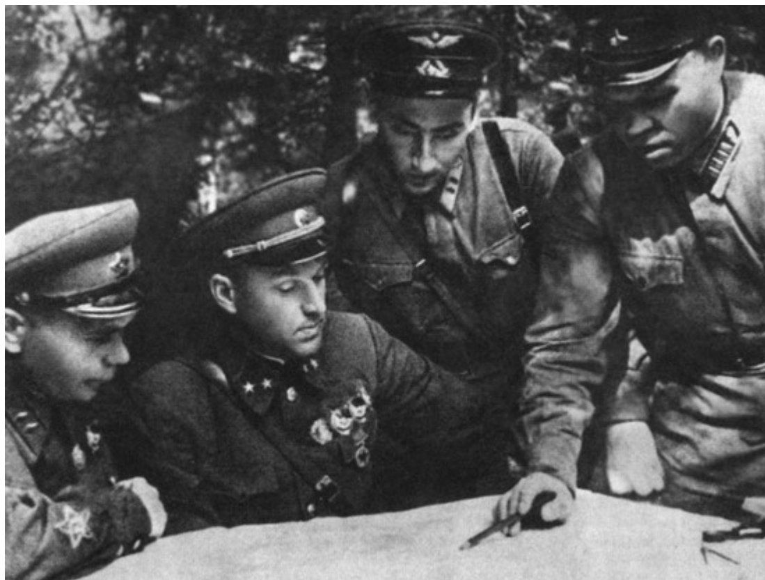
Командир 16-й армии Рокоссовский и его подчиненные во время боев под Волоколамском