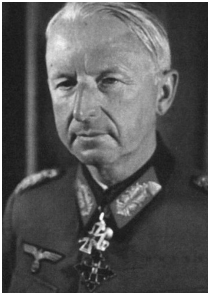
Эрих фон Манштейн