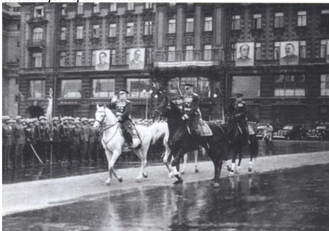
Жуков и Рокоссовский принимают Парад Победы