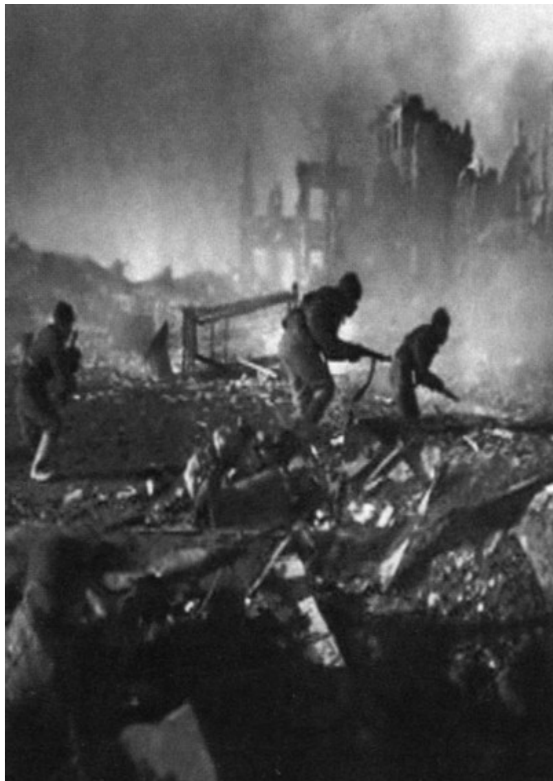
Уличные бои в Сталинграде