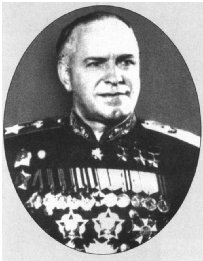
Г. К. Жуков