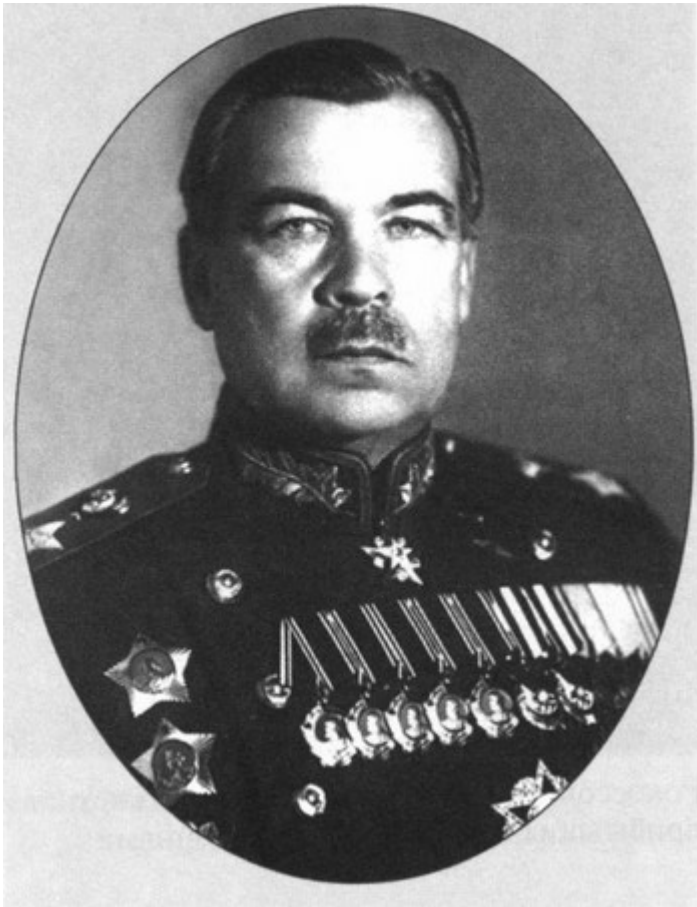
Л. А. Говоров