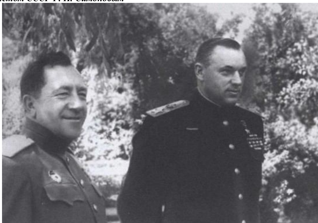
Рокоссовский с боевыми товарищами — генералом Н. С. Осликовским...