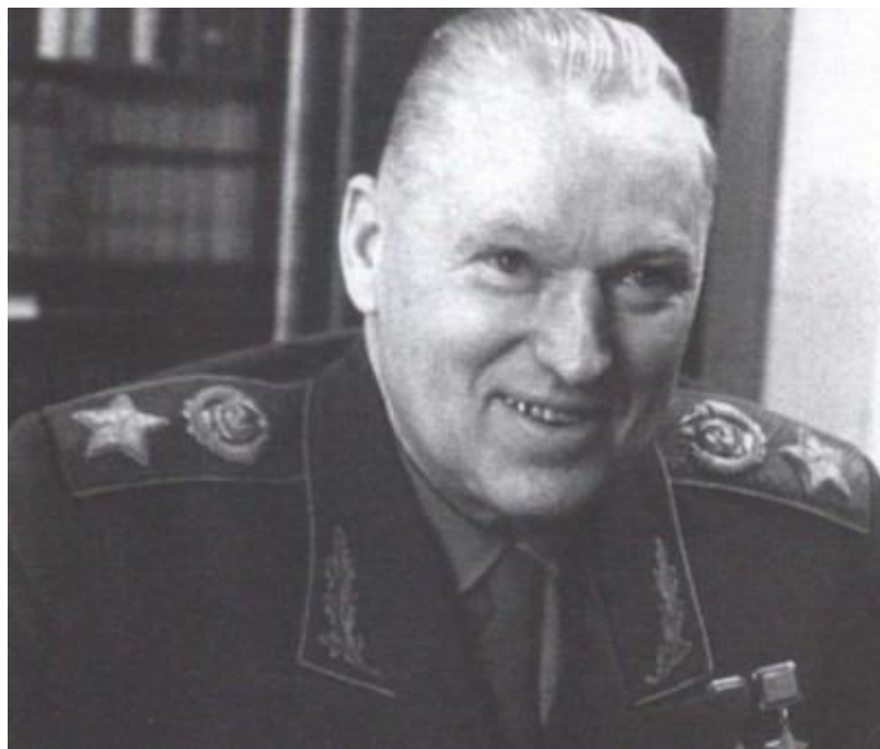
Рокоссовский во время работы над книгой воспоминаний «Солдатский долг»