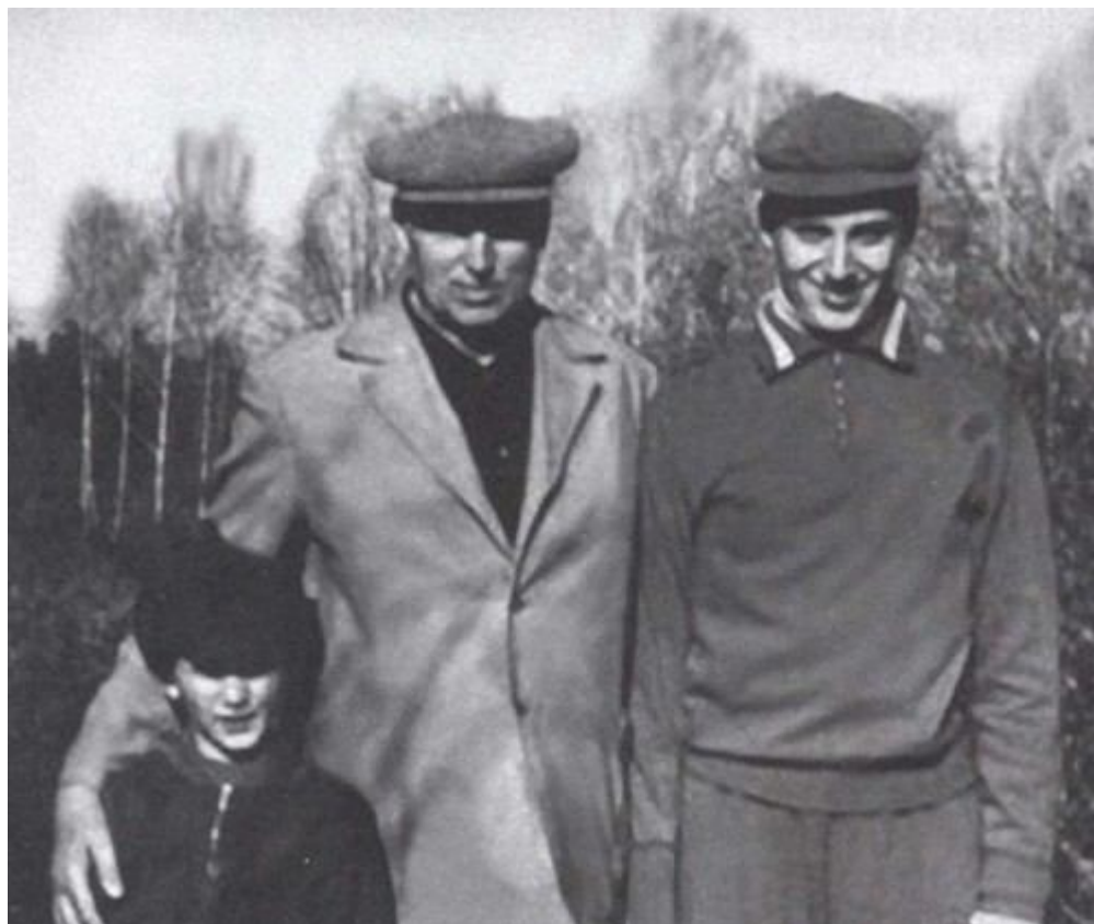
Маршал с внуками