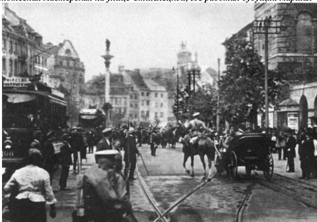
Последние части русской армии покидают Варшаву. 1915 г.