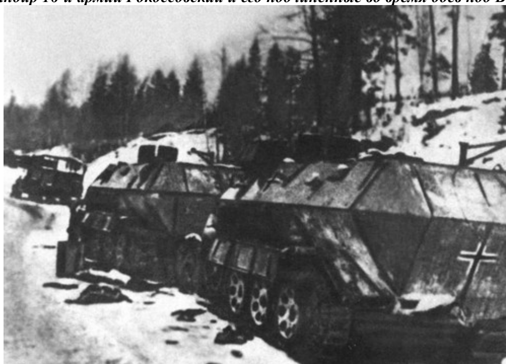
Немецкая техника, брошенная при отступлении от Москвы