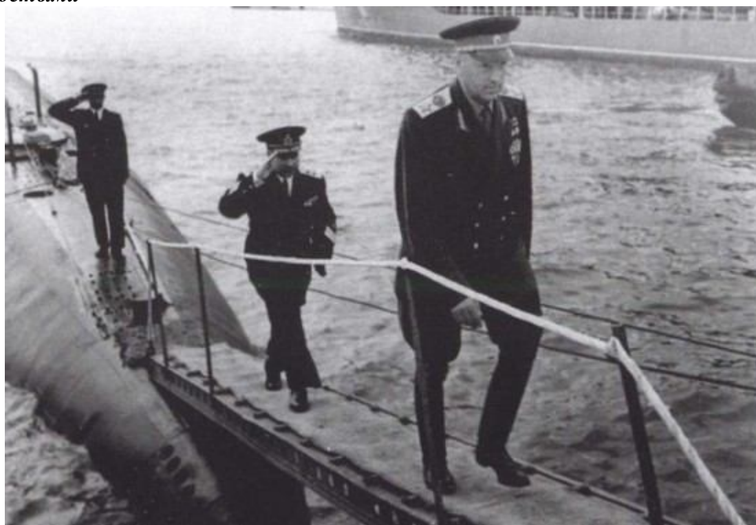
Главный военный инспектор Министерства обороны Рокоссовский на Северном флоте. 1962 г.