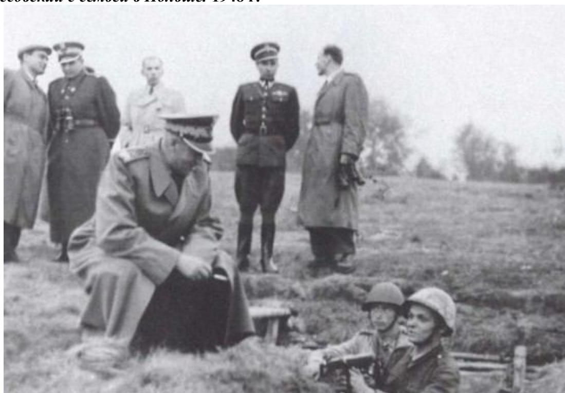
На маневрах Войска польского