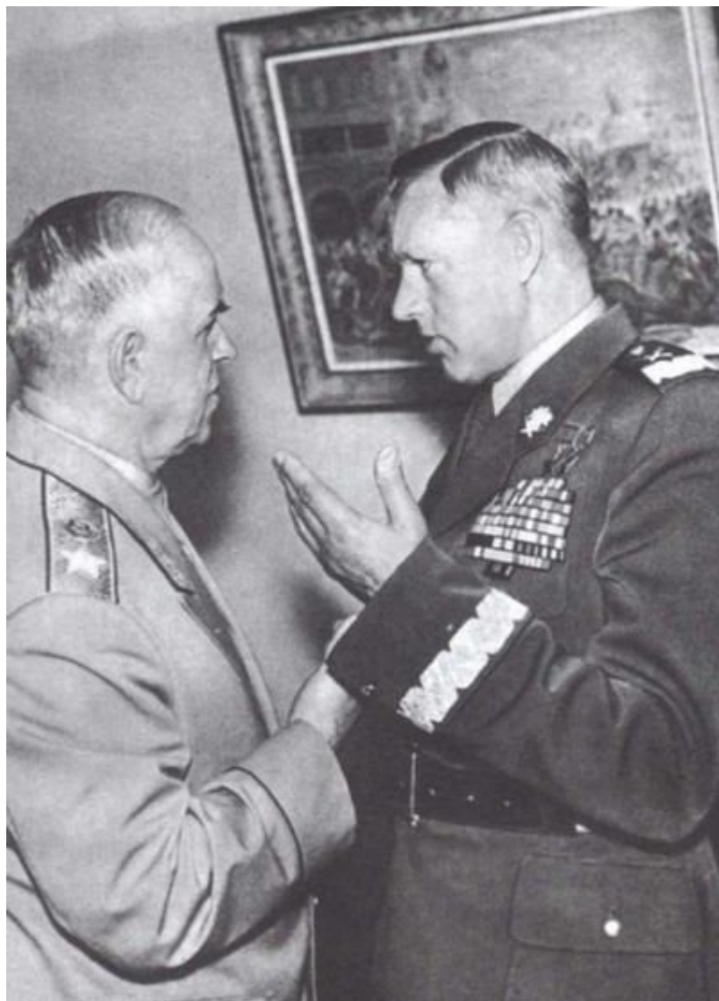
Жуков и Рокоссовский в 1956 году. Отношения двух «маршалов Победы» всегда были непростыми