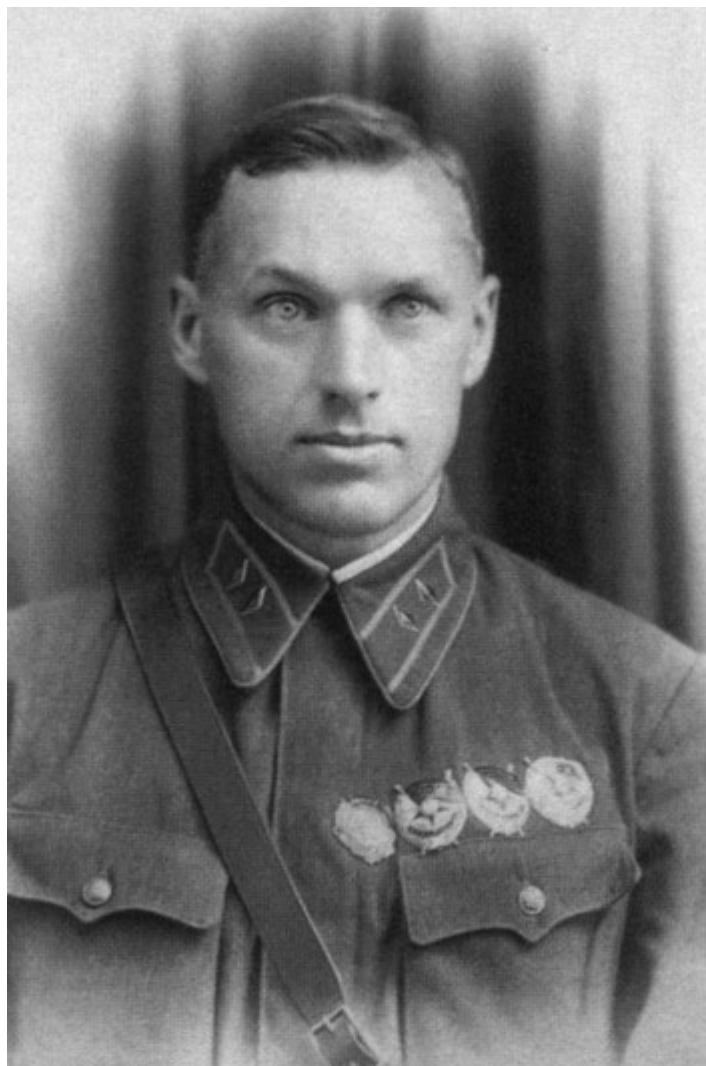
После освобождения из заключения. 1940 г.