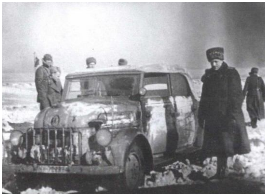
В заснеженной донской степи