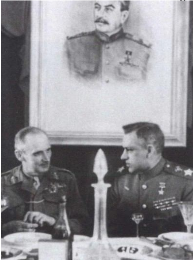
Встреча с британским фельдмаршалом Б. Монтгомери