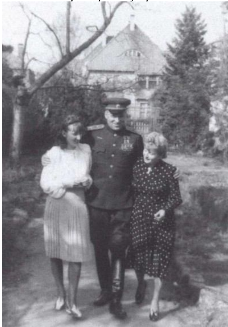
Рокоссовский с семьей в Польше. 1948 г.

Единственный в истории маршал двух армий — советской и польской