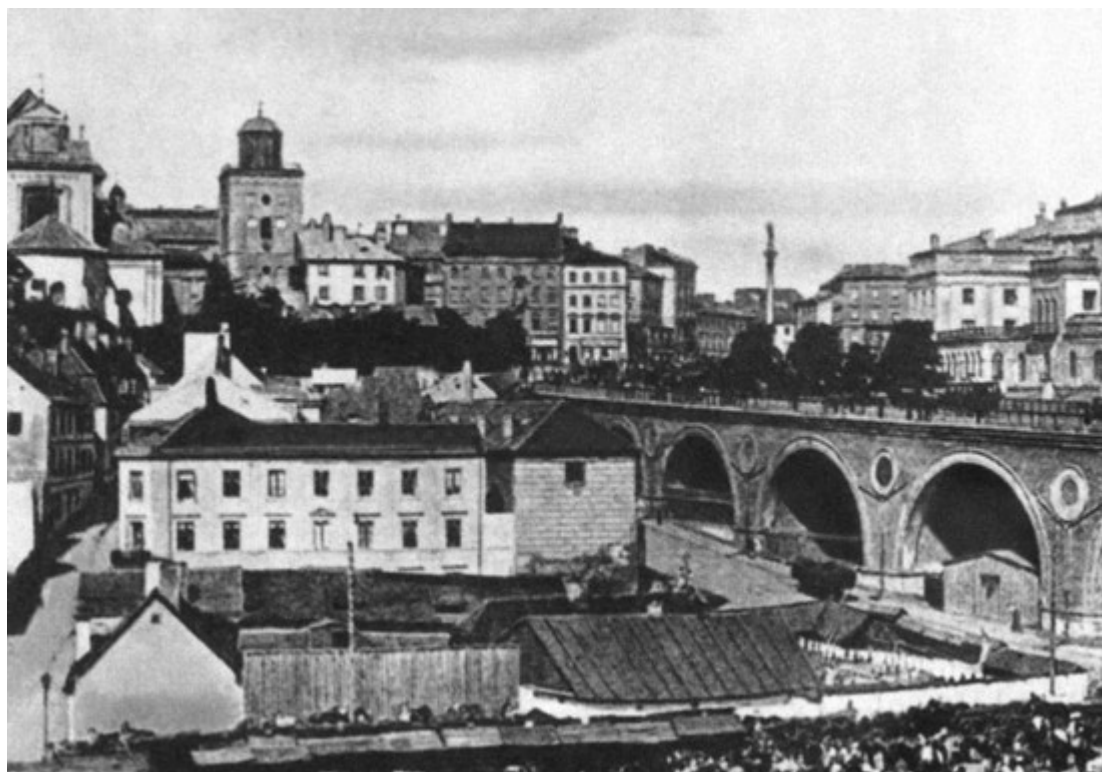
Варшава времен детства Кости Рокоссовского