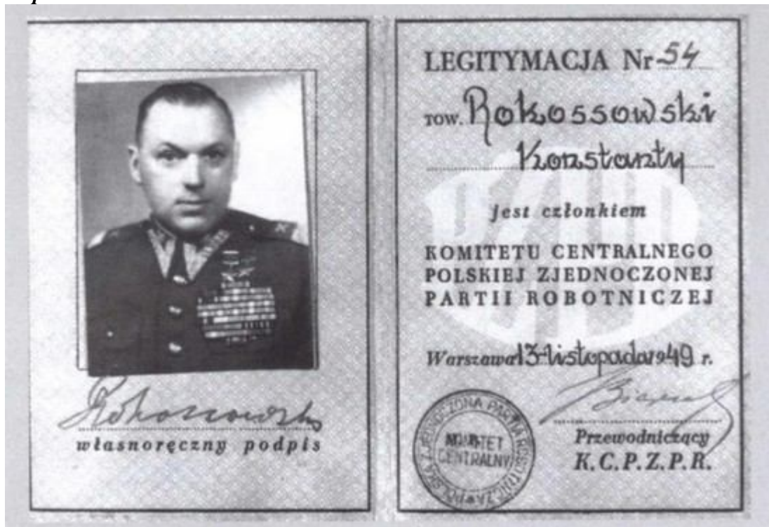
Удостоверение, выданное Рокоссовскому после его назначения министром обороны Польши