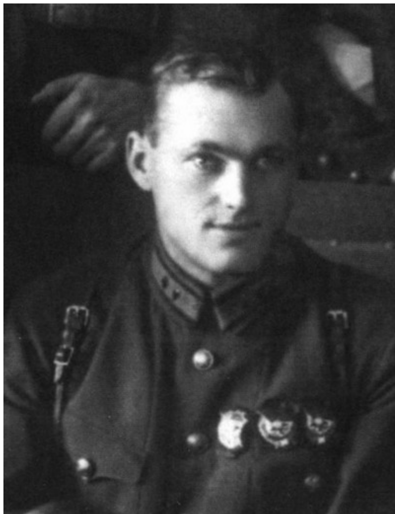
На курсах красных командиров в Москве. 1929 г.