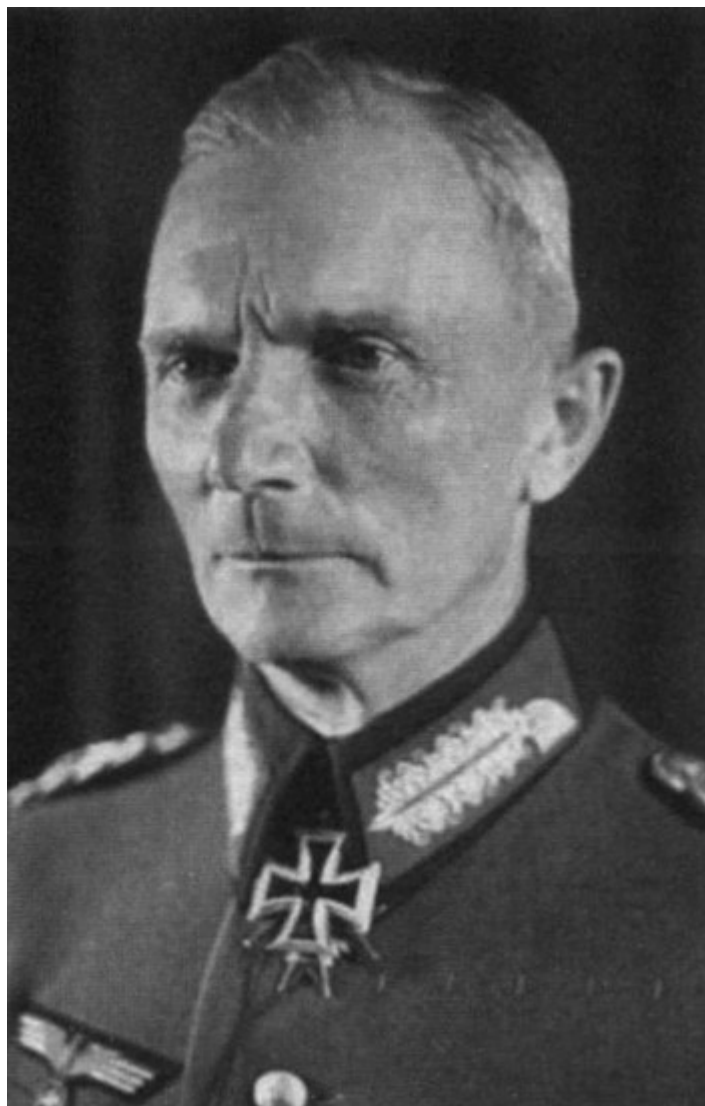
Федор фон Бок