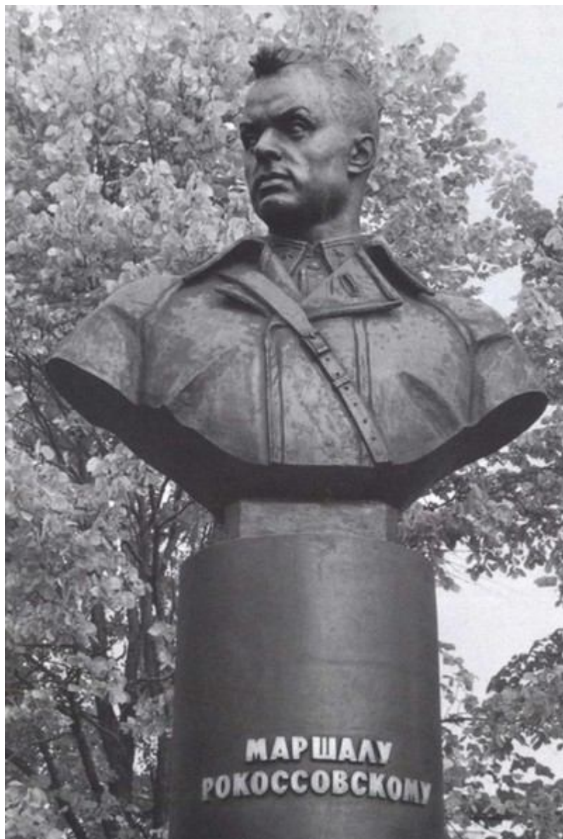
Памятник маршалу в подмосковном Зеленограде