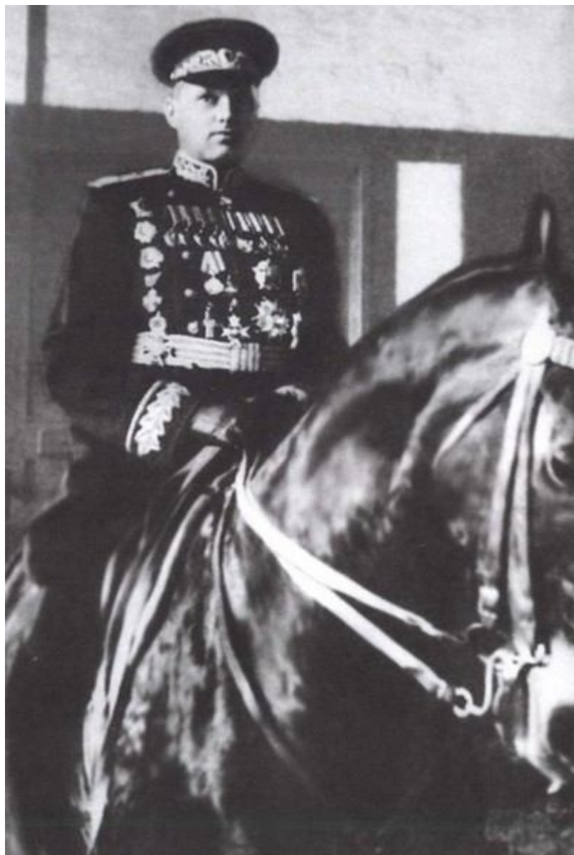
Рокоссовский перед Парадом Победы в Москве