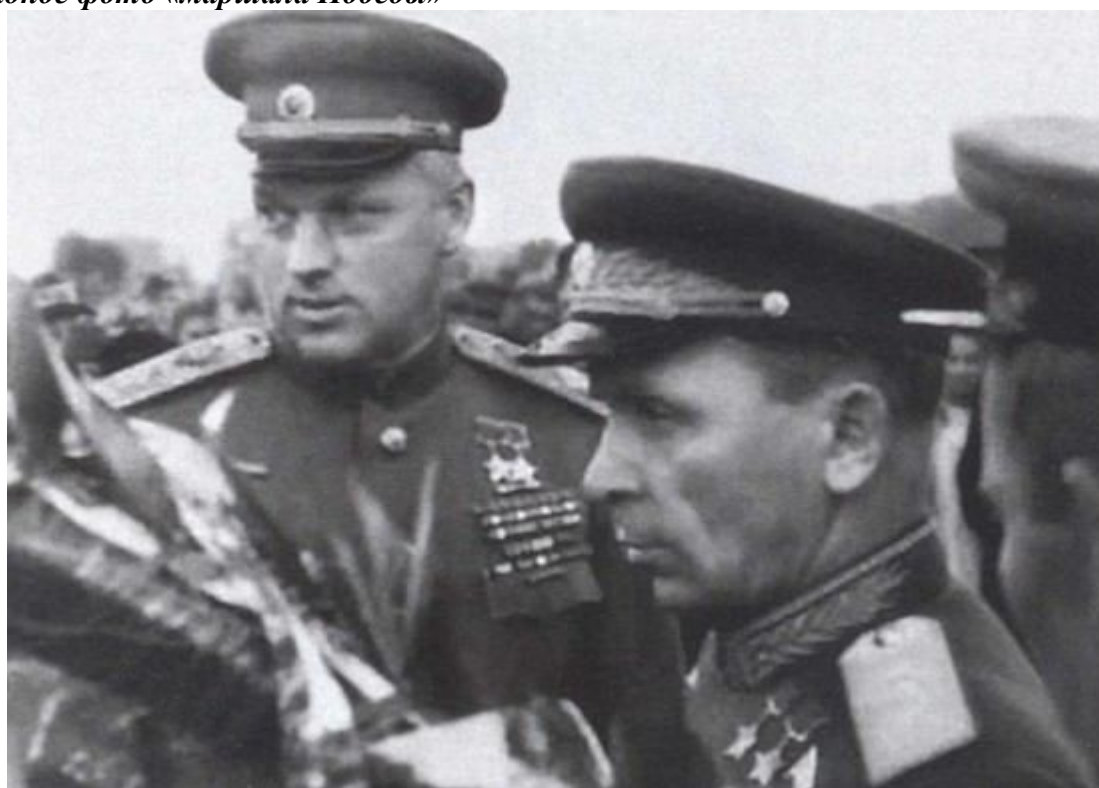
Рокоссовский и его друг — генерал П. И. Батов