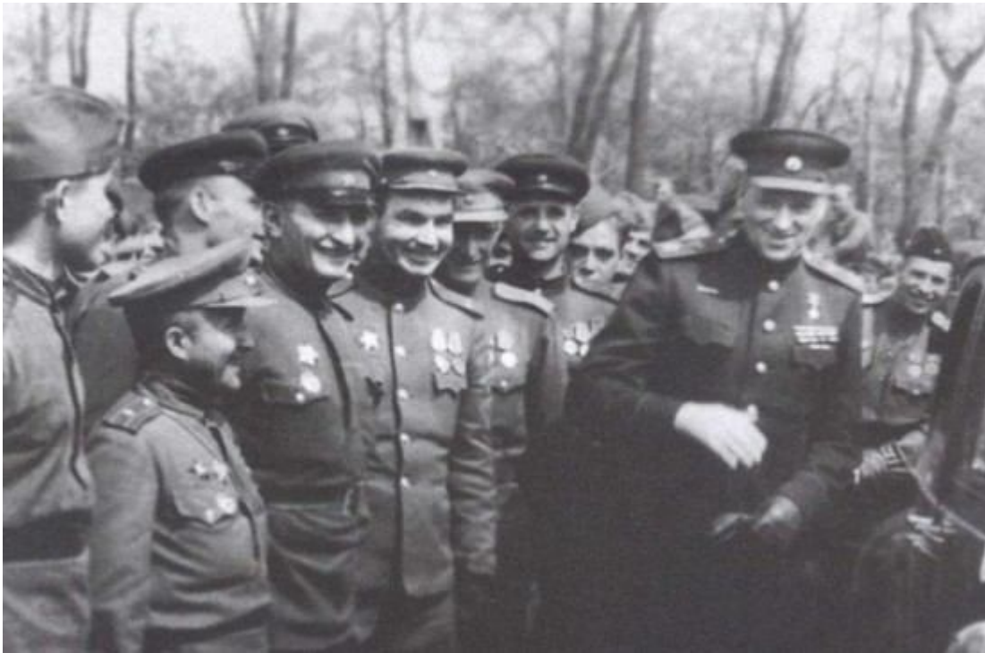
Победный май 1945-го. Рокоссовский с бойцами 2-го Белорусского фронта