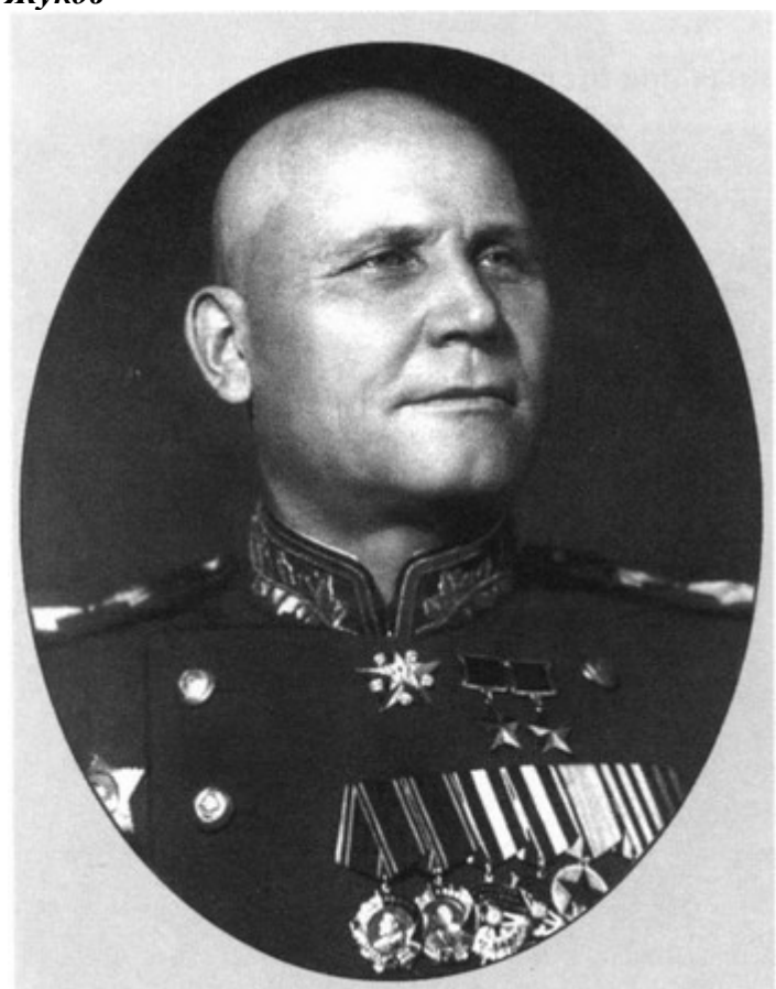
И. С. Конев