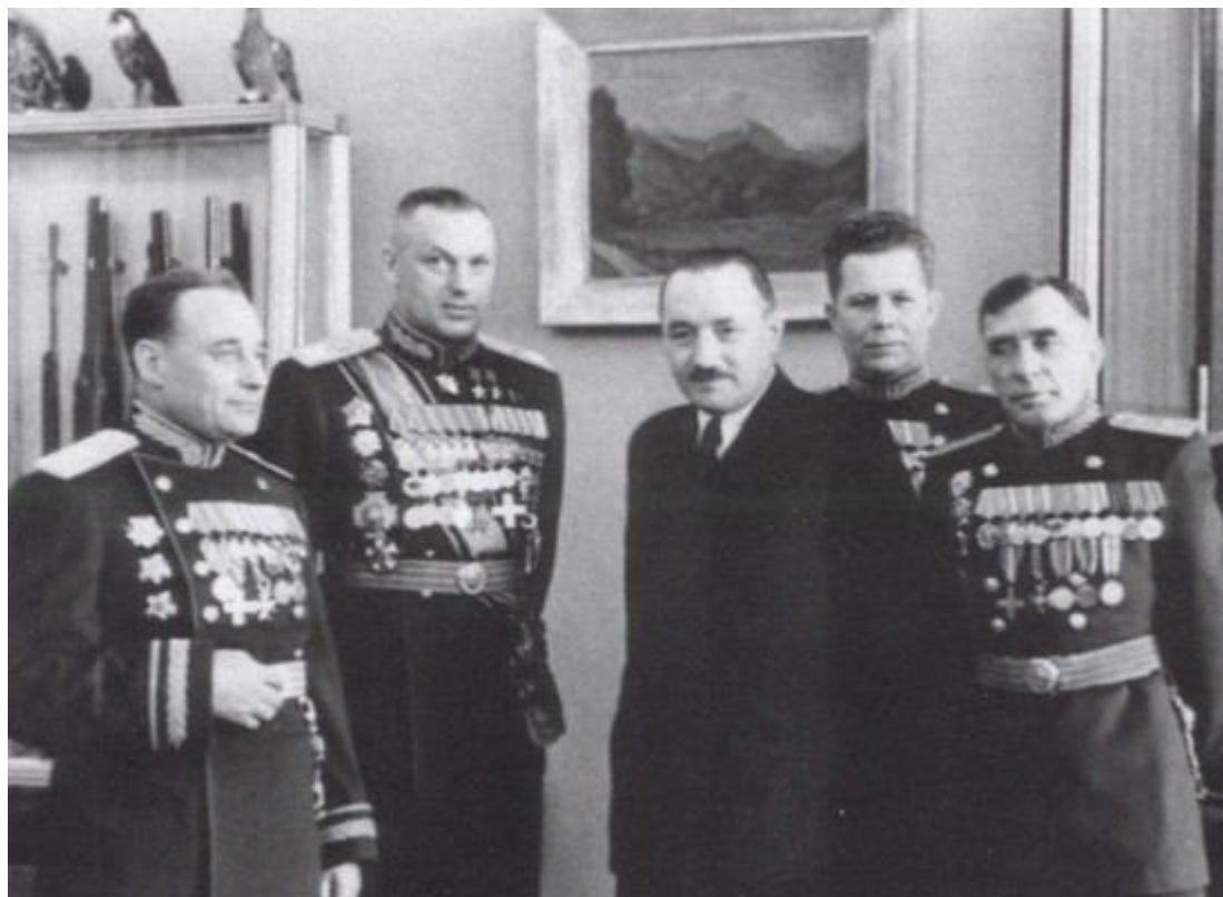
На приеме у президента Польши Болеслава Берута