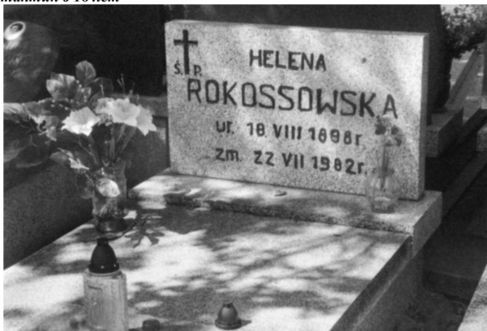
Могила сестры Рокоссовского Хелены с измененной датой рождения