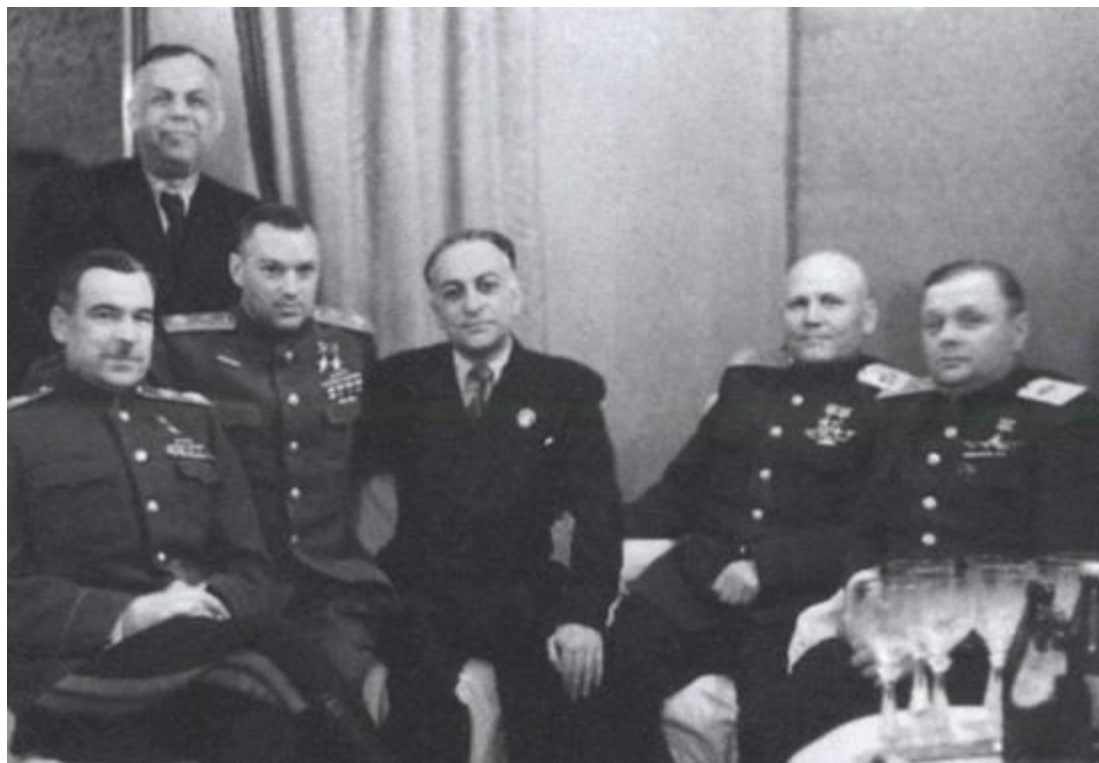
Начало мирной жизни. Маршалы Говоров, Рокоссовский, Конев и Мерецков с народным артистом СССР Р. Н. Симоновым