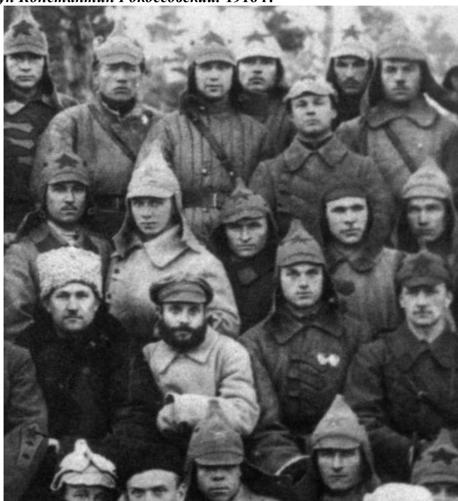
Командир 35-го кавалерийского полка Рокоссовский (второй слева во втором ряду) со своими бойцами. 1921 г.