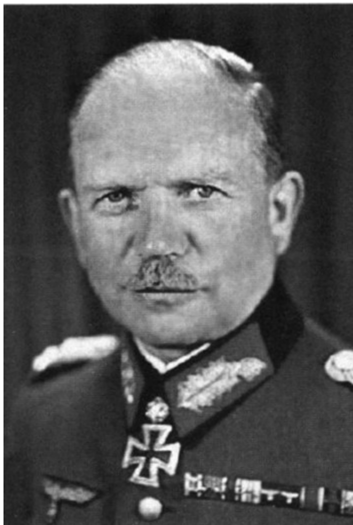
Ганс фон Клюге