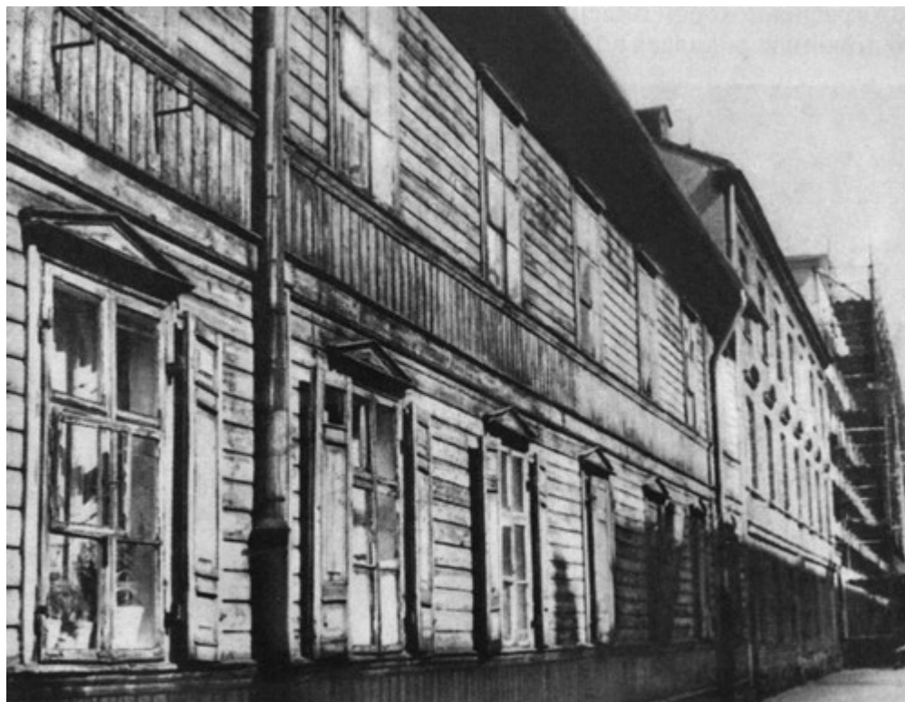
Каменотесная мастерская на улице Стшелецкой, где работал будущий маршал