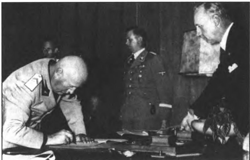
Муссолини подписывает Мюнхенский договор.