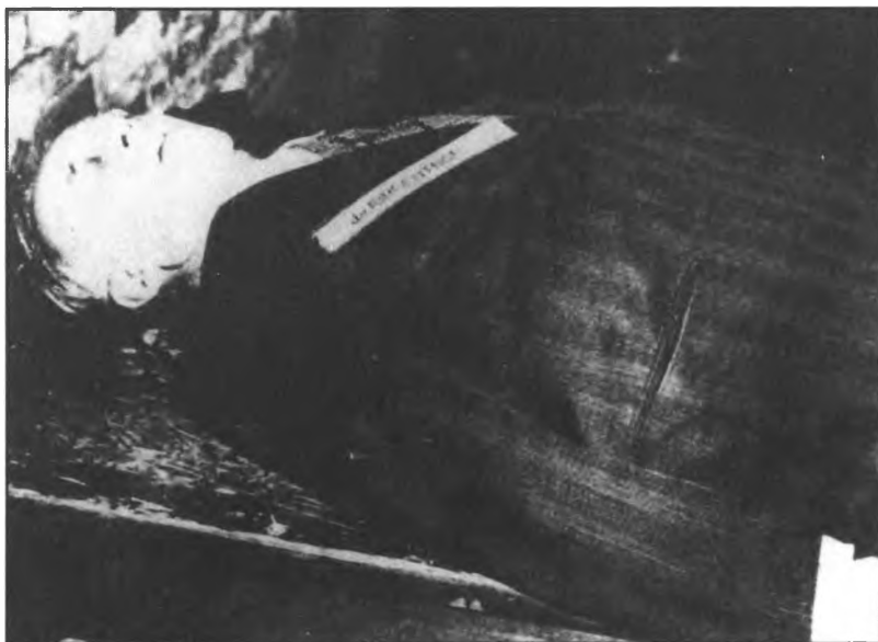
Приговор Нюрнбергского трибунала приведен в исполнение. 1946 год.