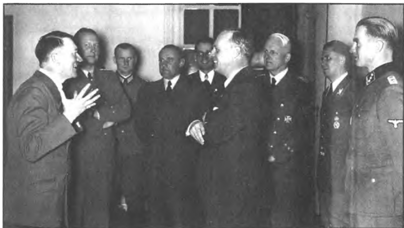
Гитлер и Риббентроп (в центре) вместе радуются заключению «Пакта о ненападении» между Россией и Германией. Август, 1939 год.