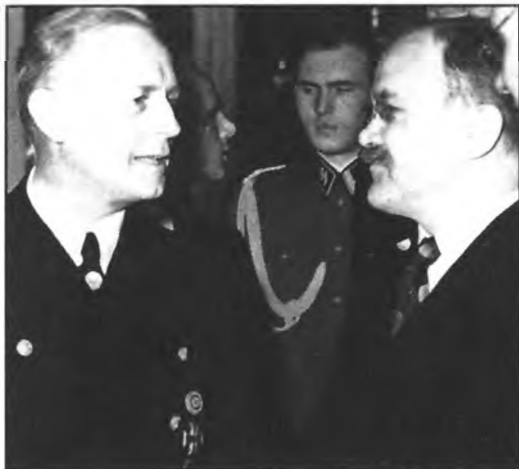
Переговоры с Молотовым в Берлине.