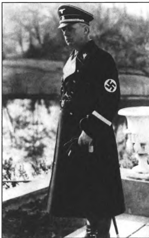
И. фон Риббентроп в день своего 45-летия. 30 апреля, 1938 год.