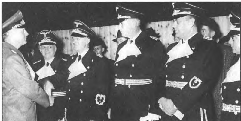
И. фон Риббентроп со своими сотрудниками.