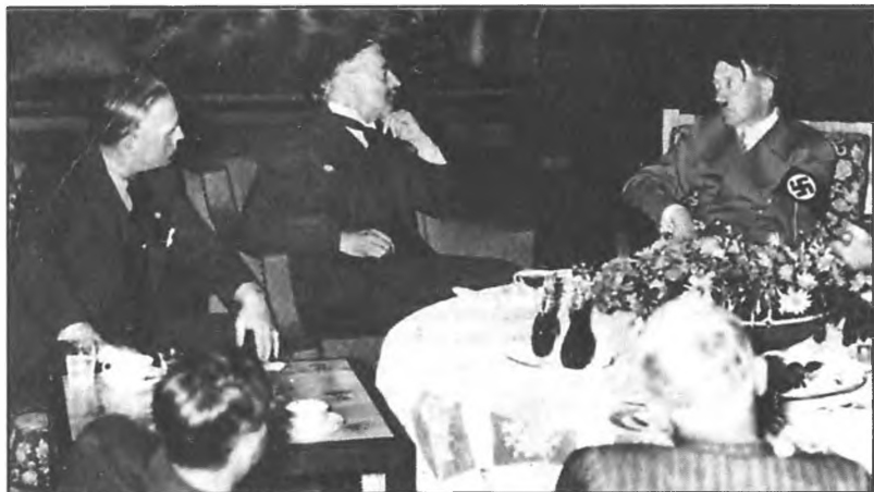
Риббентроп, Чемберлен и Гитлер во время переговоров в Мюнхене. Сентябрь, 1938 год.