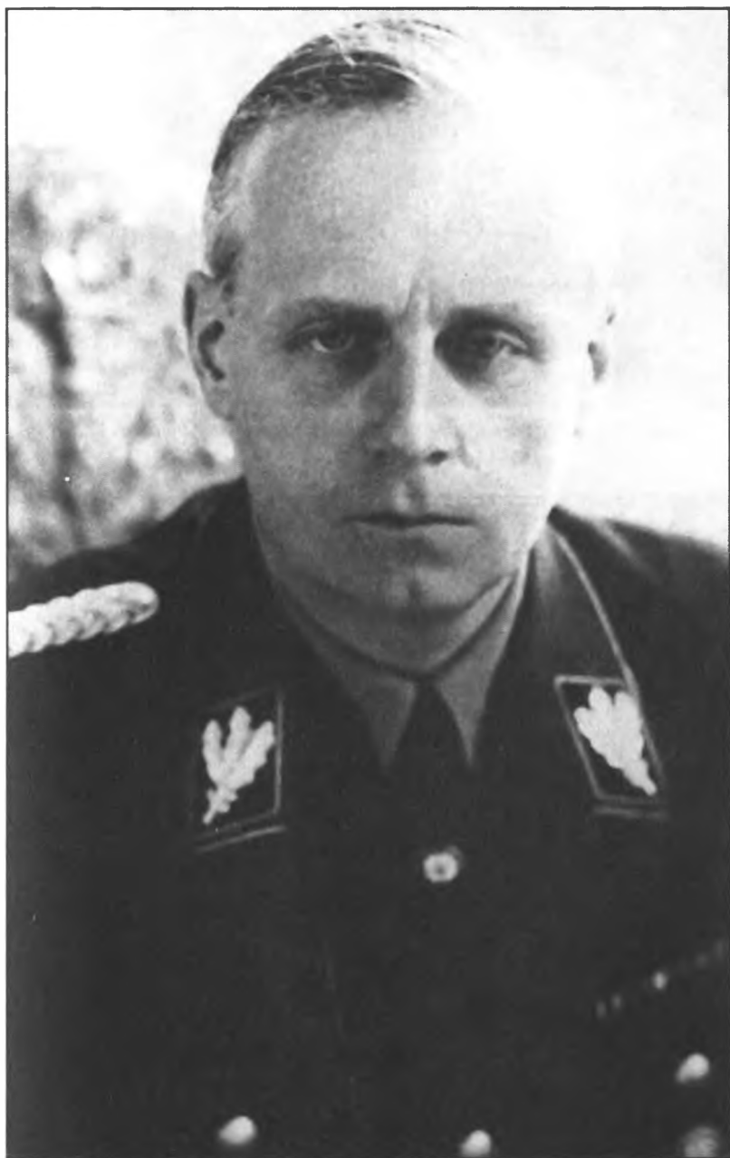
Рейхсминистр Иоахим фон Риббетрон. 1938 год.