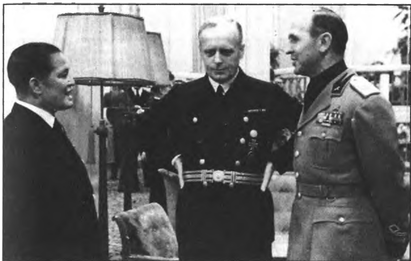
Риббентроп со своими японским и итальянским коллегами после подписания «Антикоминтерновского пакта».