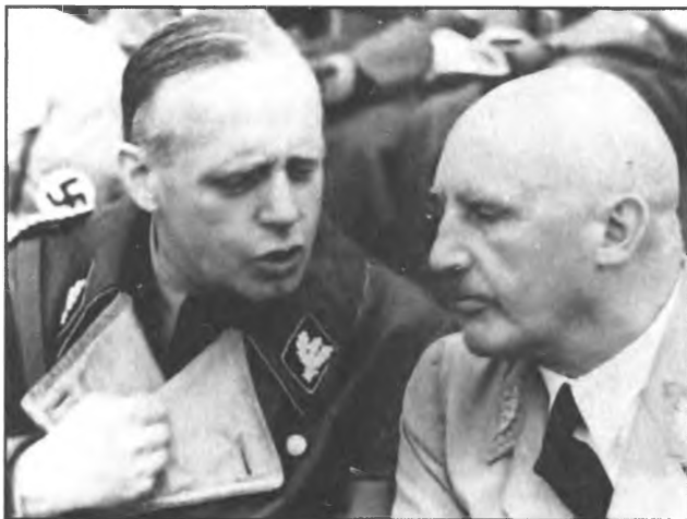
Иоахим фон Риббентроп на партийном съезде. 1936 год.