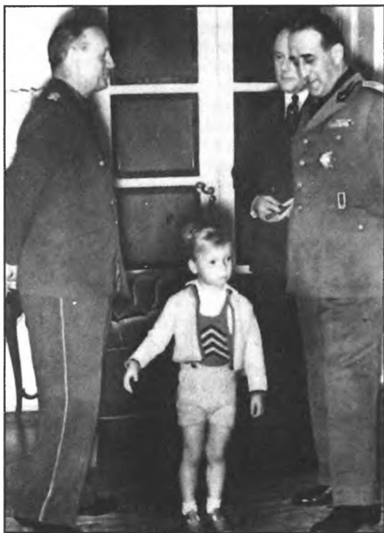
Визит в Рим. 27 мая, 1939 год.