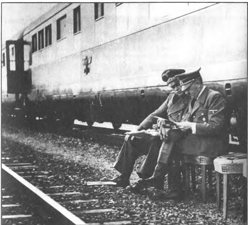
Разговор с фюрером накануне нападения на Польшу. 1939 год.