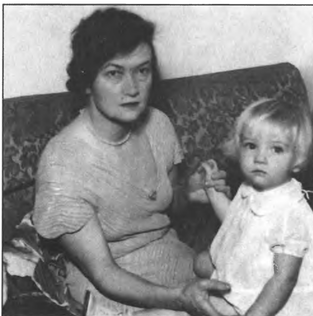
Жена Риббентропа с дочерью.