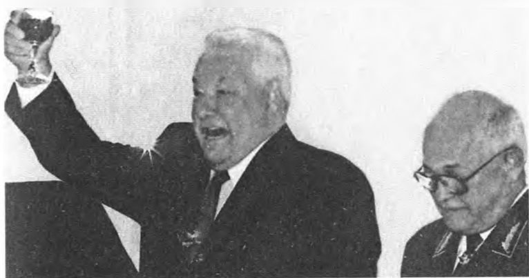
«Я поднял этот бокал... Прошу его реализовать». Тост Б. Н. Ельцина на встрече с выпускниками российских военных академий в Кремле. 1999 год

Верховный главнокомандующий «реализует» тост