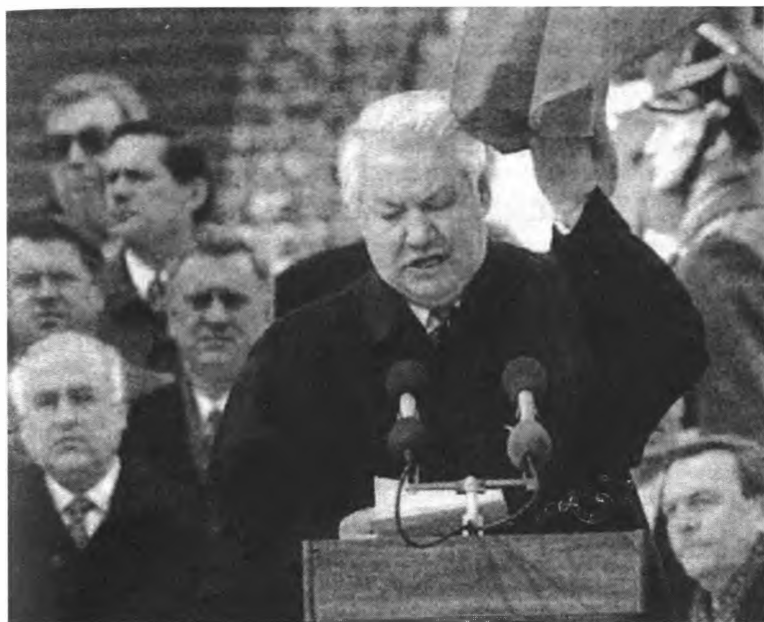
Президент Б. Н. Ельцин на работе