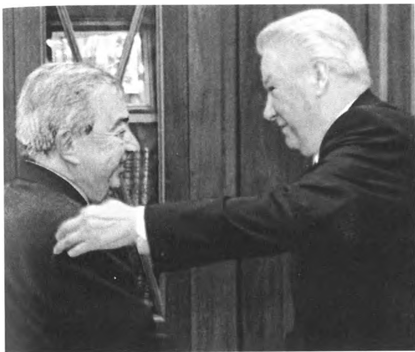
... с Евгением Примаковым