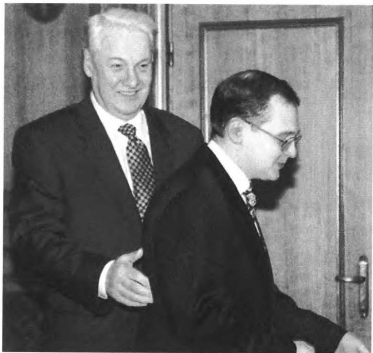
Б. Н. Ельцин разыгрывал эффектные и многозначительные сцены с премьерами. С Сергеем Кириенко...