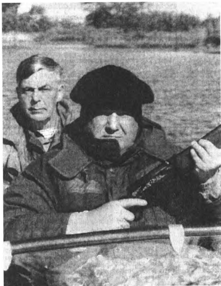
Карелия. Лето 1998 года