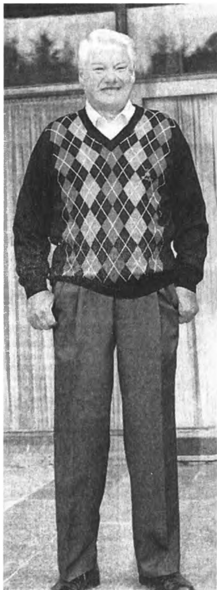
Завидово, 5 сентября 1996 года. Б. Н. Ельцин делает заявление о согласии лечь на операцию на сердце