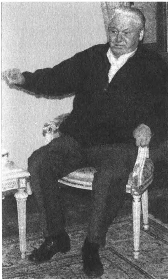
Ноябрь 1998 года. Кремль впервые признал, что во время избирательной кампании в 1996 году, Б. Н. Ельцин «практически на ногах перенес несколько инфарктов»