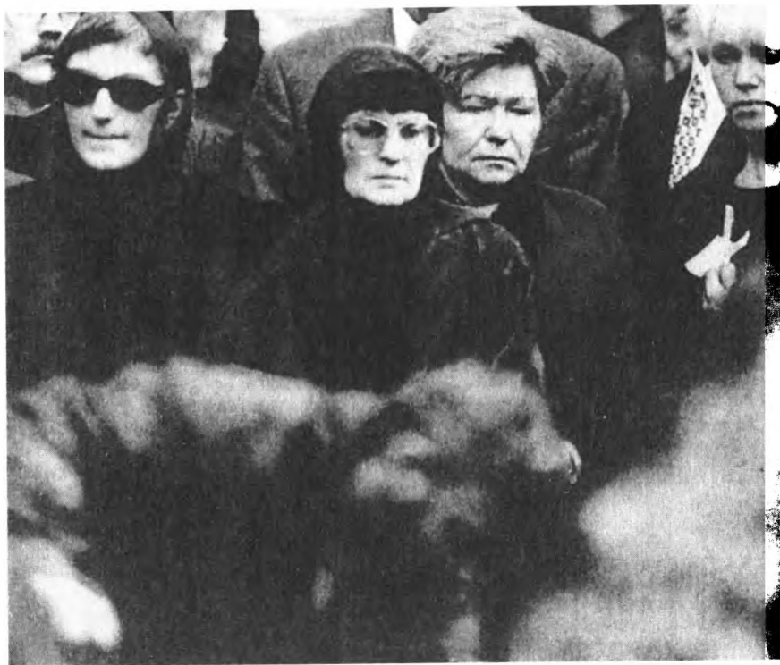
23 сентября 1999 года. Наина Ельцина провела у гроба Раисы Горбачевой много часов