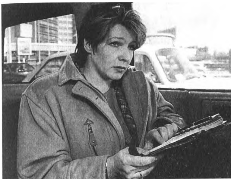
Президентская дочь продолжала работу и в автомобиле