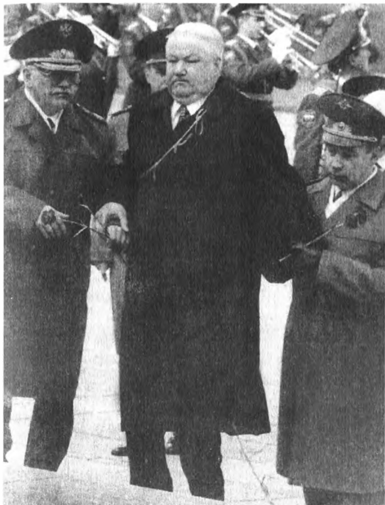
9 мая 1999 года. Во время возложения венка у Вечного огня в Александровском саду