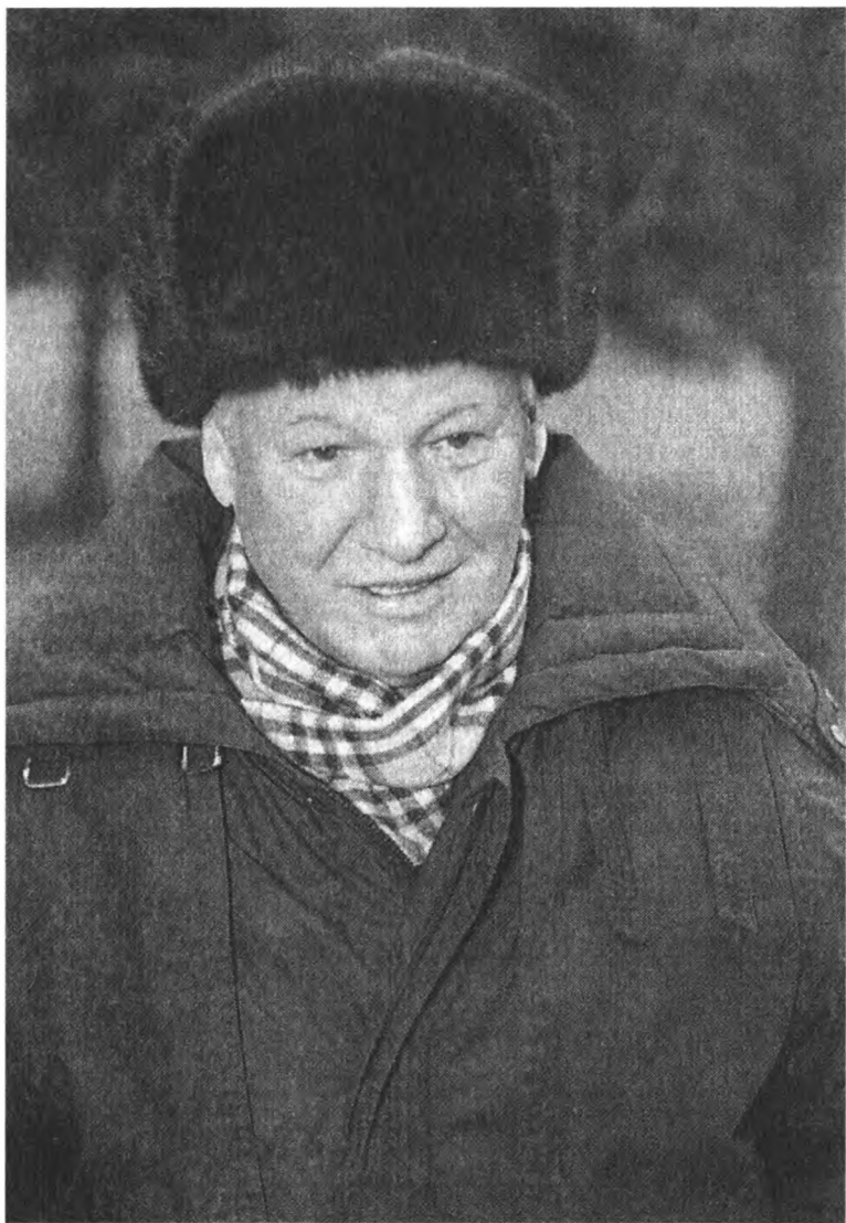
20 декабря 1996 года. Первая прогулка после операции шунтирования на сердце