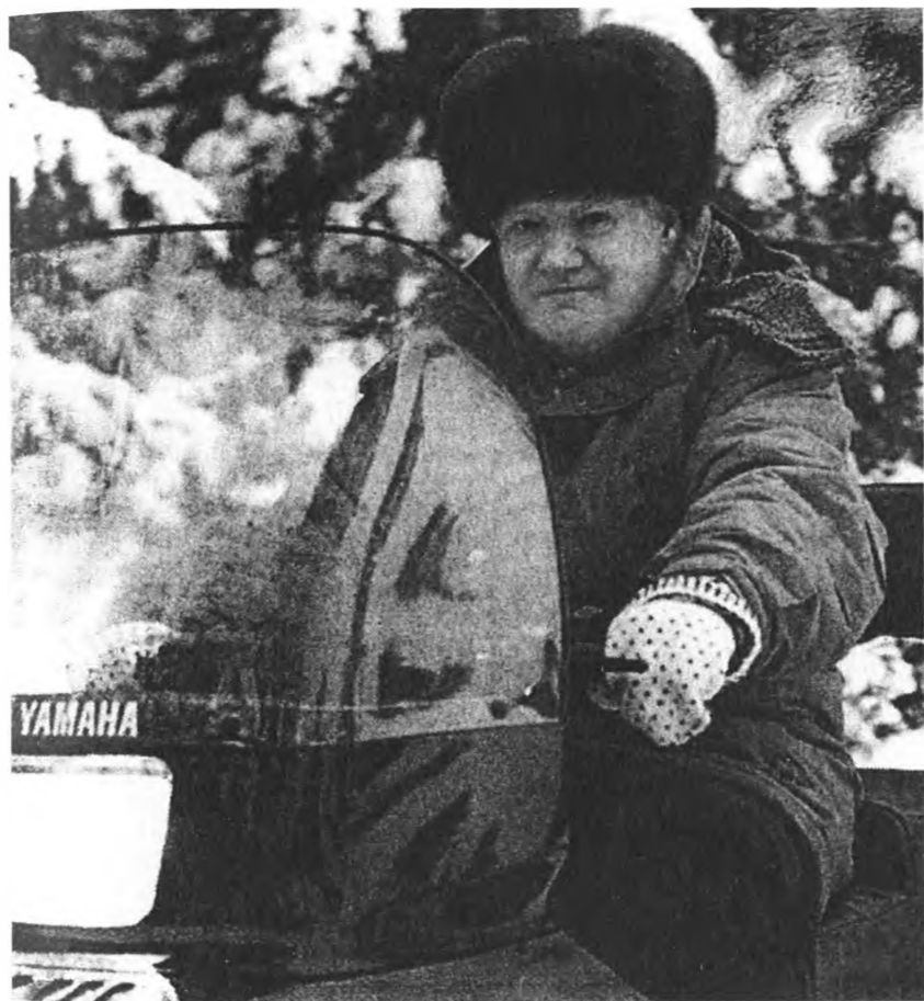
Зимний отдых, 1998 год