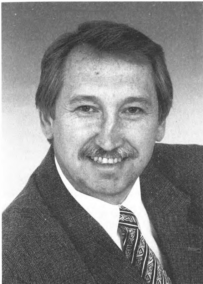
Председатель Комиссии Госдумы РФ по борьбе с коррупцией А. Д. Куликов ездил в конгресс США на слушания по делу о зарубежных счетах семьи Б. Н. Ельцина и других высокопоставленных должностных лиц