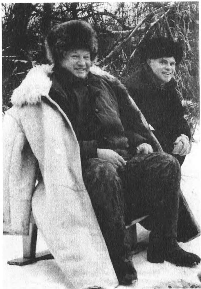
Таким он был в зените славы