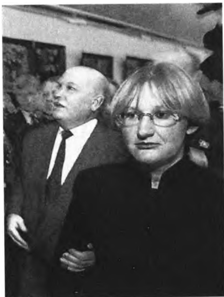
Ю. М. Лужков с супругой. Неужели мэр вос- торгается Б. Н. Ельциным? Увы, шел 1999-й год

Б. Немцов, похоже, войдет в историю в белых штанах