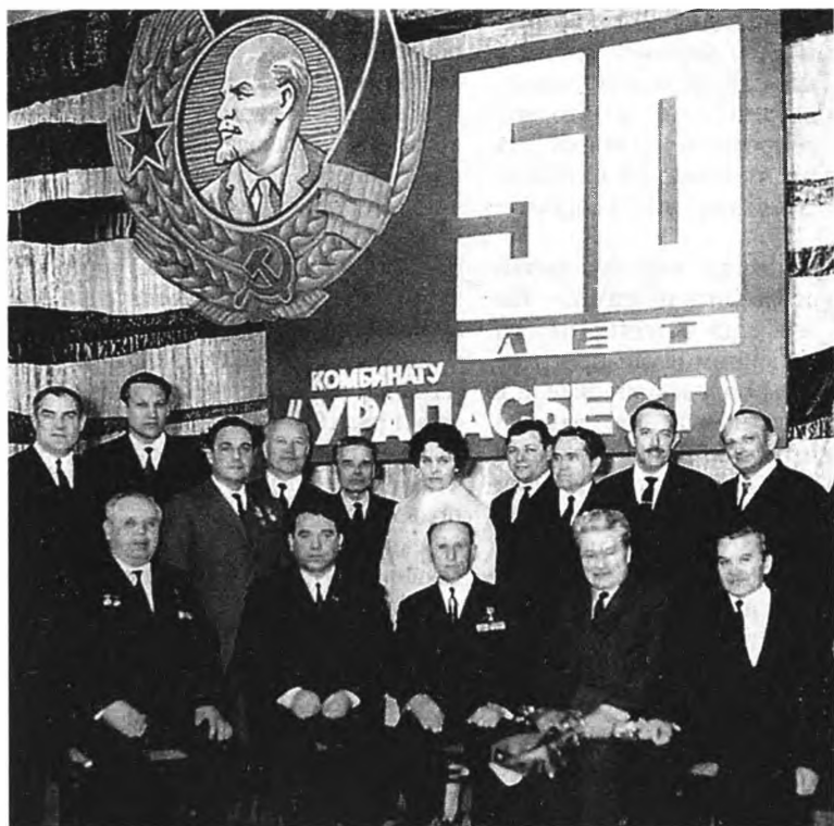
1969 год. Город Асбест Свердловской обл. Б. Н. Ельцин стоит вторым слева