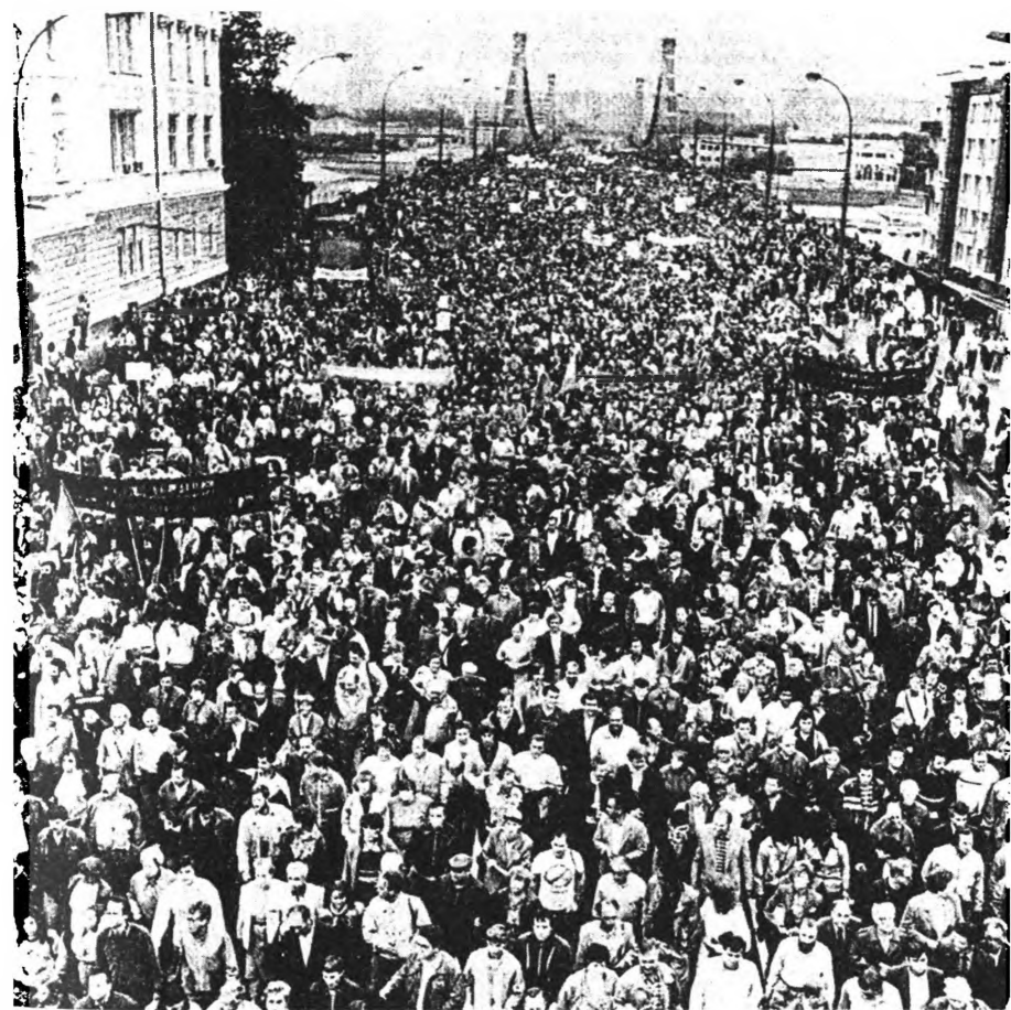
Июль 1990 года. Закончился XXVII съезд КПСС. Антисоветская манифестация, организованная блоком «Демократическая Россия», на улицах Москвы