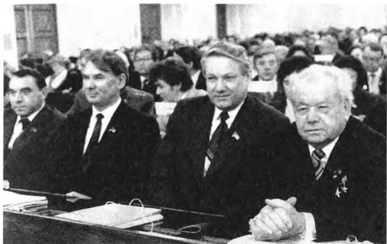
22 ноября 1982 года. Москва, Кремль. VII сессия Верховного Совета СССР. Знаменитые свердловчане: секретарь ЦК КПСС А. П. Кириленко (справа), первый секретарь Свердловского обкома КПСС Б. Н. Ельцин, первый заместитель председателя Госплана СССР Я. П. Рябов (крайний слева)

Еще в Свердловске они умели смеяться громче всех над шутками босса