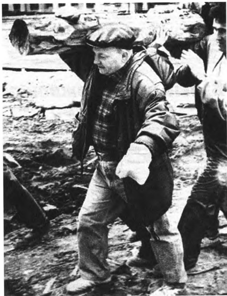
С. Кириенко утверждал, что бревно у Ю. М. Лужкова — надувное