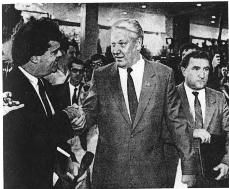
Июль 1991 года. XXVIII съезд КПСС. За несколько часов до выхода из КПСС