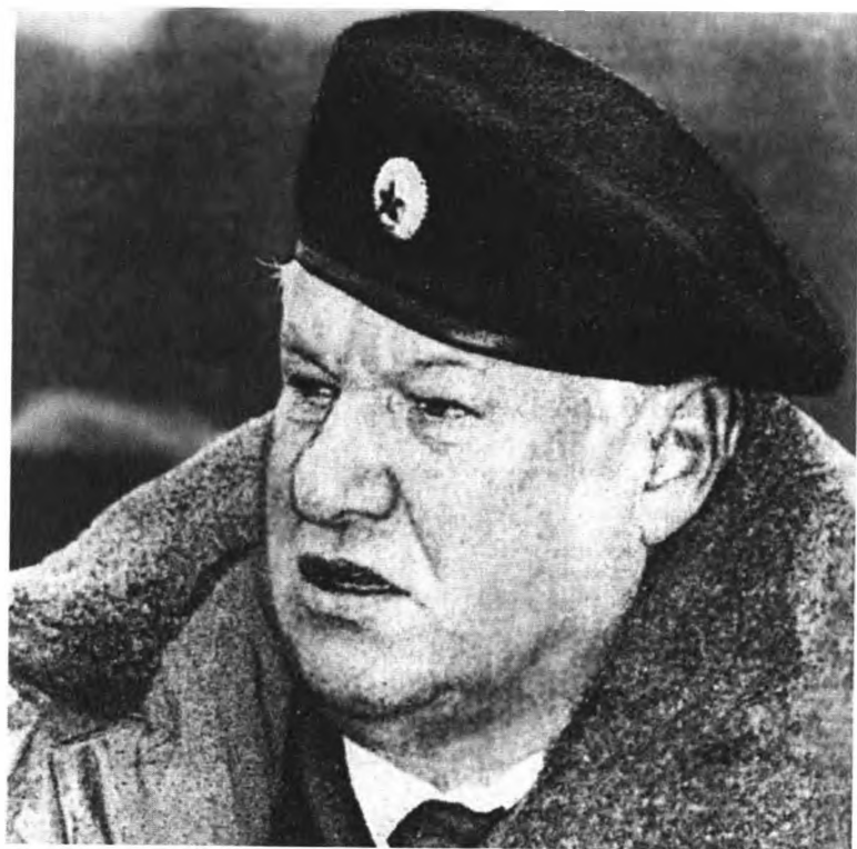
Как всякий не служивший в армии мужчина, Б. Н. Ельцин любил фотографироваться в военной форме