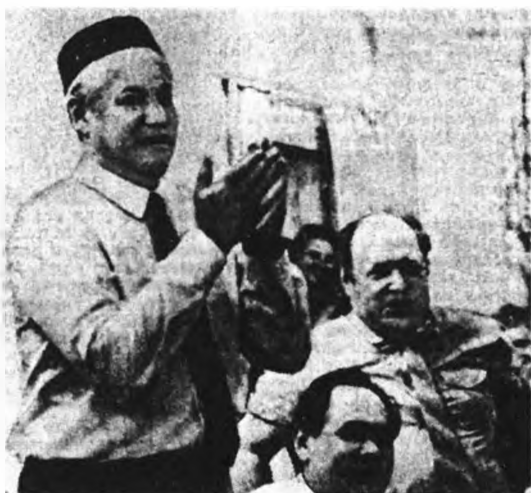
Казань, лето 1990 года. Именно там были произнесены слова: «Берите столько суверенитета, сколько проглотите...» Рядом с Б. Н. Ельциным — М. Шаймиев