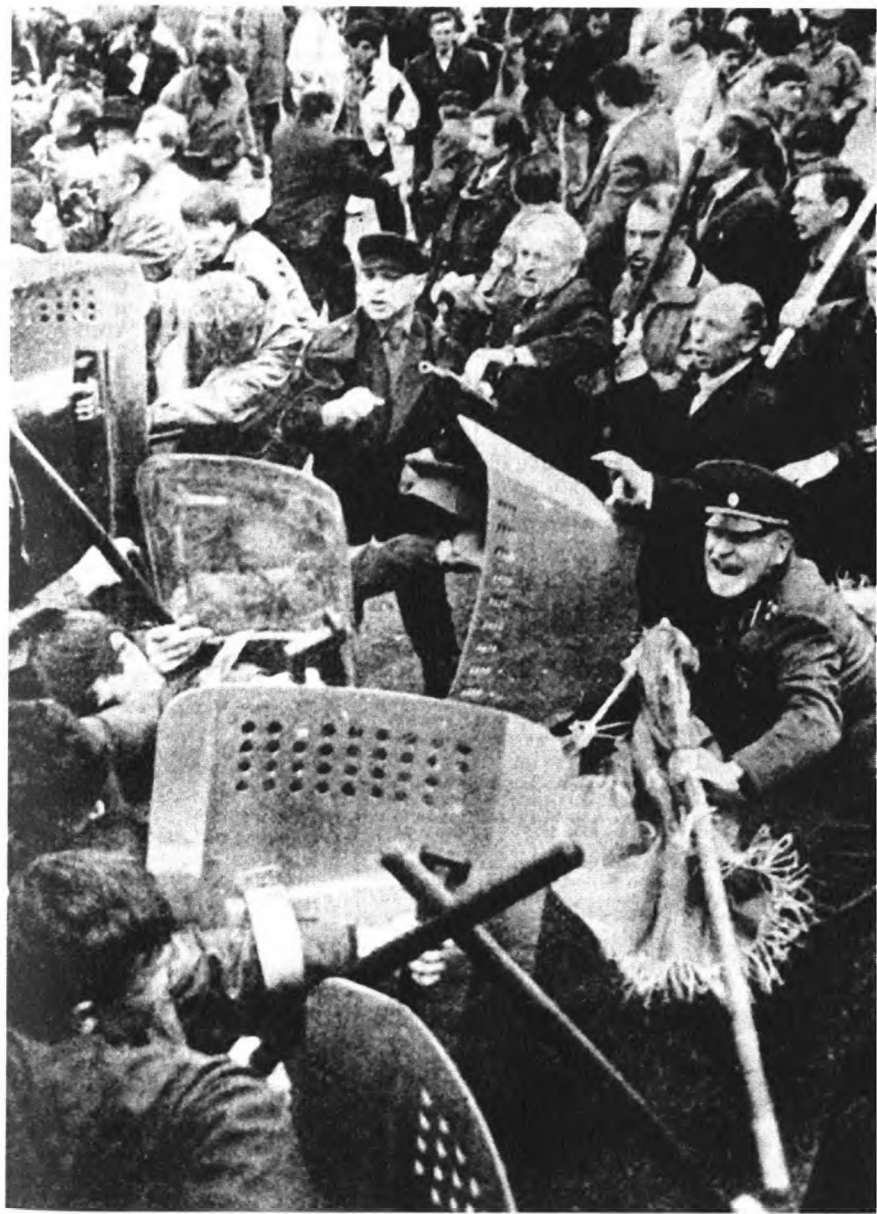
1 мая 1993 года. Москва, Ленинский проспект