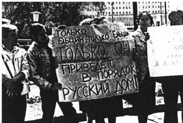
Пикет избирателей. 1990 год