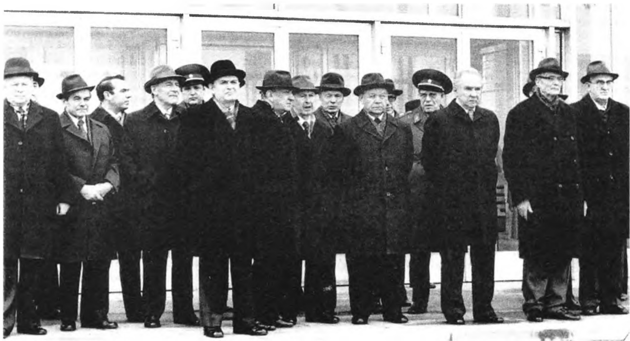
Москва, 1978 год. Аэропорт «Внуково-2». Проводы Л. И. Брежнева. Третий слева – секретарь ЦК КПСС Я. П. Рябов