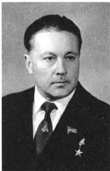
Первый секретарь Полтавского обкома партии Ф. Т. Моргун. На октябрьском (1987 г.) Пленуме ЦК КПСС назвал первого секретаря Московского горкома Б. Н. Ельцина слабаком