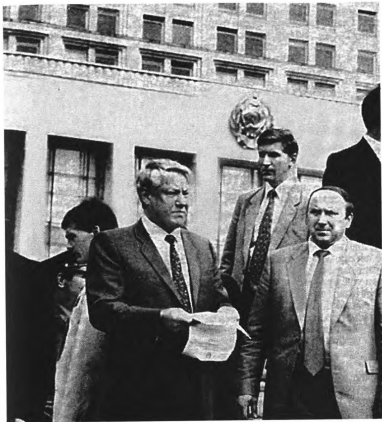
Август 1991 года. Б. Н. Ельцин читает воззвание к народу России