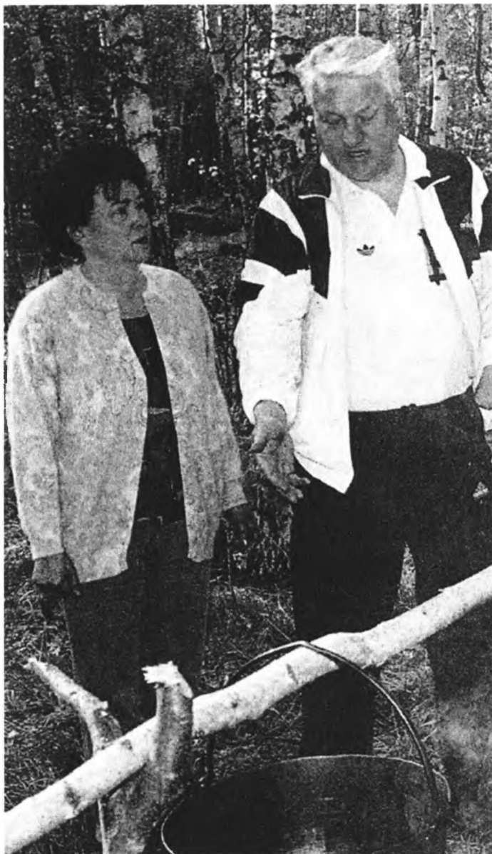
На семейном пикнике