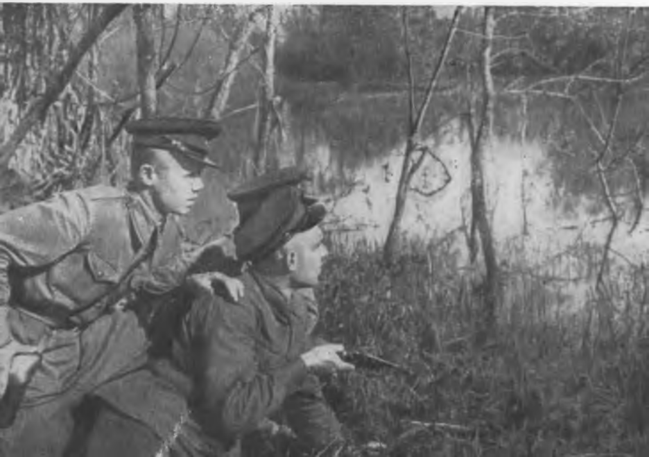
Пограничники на Западном острове крепости (1941 г.).