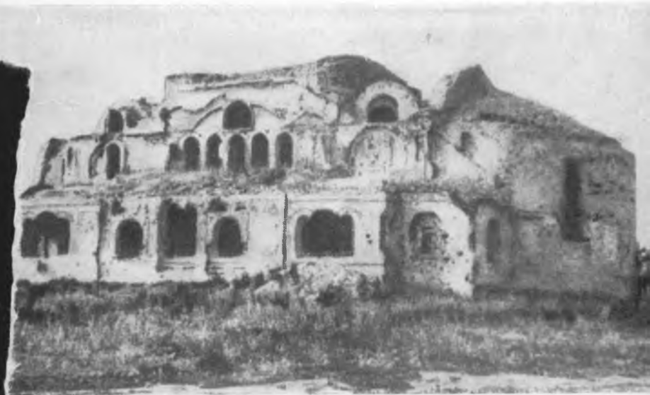
Здание гарнизонного клуба (бывшая церковь).