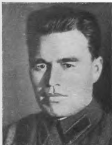
Майор П. М. Гаврилов (1941 г.).