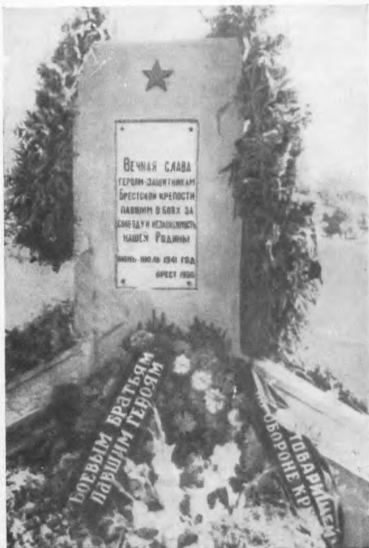
Памятник на братской могиле героям обороны в Бресте.