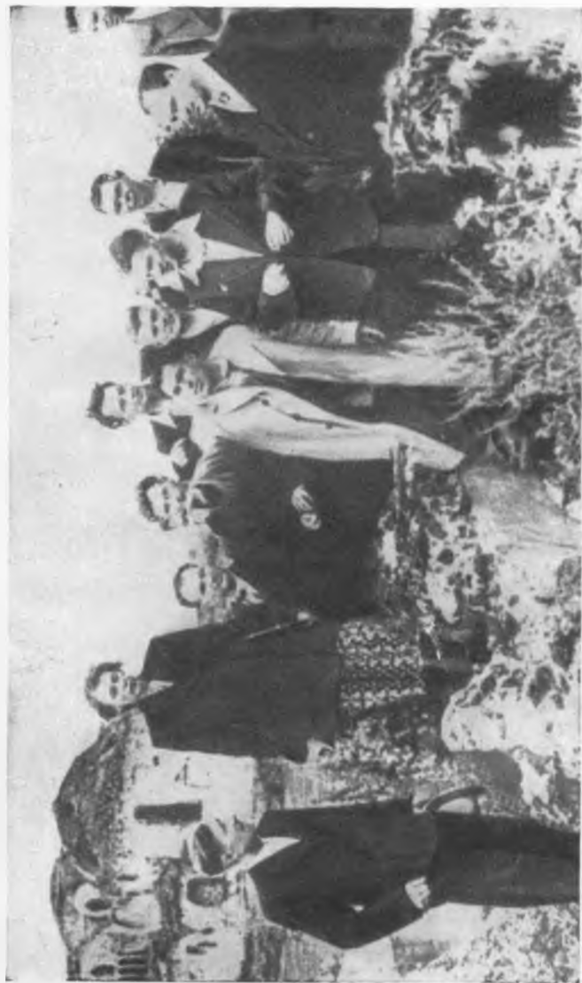
На памятных развалинах.