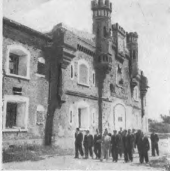
Холмские ворота цитадели.