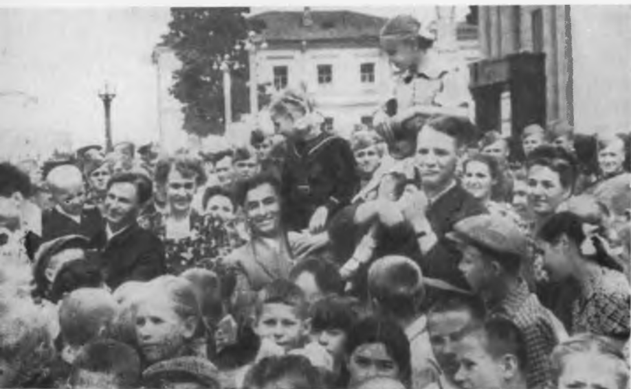
В Минске. Участники обороны Брестской крепости встретились с пионерами.