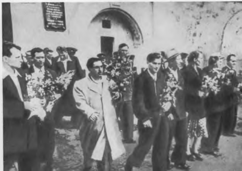
Герои обороны входят в Брестскую крепость.