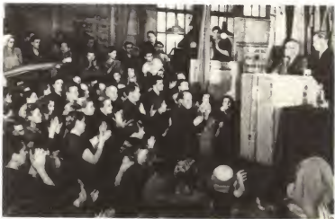
Митинг на московском заводе «Каучук», посвященный итогам работы XX съезда КПСС. На трибуне — глава делегации Компартии Великобритании на XX съезде Гарри Поллит. 1956 г.