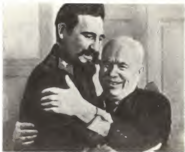
Н. С. Хрущев и премьер-министр революционного правительства Кубы Ф. Кастро.