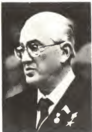
Ю. В. Андропов.