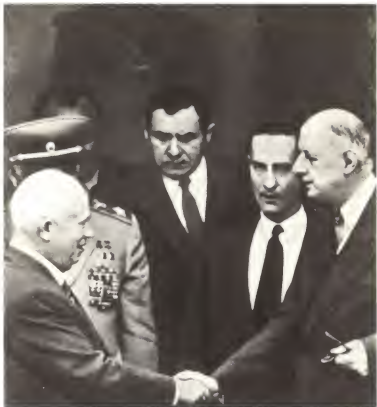
1960 г. Беседа с президентом Франции Ш. де Голлем во время встречи в верхах.