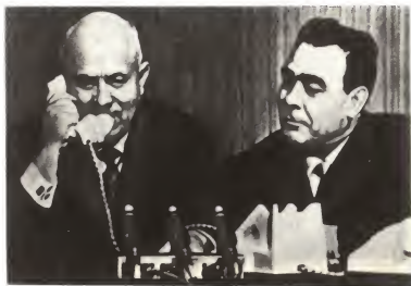
Во время разговора с космонавтом Валентиной Терешковой. Рядом сидит Л. И. Брежнев. 1963 г.