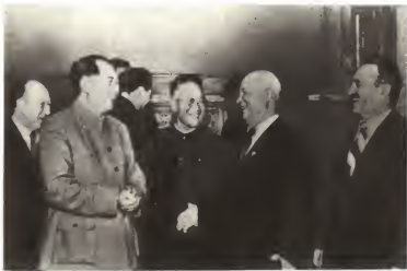
Мао Цзэдун, Н. С. Хрущев и А. И. Микоян.