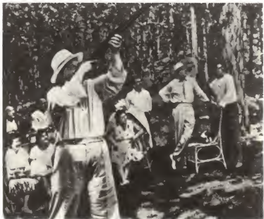
На отдыхе в Крыму. 1961 г. Слева — В. Ульбрихт и В. Гомулка, справа — М. А. Суслов и Л. И. Брежнев.