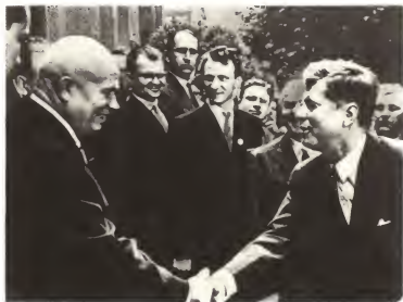
Н. С. Хрущев и Д. Кеннеди.