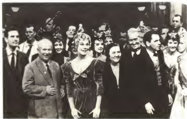
Н. С. и Н. П. Хрущевы на киностудии кинокомпании «Твентис Сенчури Фокс» в Голливуде.