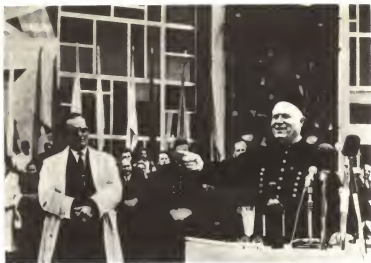
Югославия. 1963 г. Н. С. Хрущев в форме почетного шахтера. Слева — И. Б. Тито.