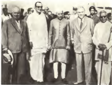
Н. С. Хрущев и Н. А. Булганин в Индии с Д. Неру и другими индийскими лидерами. 1955 г.