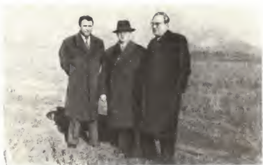
Члены советской делегации в Албании Ю. В. Андропов и П. Н. Поспелов. Слева — Ф. М. Бурлацкий. 1961 г.