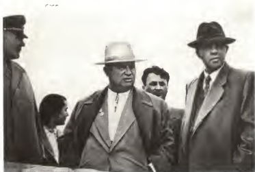
Н. С. Хрущев в Албании. 1959 г. Справа — Э. Ходжа.