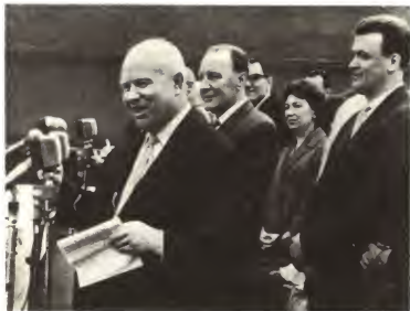
Советская делегация в Будапеште.

Митинг на электроламповом заводе. Рядом с Н. С. Хрущевым Я. Кадар. 1964 г.