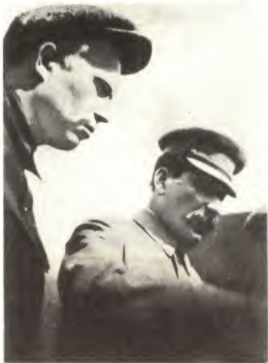
И. В. Сталин и Н. С. Хрущев. 1 мая 1932 г.