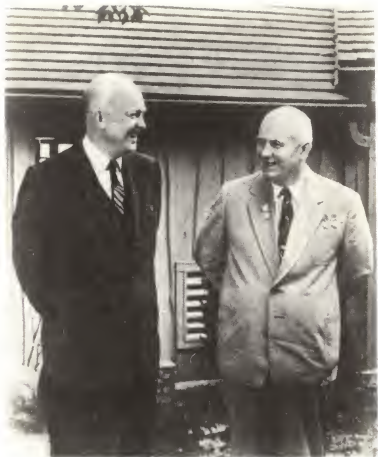
Президент США Д. Эйзенхауэр и Н. С. Хрущев перед совещанием в одном из домиков Кэмп-Дэвида. 1959 г.