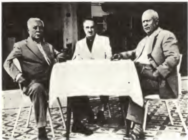
Н. С. Хрущев, А. И. Микоян, К. Е. Ворошилов на отдыхе.