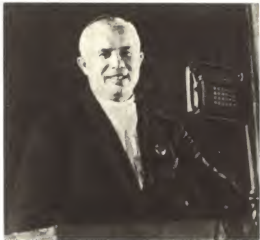
Н. С. Хрущев — первый секретарь МК и МГК ВКП(б). 1935 г.