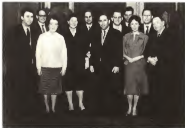
Л. Н. Толкунов (в центре) и Ф. М. Бурлацкий (слева) в Будапеште.

Митинг на электроламповом заводе. Рядом с Н. С. Хрущевым Я. Кадар. 1964 г.