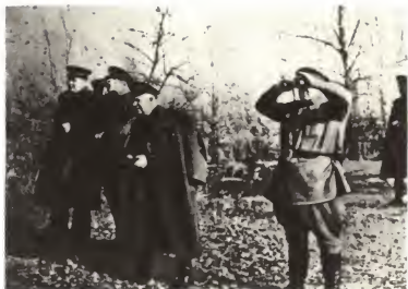
Сталинградский фронт. Октябрь 1942 г. Н. С. Хрущев с генералом А. И. Еременко и офицерами штаба.