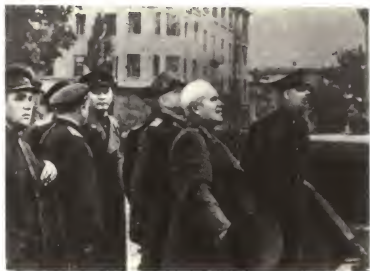
В освобожденном Кракове. Январь 1945 г.