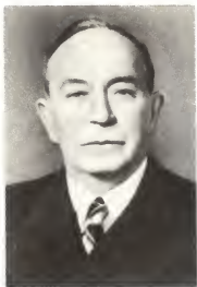
О. В. Куусинен.