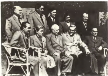
Во время первого визита в Пекин в 1954 г. Сидят (слева направо): А. И. Микоян, Е. А. Фурцева, Н. С. Хрущев, Н. А. Булганин, В. М. Молотов. Среди стоящих сзади — Я. С. Насриддинова.