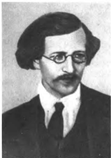
Владимир Антонов-Овсенко 25 октября 1917 года взял Зимний дворец