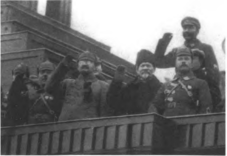
Последний раз вместе: Ворошилов, Троцкий, Калинин, Буденный и Фрунзе на трибуне