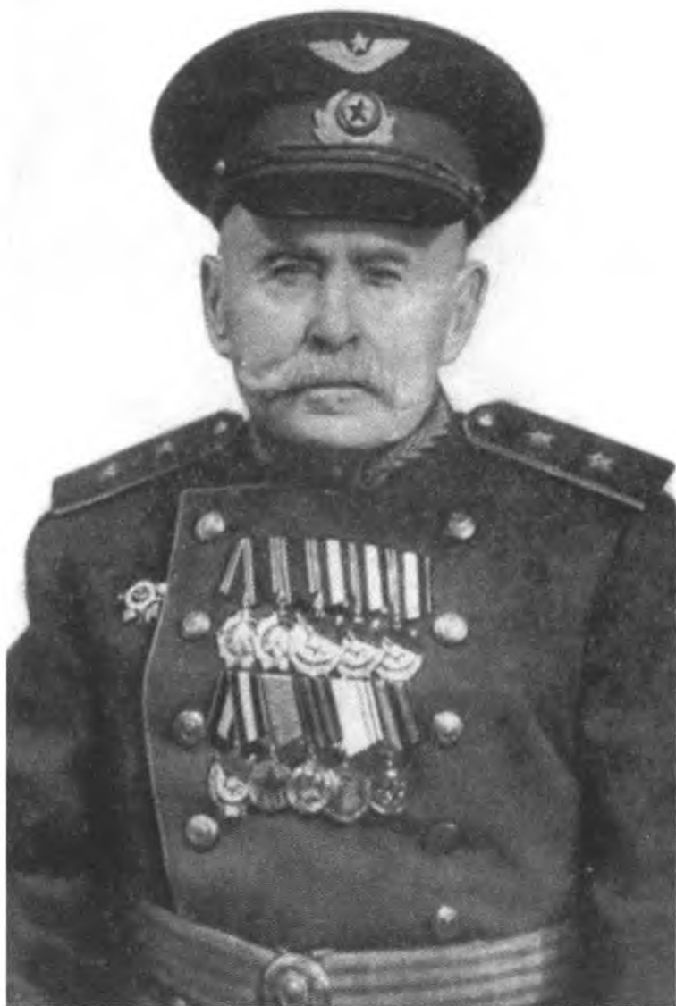
Троцкий любил охоту и уважал генерал-лейтенанта царской армии Александра Самойло, которого сделал председателем Центральной комиссии охоты и рыболовства при Штабе Красной армии