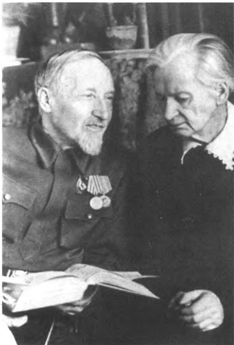
Николай Подвойский и его жена на склоне жизни: им удалось выжить