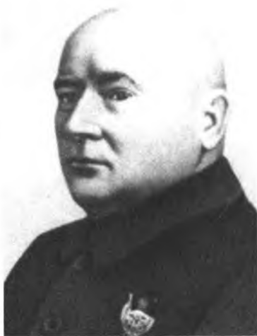
Иоаким Вацетис, главнокомандующий вооруженными силами Советской республики, стал жертвой чекистов