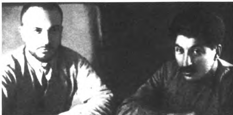
Командующий Южным фронтом Александр Егоров и член Реввоенсовета Сталин