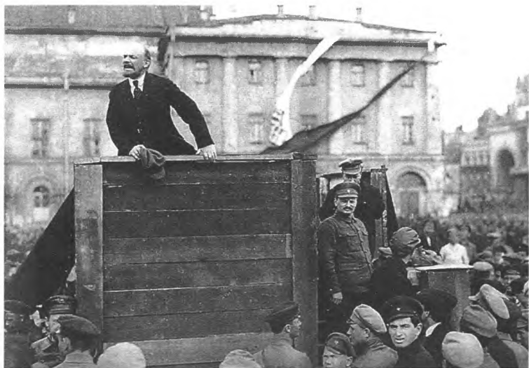
Ленин выступает в Москве 5 мая 1920 года. Троцкий на ступеньках трибуны ждет своей очереди