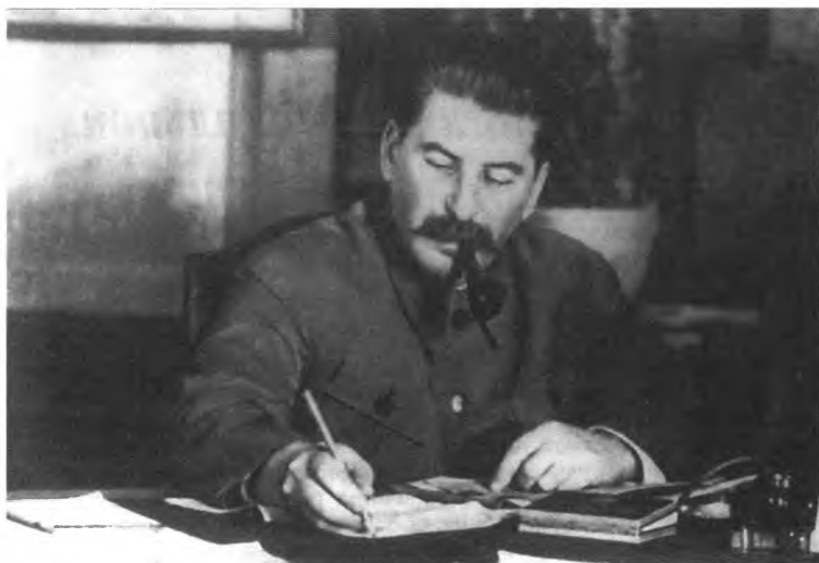
Сталин в своем рабочем кабинете в Кремле