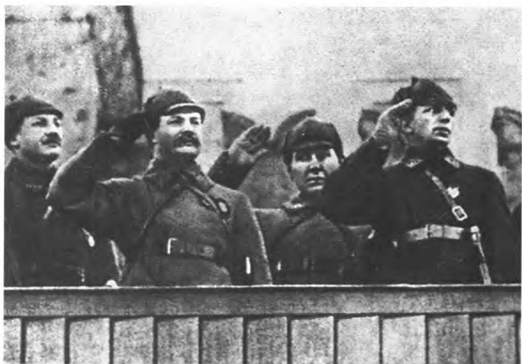
Новые руководители Красной армии Фрунзе и Бубнов на параде в Москве