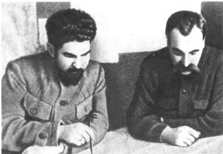
Начальник Штаба Красной армии Павел Лебедев (слева) и главком Сергей Каменев