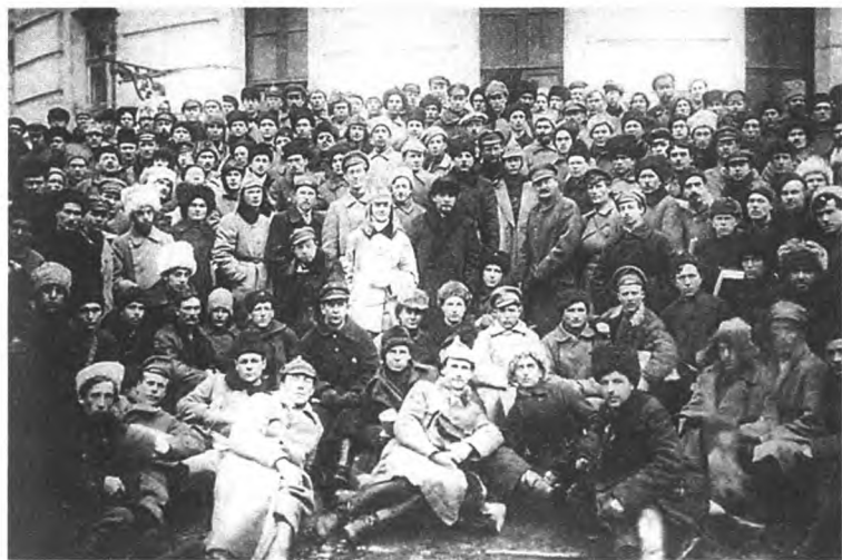
Ленин и Троцкий среди делегатов X съезда партии, подавивших восстание в Кронштадте