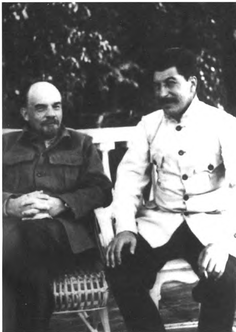
Ленин и Сталин. Даже проницательный Владимир Ильич не понимал, кого он сделал генеральным секретарем