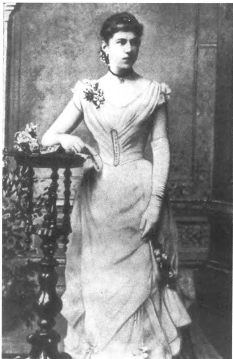
Александра Коллонтай, женщина, из-за которой стрелялись, заняла в первом советском правительстве пост наркома государственного призрения