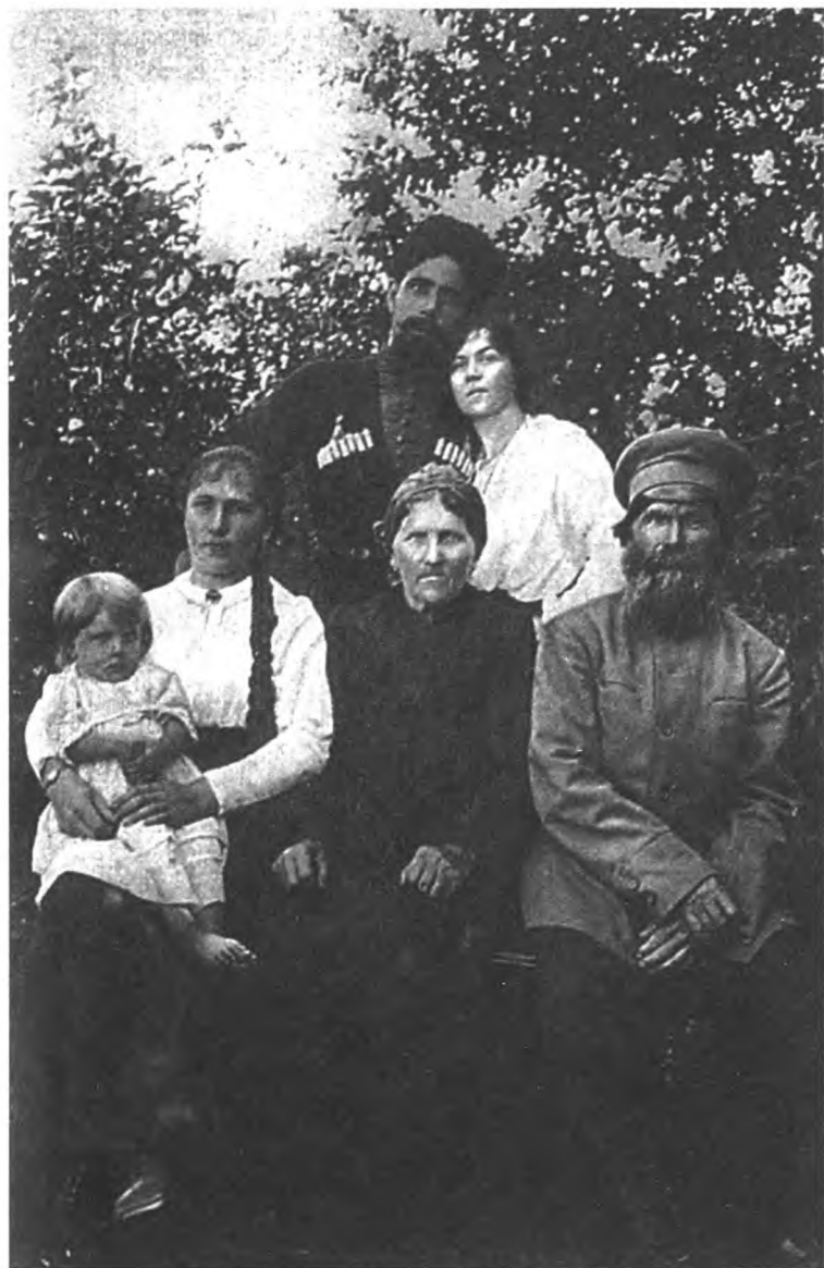
Павел Дыбенко и Александра Коллонтай в гостях у семейства Дыбенко