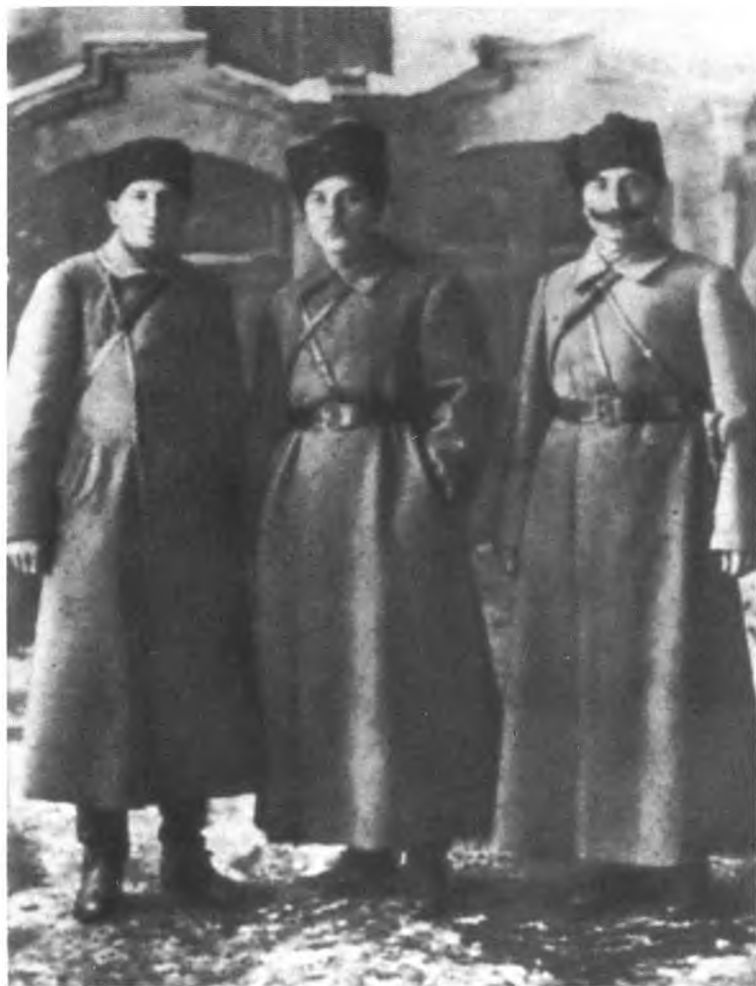
Член Реввоенсовета Украинского фронта Андрей Бубнов и руководители Первой конной армии Климент Ворошилов и Семен Буденный в 1919 году