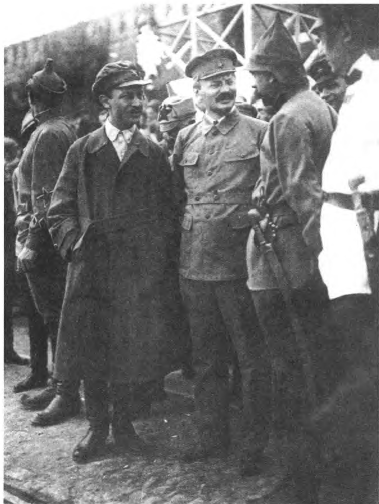
Заместитель председателя Реввоенсовета Республики Эфраим Склянский, Лев Троцкий и главком Сергей Каменев