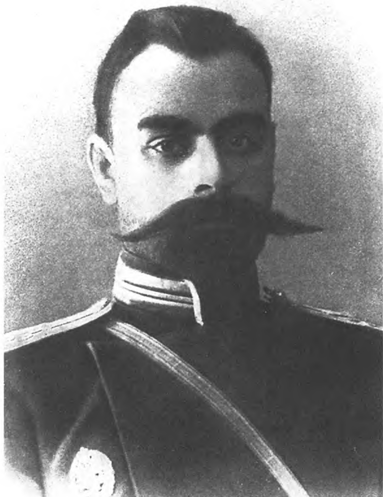
Сергей Каменев, слушатель Академии генерального штаба царской армии и будущий главком