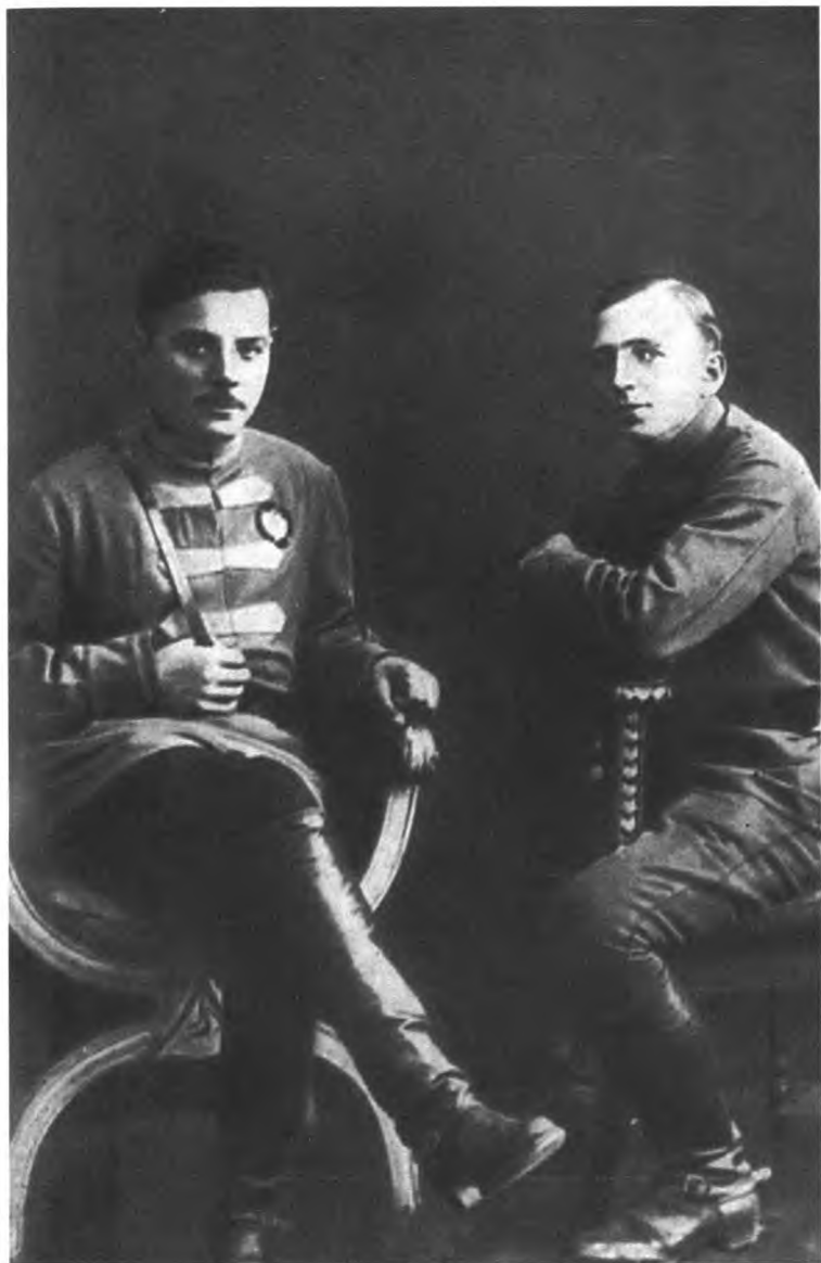
Командующий Северо-Кавказским военным округом Ворошилов и член РВС округа Бубнов в 1921 году