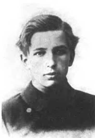
Андрей Бубнов, член Военно-революционного комитета в Петрограде, в 1917 году