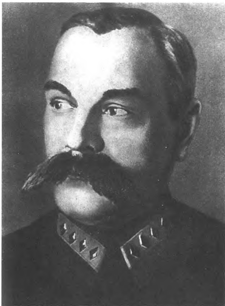
Сергей Каменев благополучно дожил до старости и был объявлен «врагом народа» после смерти