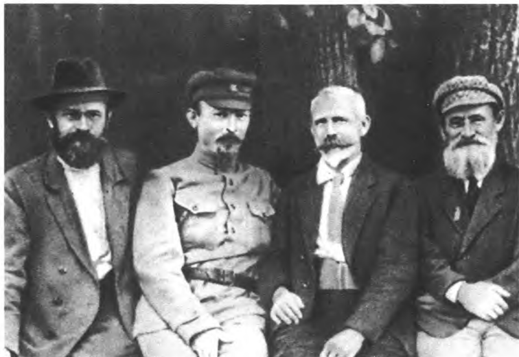
Феликс Дзержинский, Юлиан Мархлевский и Феликс Кон должны были возглавить правительство народной Польши в 1920 году, но Красная армия потерпела поражение под Варшавой