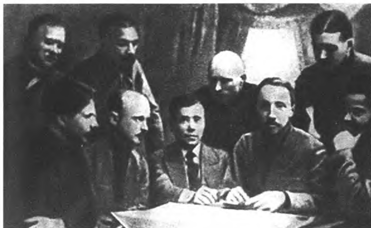
Военно-революционный комитет при Петроградском Совете рабочих и солдатских депутатов в 1917 году. В центре: Николай Подвойский и будущие члены Реввоенсовета Республики Владимир Невский и Константин Мехоношин. Стоит второй слева — Михаил Кедров, один из первых руководителей особого отдела ВЧК