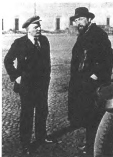
Владимир Бонч-Бруевич был первым управляющим делами Совнаркома и близким к Ленину человеком...