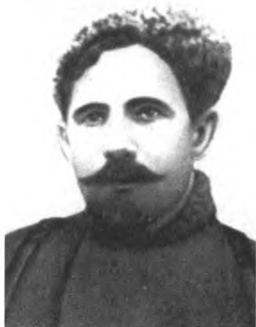
Павел Дыбенко, военно-морской министр большевиков