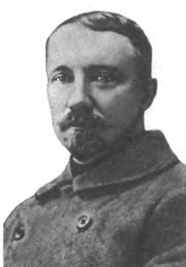
Николай Подвойский, первый советский руководитель военного ведомства