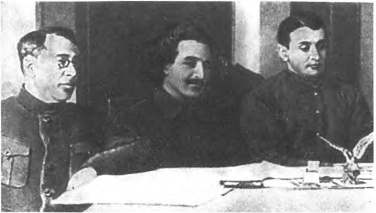
Начальник Политического управления Реввоенсовета Республики Сергей Гусев вместе с Серго Орджоникидзе и Михаилом Тухачевским, чья военная звезда вошла очень рано