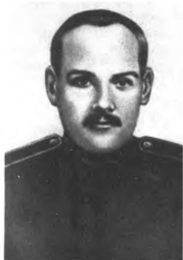
Николай Крыленко, первый советский главком