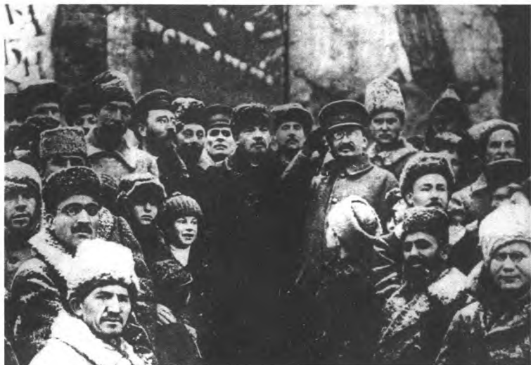
Ленин и Троцкий на Красной площади 7 ноября 1919 года