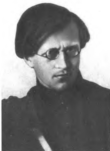
Антонов-Овсенко, командующий войсками на Украине, в 1919 году