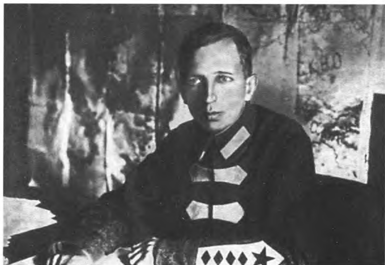
Андрей Бубнов, начальник Политического управления Красной армии, в своем кабинете