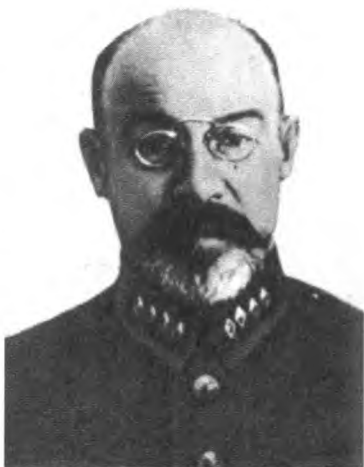
...а его брат генерал Михаил Бонч-Бруевич в 1918-м возглавил Высший военный совет