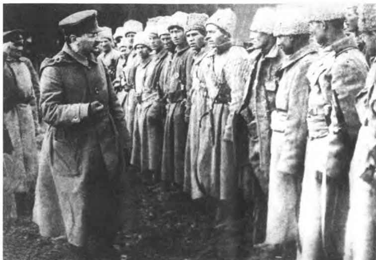
Председатель Реввоенсовета Республики Троцкий с бойцами Красной армии