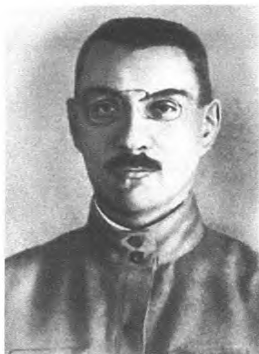
Генерал-лейтенант царской армии Николай Потапов возглавил генеральный штаб после Октябрьской революции