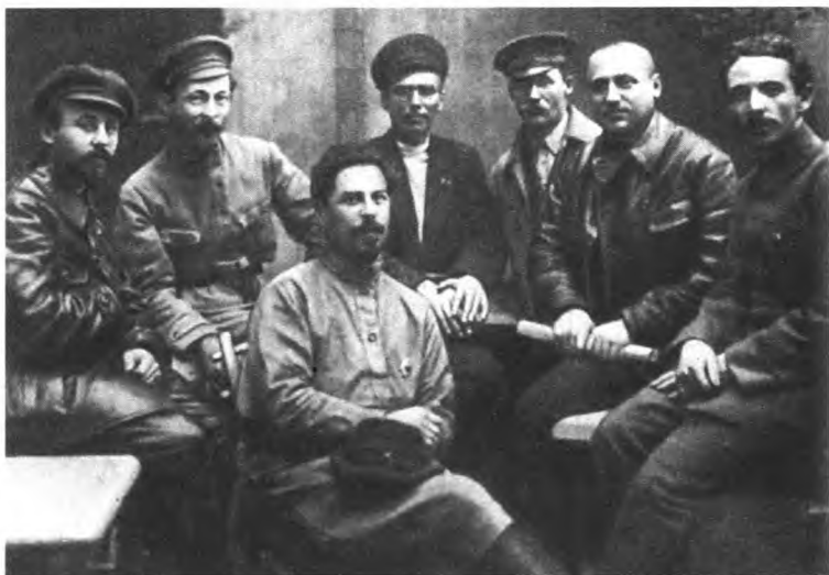
Феликс Дзержинский с товарищами по ВЧК, которая обеспечила жесткий контроль над армией