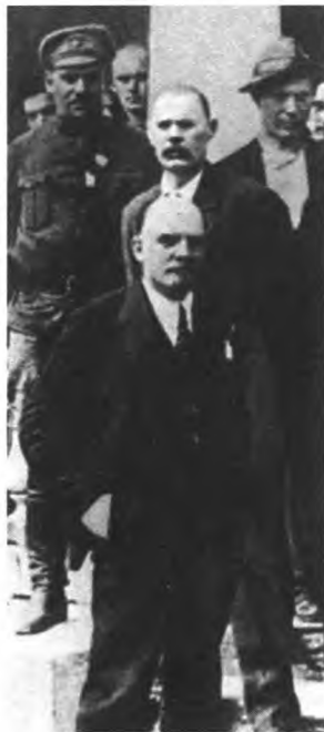
Михаил Лашевич (слева, в военной форме), будущий заместитель председателя Реввоенсовета Республики и оппозиционер, рядом с Лениным