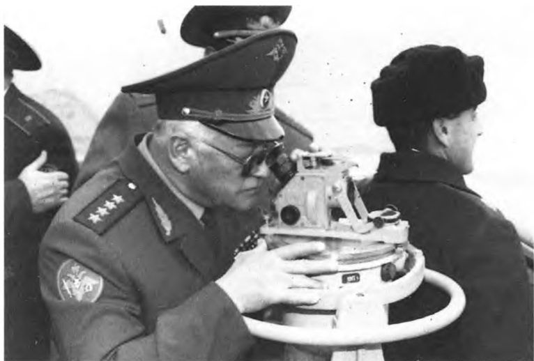
Министр обороны И. Сергеев стал первым маршалом Российской Федерации