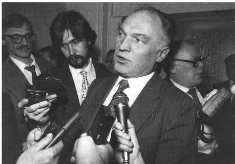
Вице-премьер правительства России В. Булгак