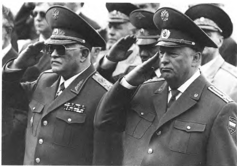
Полковник В. Жириновский рядом с маршалом И. Сергеевым

В. Жириновский — непревзойденный мастер эпатажа