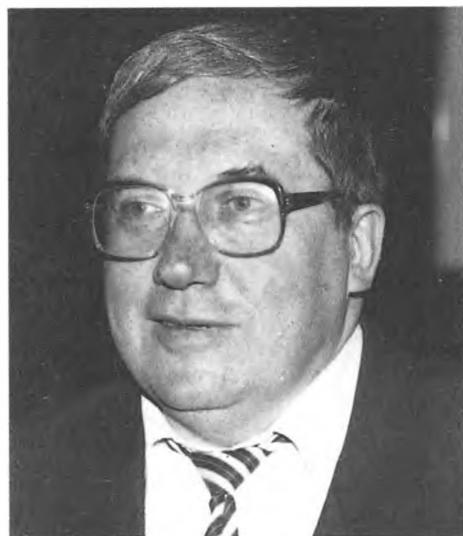
Секретарь Совета безопасности РФ А. Кокошин