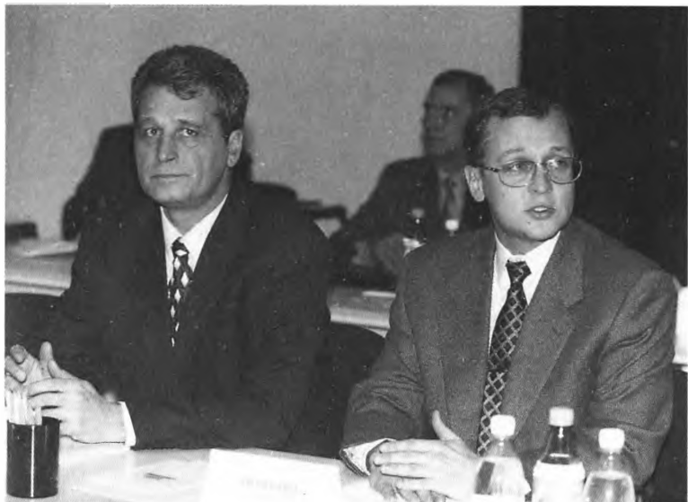
«Весенне-летний» (1998 г.) премьер-министр РФ С. Кириенко и первый заместитель главы администрации президента О. Сысуюев