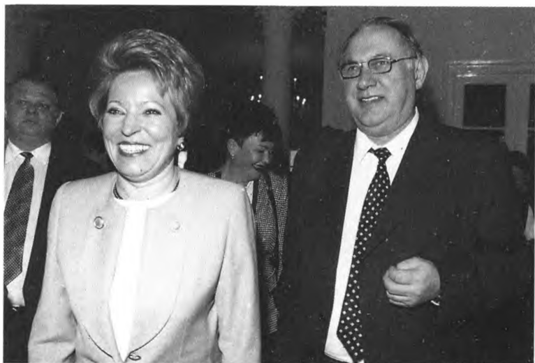
Вице-премьер В. Матвиенко и первый вице-премьер Ю. Маслюков