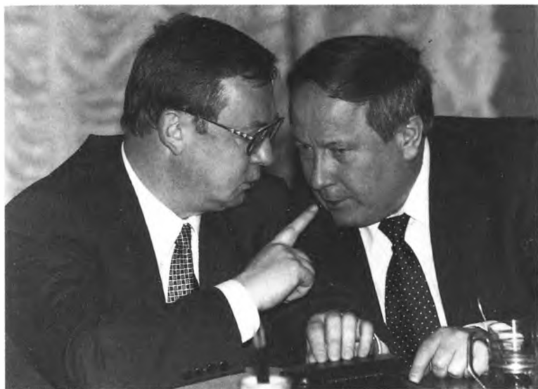
С. Степашин еще министр, да и Ю. Скуратов — Генеральный прокурор