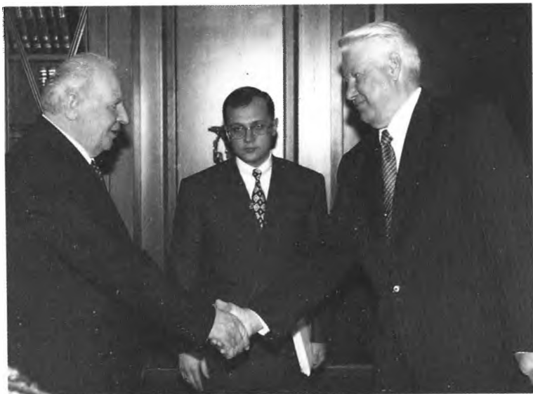
Б. Ельцин, Е. Строев и С. Кириенко