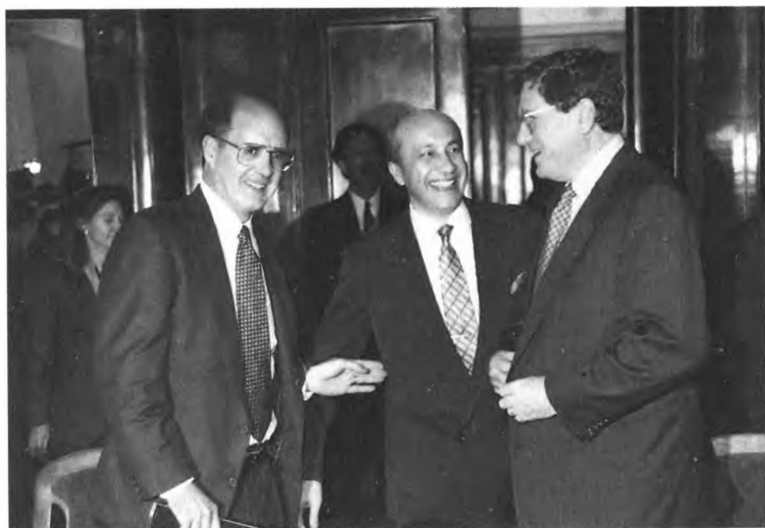
Первый заместитель госсекретаря США С. Тэлботт, министр иностранных дел России И. Иванов (в центре) и помощник госсекретаря США Р. Холбрук в Москве