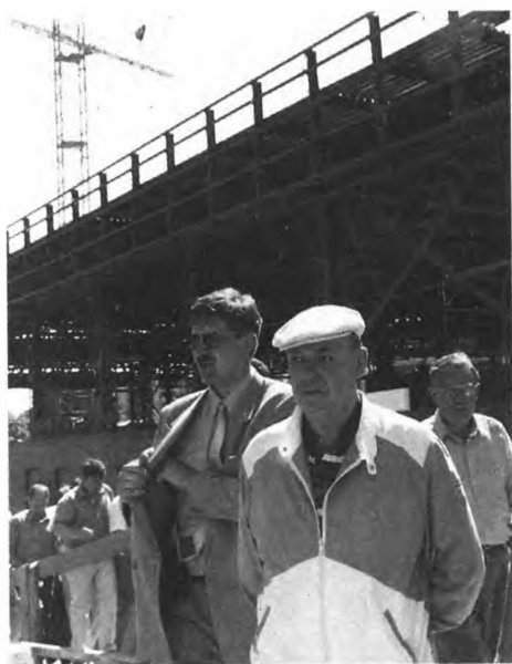
Первый заместитель премьера правительства Москвы В. Ресин (в центре) курирует столичный строительный комплекс