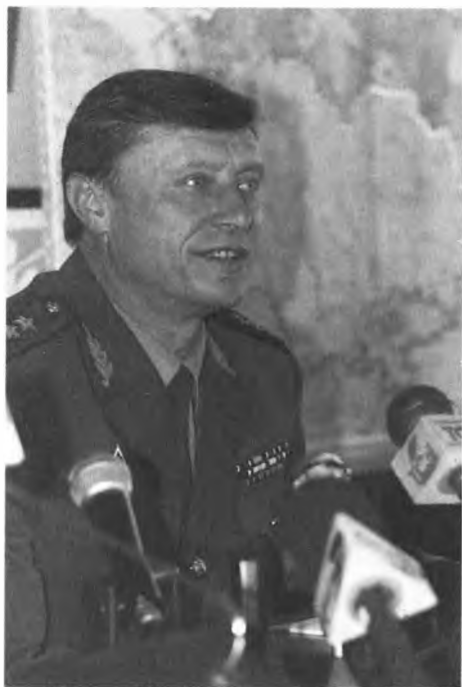
Директор Федеральной пограничной службы России генерал-полковник Н. Бордюжа. Вскоре он станет секретарем Совета безопасности РФ и одновременно руководителем президентской администрации. Правда, не надолго, как и все кремлевские чиновники