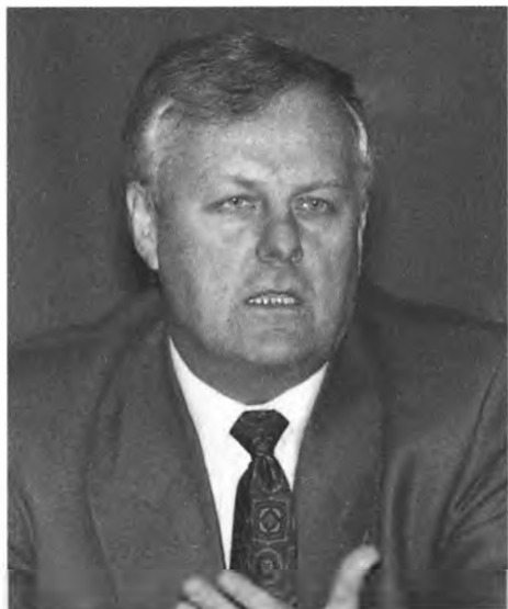
Экс-мэр Петербурга А. Собчак