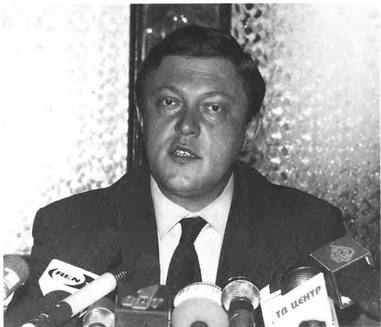
Лидер «Яблока» Г. Явлинский