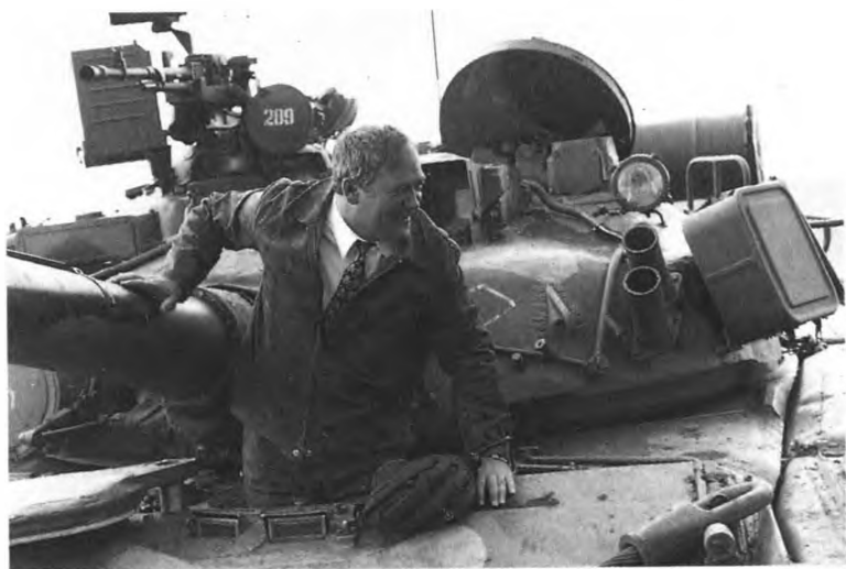
Губернатор Приморского края Е. Наздратенко умеет управлять даже современным танком Т-80