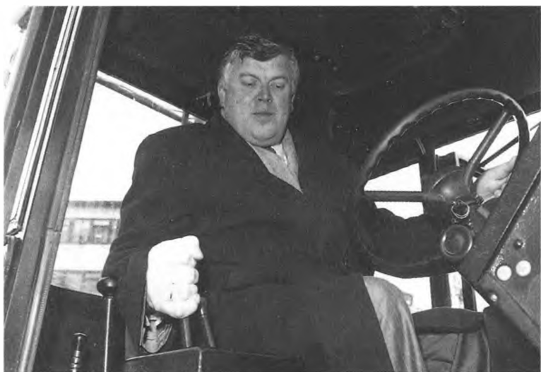
В. Густов — первый вице-премьер правительства Е. Примакова, умеет управлять и трактором