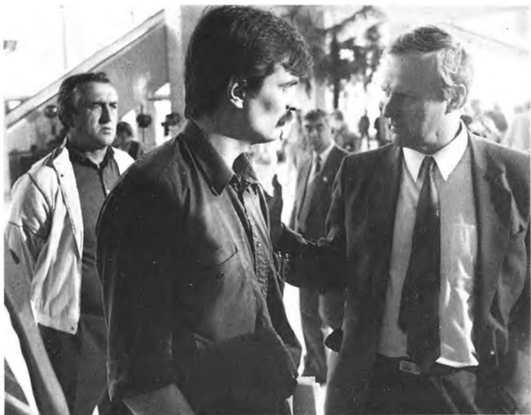
А. Собчак и Ю. Болдырев — делегаты XXVIII съезда КПСС. 1990 г