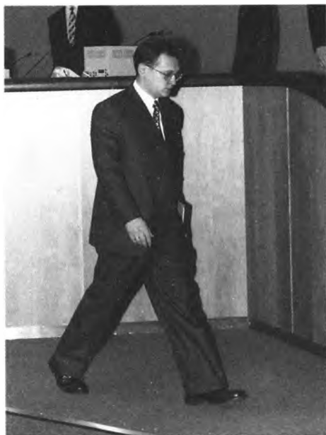
Опять не утвердили... Кандидат на пост пре- мьер-министра С. Кириен- ко покидает думскую трибуну