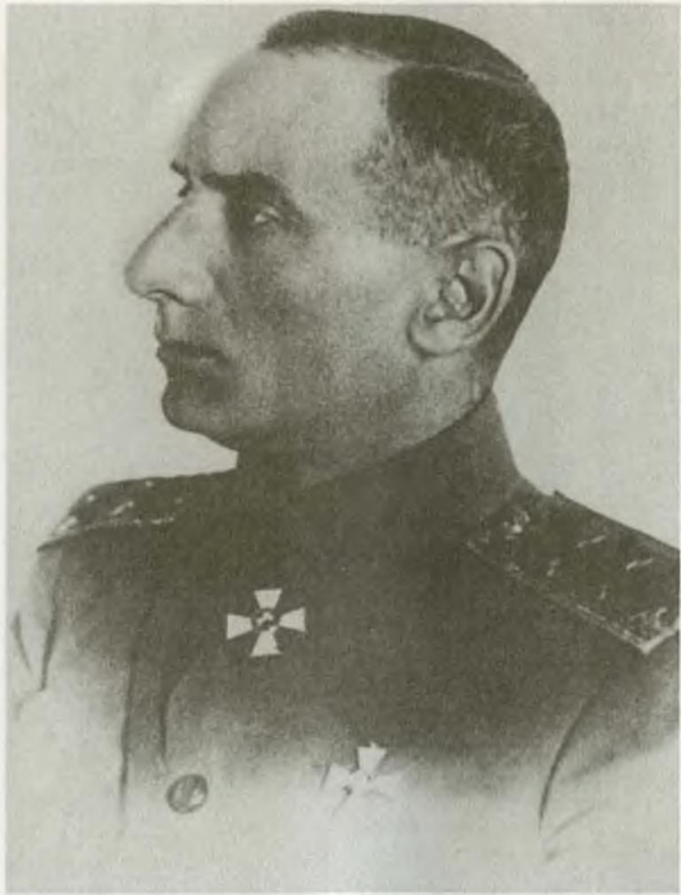
Адмирал А.В. Колчак