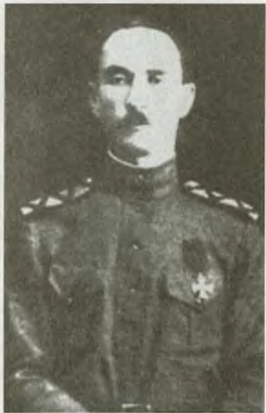
Генерал-лейтенант И.С. Смолин