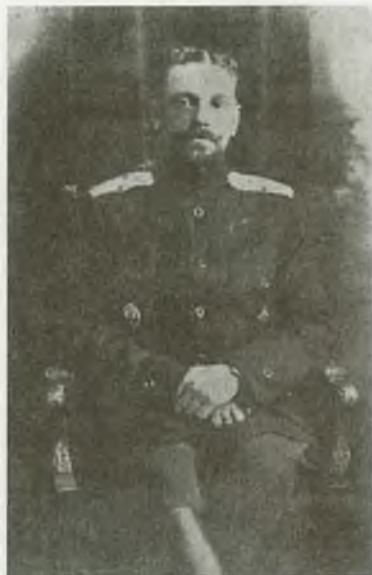
Генерал-лейтенант В.О. Каппель