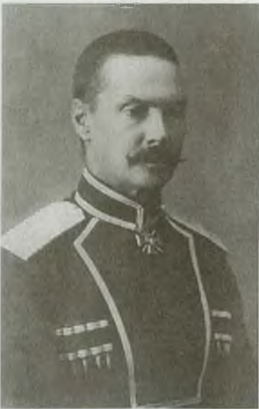
Генерал-лейтенант П.И. Иванов-Ринов