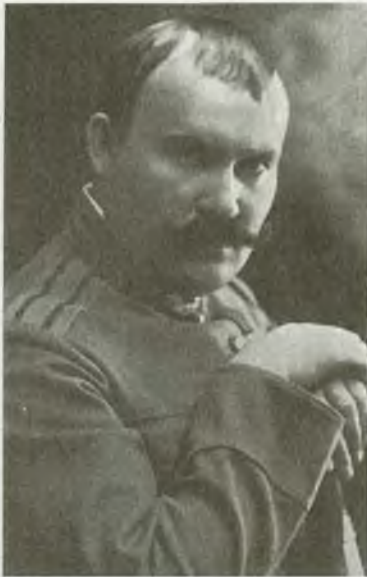
Генерал-лейтенант Г.М. Семенов