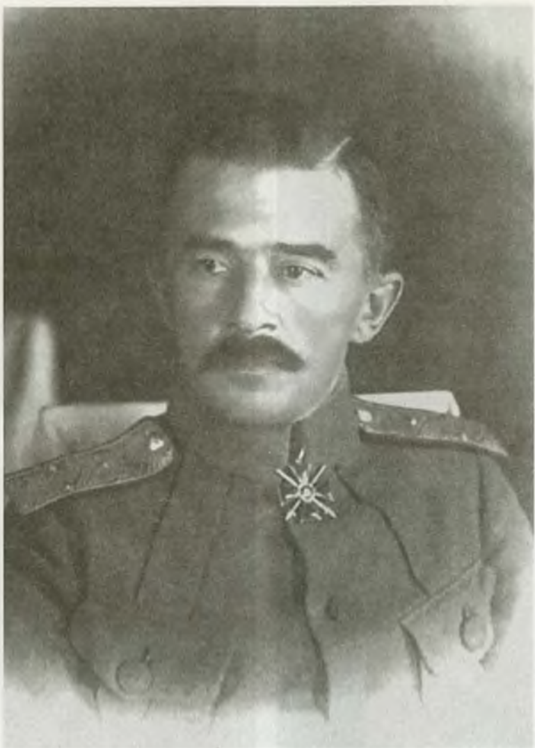
Генерал-лейтенант М.К. Дитерихс