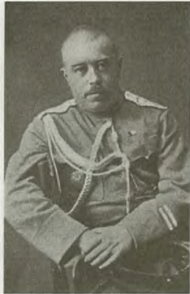
Генерал-лейтенант А.И. Дутов