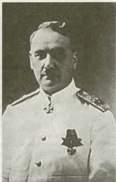
Контр-адмирал Г.К. Старк