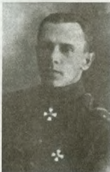
Генерал-майор С.Н. Войцеховский