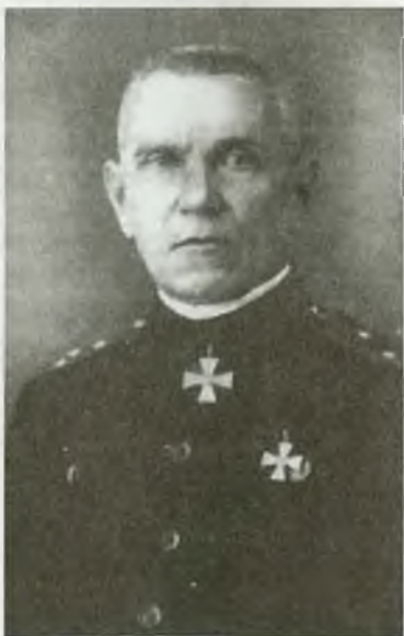
Генерал-лейтенант Г.А. Вержбицкий