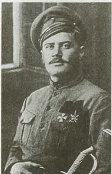
Генерал-лейтенант А.Н. Пепеляев