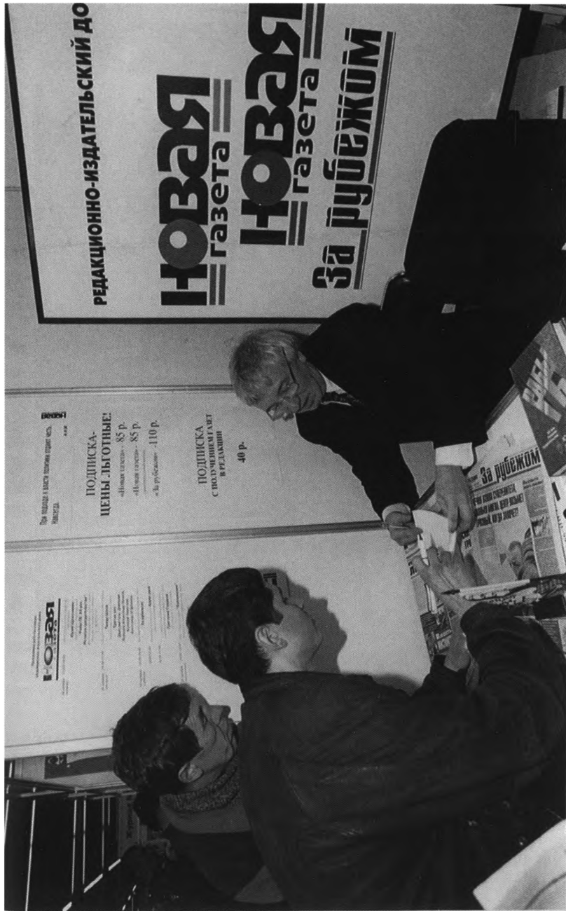
На презентации книги «Рабы ГБ»