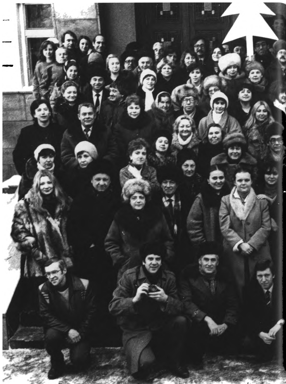
Конец 1980-х годов. Легендарный коллектив