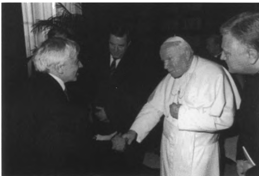
С Папой Римским Иоанном Павлом II