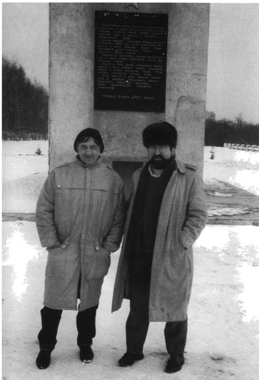
С шефом московского бюро журнала «Time» Джоном Коханом