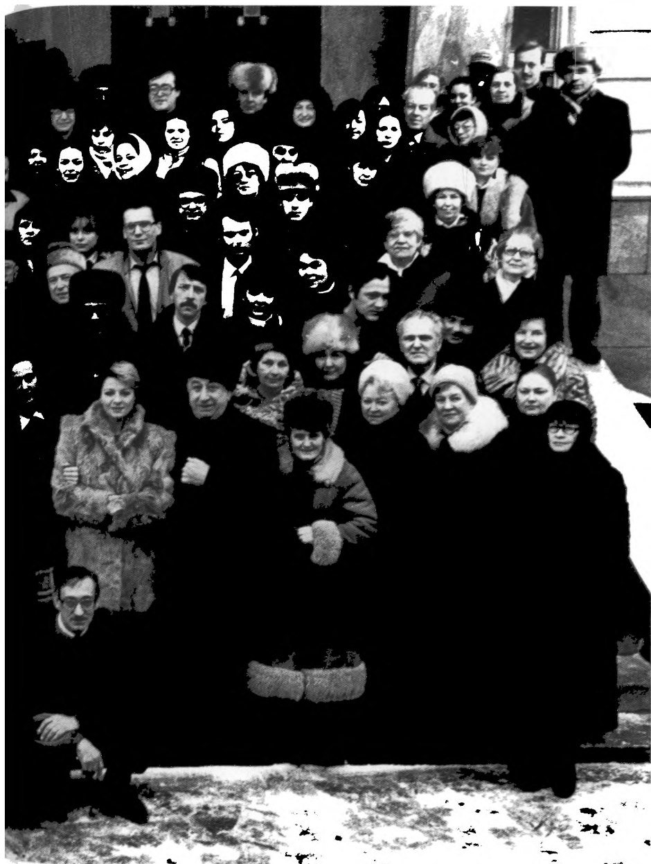
легендарной «Литературной газетъ»