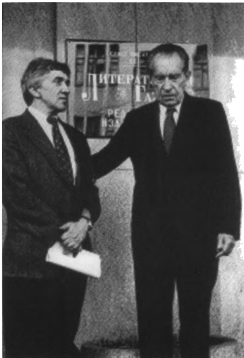
С Ричардом Никсоном