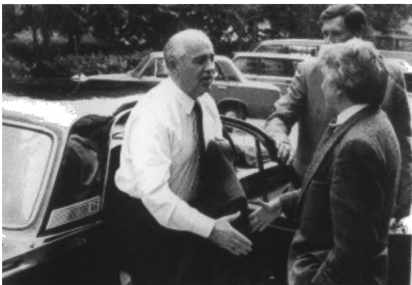
С Михаилом Горбачевым