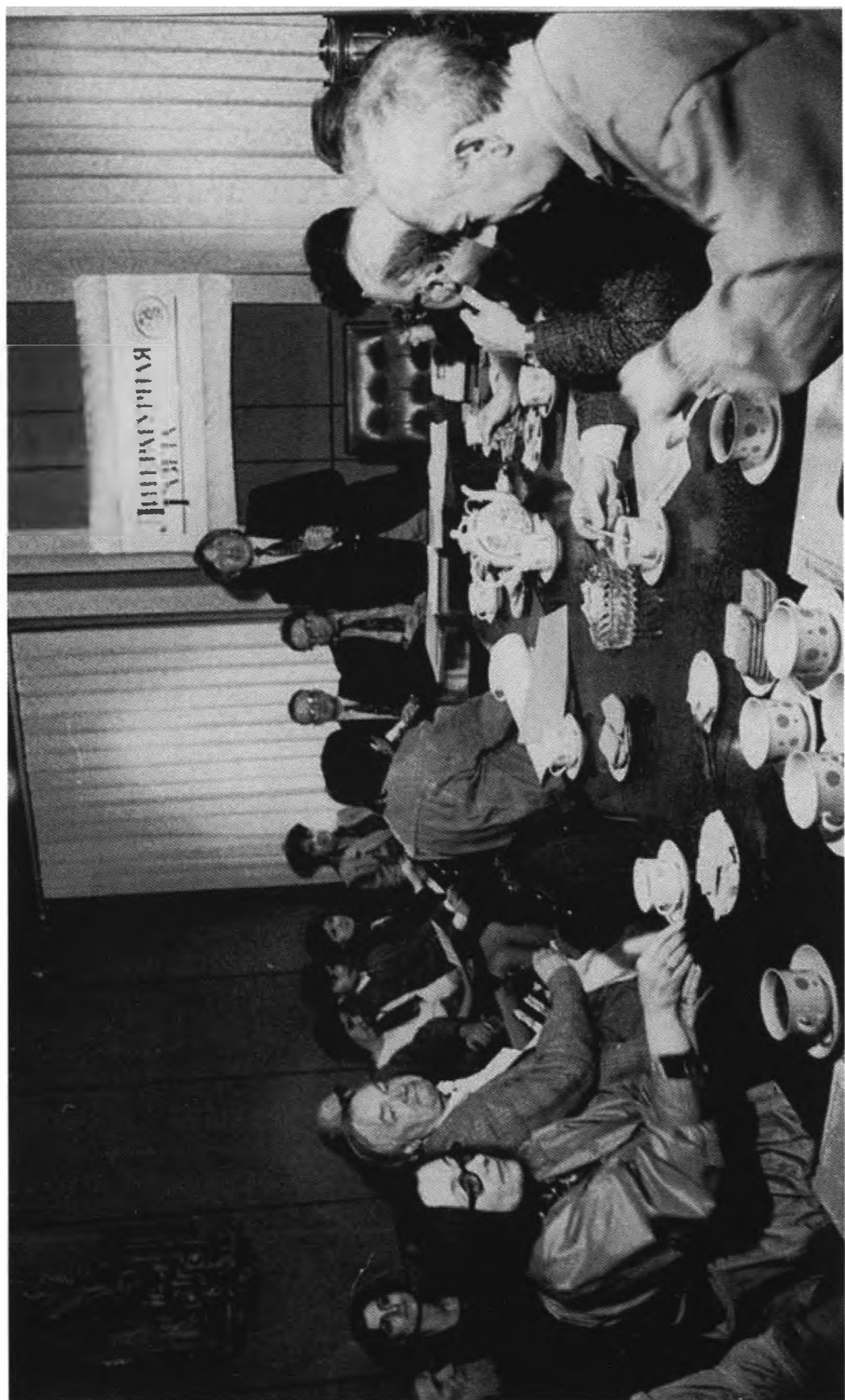
Заседание редколлегии «ЛГ». 1986 год