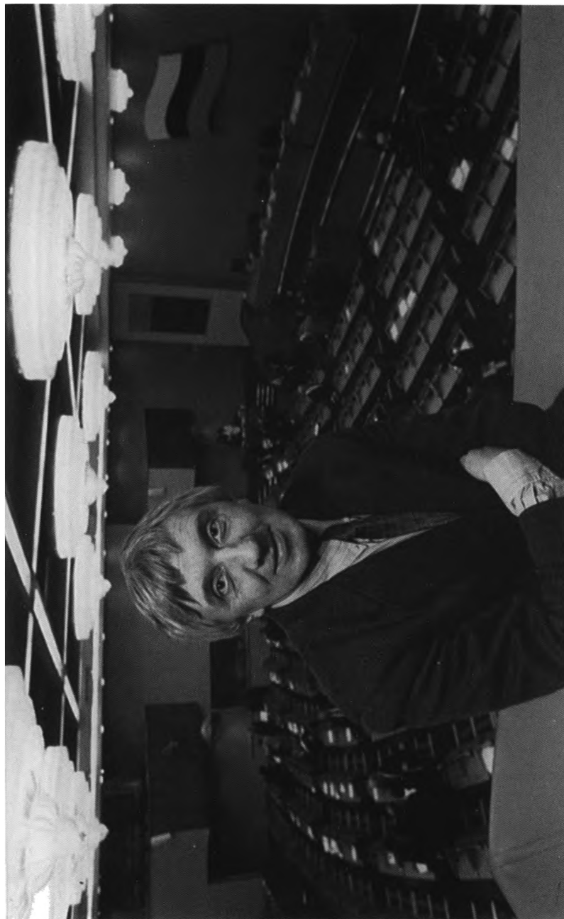
В Государственной Думе