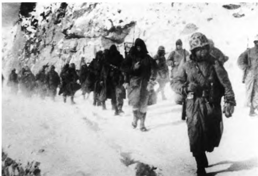
Южнокорейские солдаты ... на марше