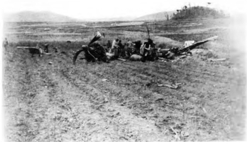
Сбитый американский самолет