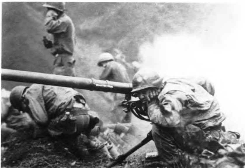
... на передовой