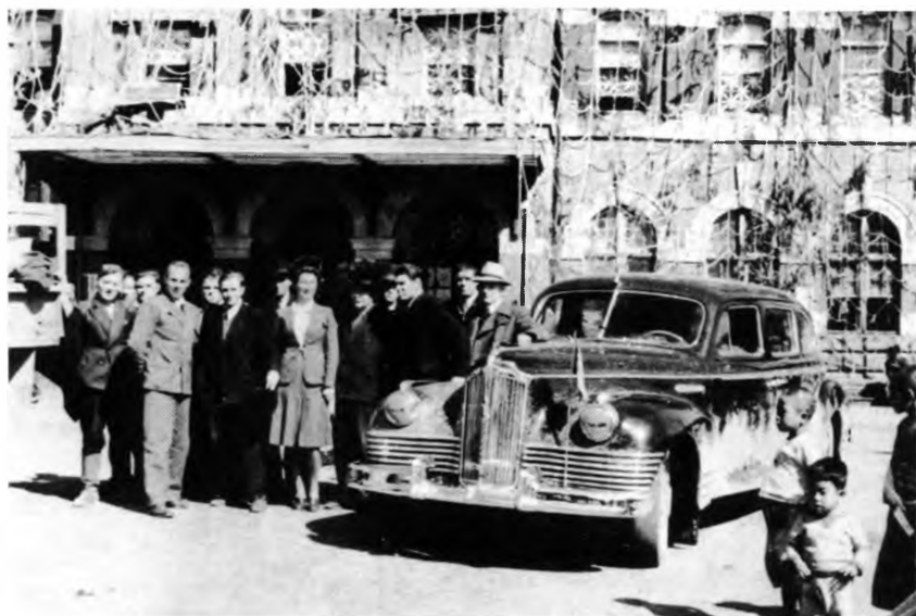
Советские дипломаты перед зданием советского посольства в Пхеньяне в разгар боевых действий