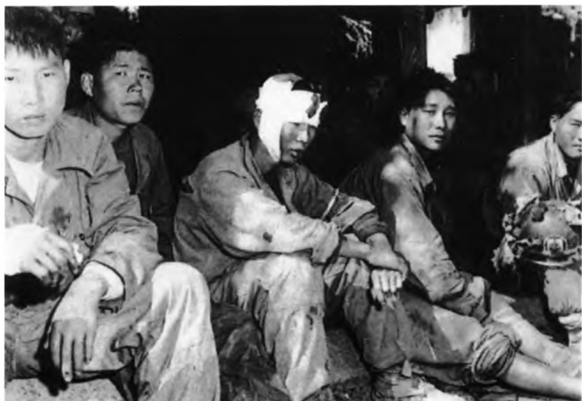
Солдаты Северной Кореи в плену