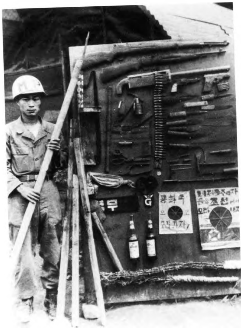
Трофеи начального этапа