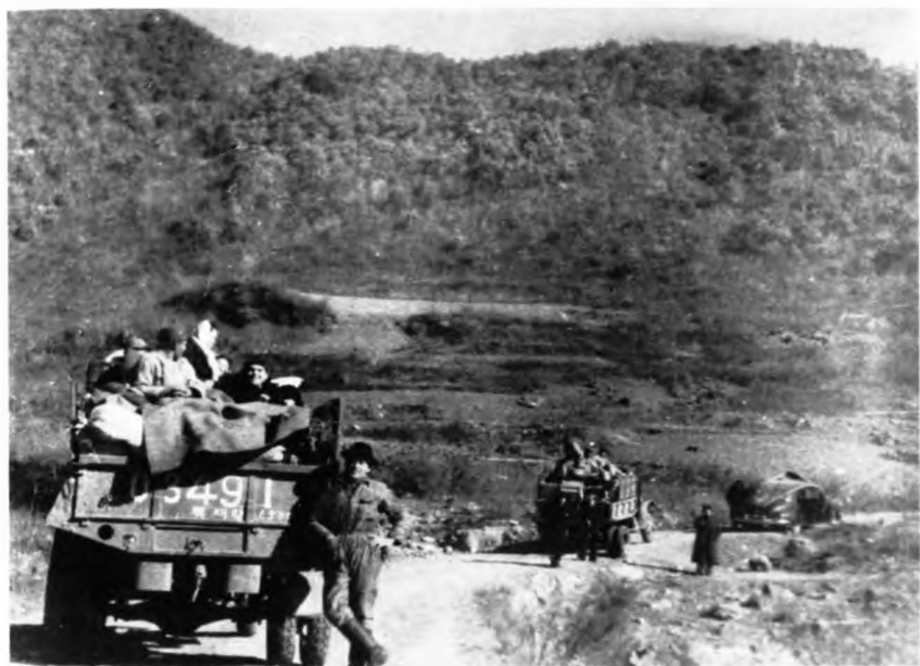
Эвакуация советского посольства