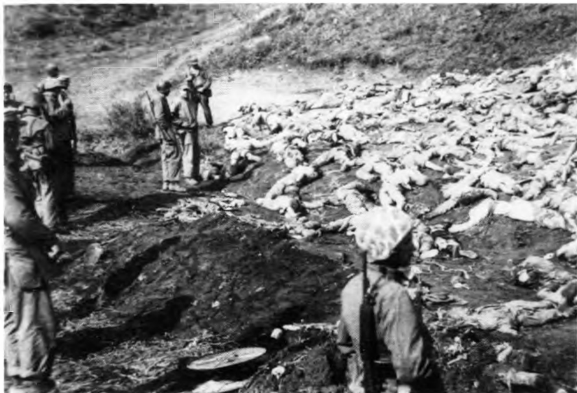
Ужасы войны. Жертвы массовых расстрелов