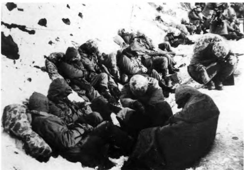
... на привале