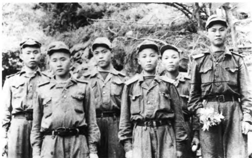
Солдаты Северной Кореи