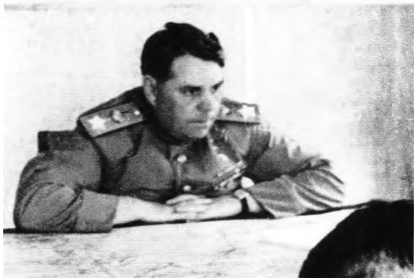
Маршал Советского Союза А.М.Василевский над картой боевых действий