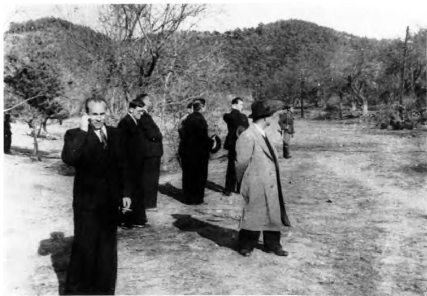
Пак Хен Ен на территории советского посольства в Пхеньяне. 15.08.1951 г.