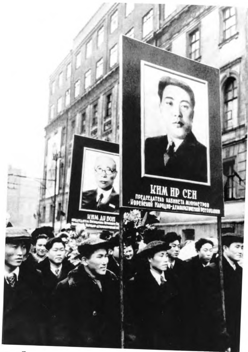
Демонстрация в Москве в поддержку Северной Кореи