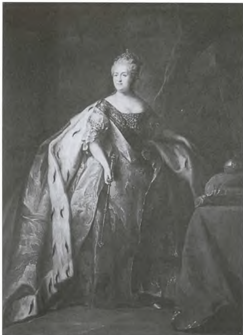
Императрица Екатерина II. Художник П.С. Дрождин