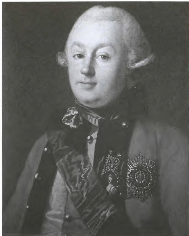
Г.Г. Орлов — красавец, дуэлянт, масон и любимец дам. Художник К.-Л.-И. Христинек