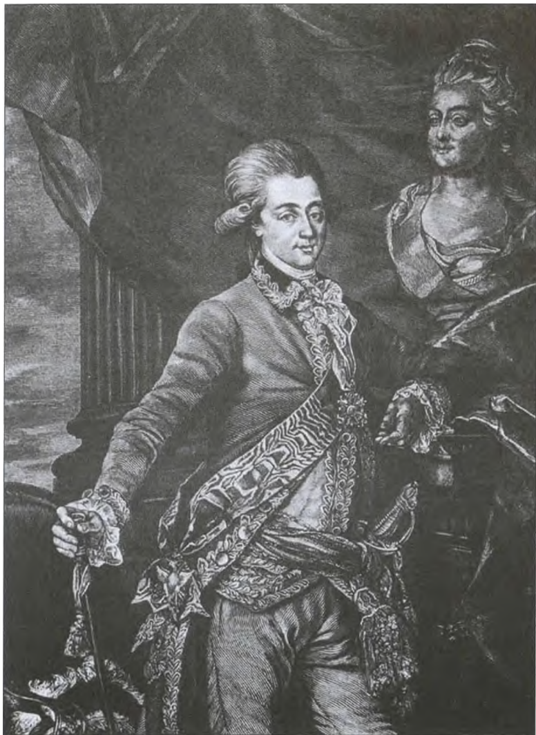
А.Д. Завадский. Сама Екатерина тишет о нем, что никого не любила так, как этого молодого человека. Гравюра XVIII в.