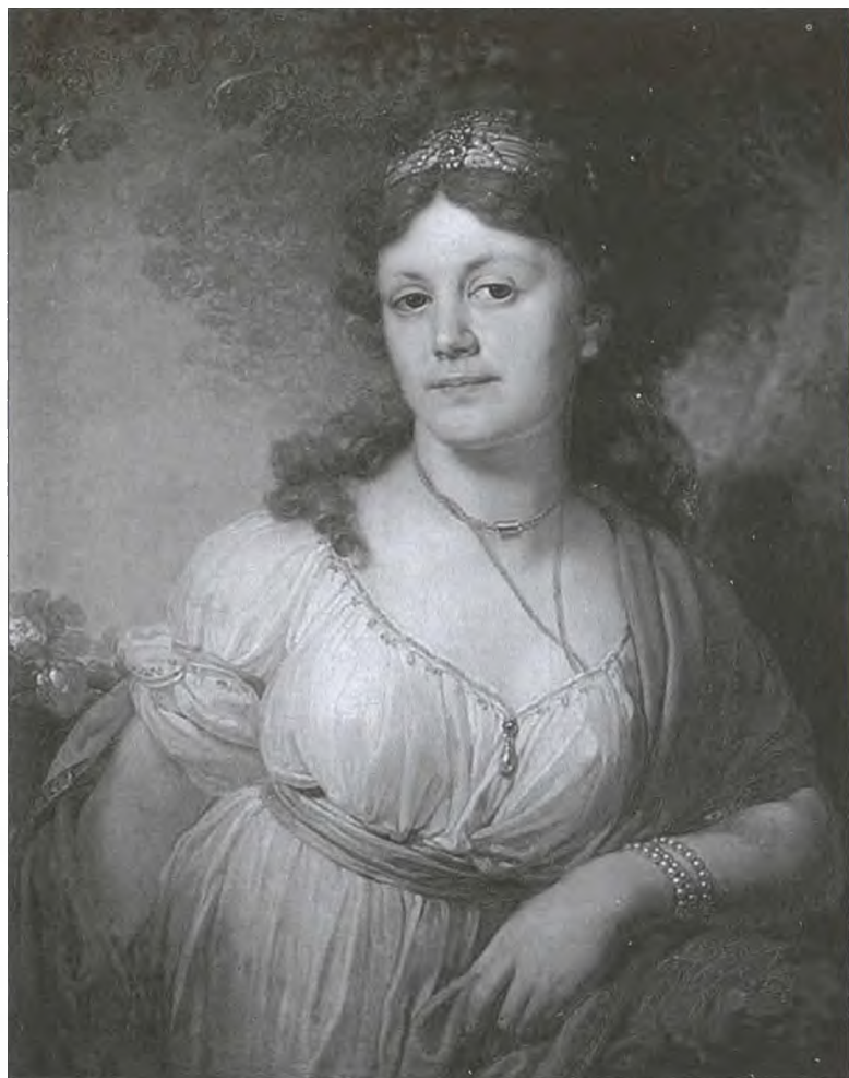
Елизавета Григорьевна Темкина, дочь Екатерины II и Г.А. Потемкина. Художник В.Л. Боровиковский