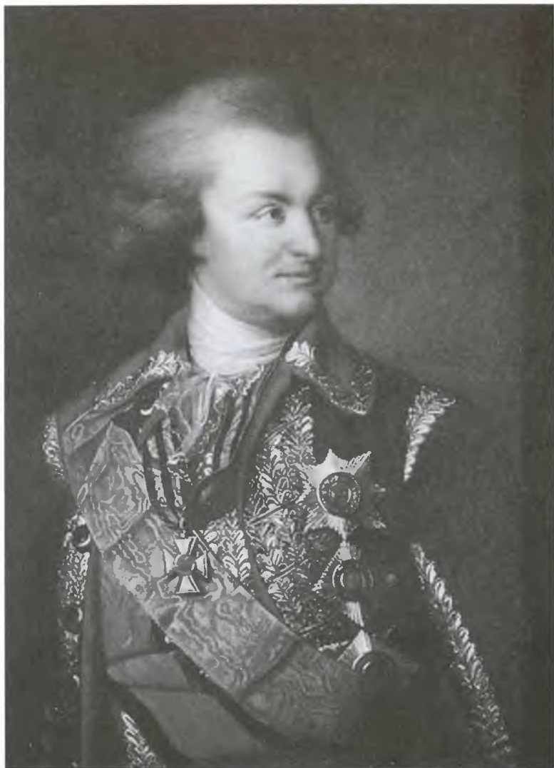
Генерал-фельдмаршал князь Г.А. Потемкин-Таврический. Портрет неизвестного художника