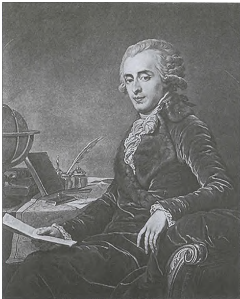
П.А. Зубов. «Цыганенок», как звала его Екатерина. С картины И.Б. Лампи-старшего