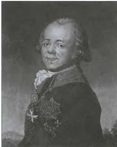
Павел I. Портрет неизвестного художника. Некоторые считали отцом императора не Петра III, а С.В. Салтыкова