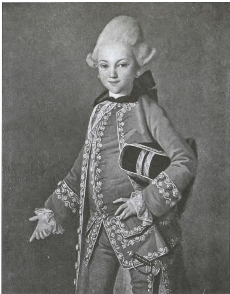
Юный граф Алексей Григорьевич Бобринский. Сын Екатерины II и графа Г.Г. Орлова. Художник К.-Л.-И. Хрестинек