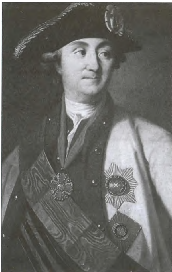
Алексей Орлов не ходил в любовниках Екатерины, он вместе с братом посадил ее на трон. Художник К.-Л.-И. Христинек