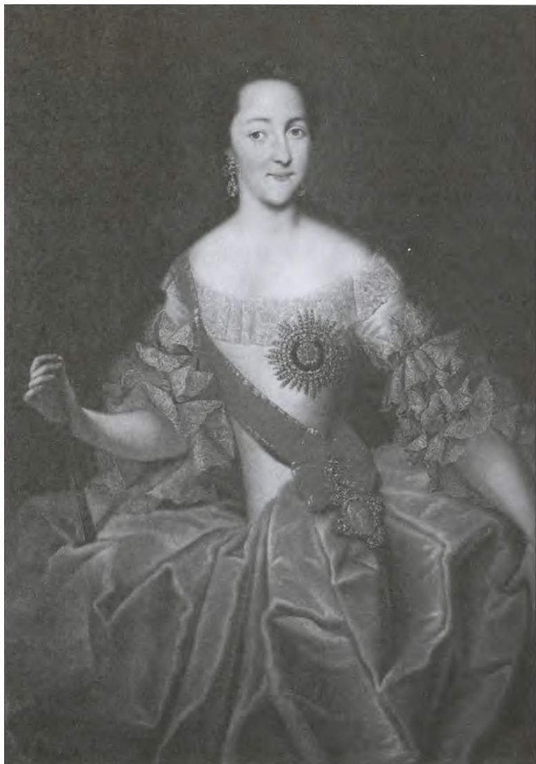
Великая княгиня Екатерина Алексеевна. Неизвестный художник