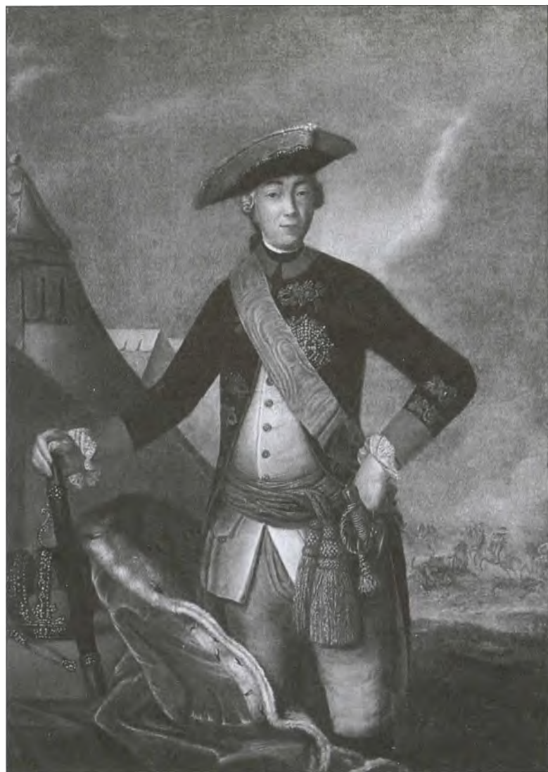
Император Петр III. Художник Ф.С. Рокотов