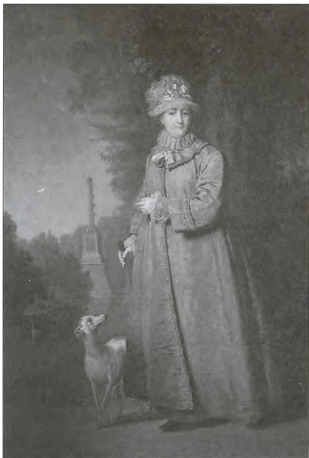
Екатерина II. Художник В.Л. Боровиковский