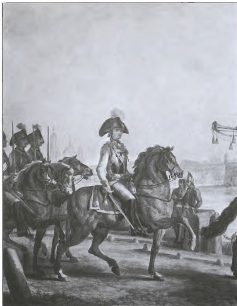
Генерал-фельдмаршал Г.А. Потемкин во главе Кавалергардского отряда. Художник М.М. Иванов