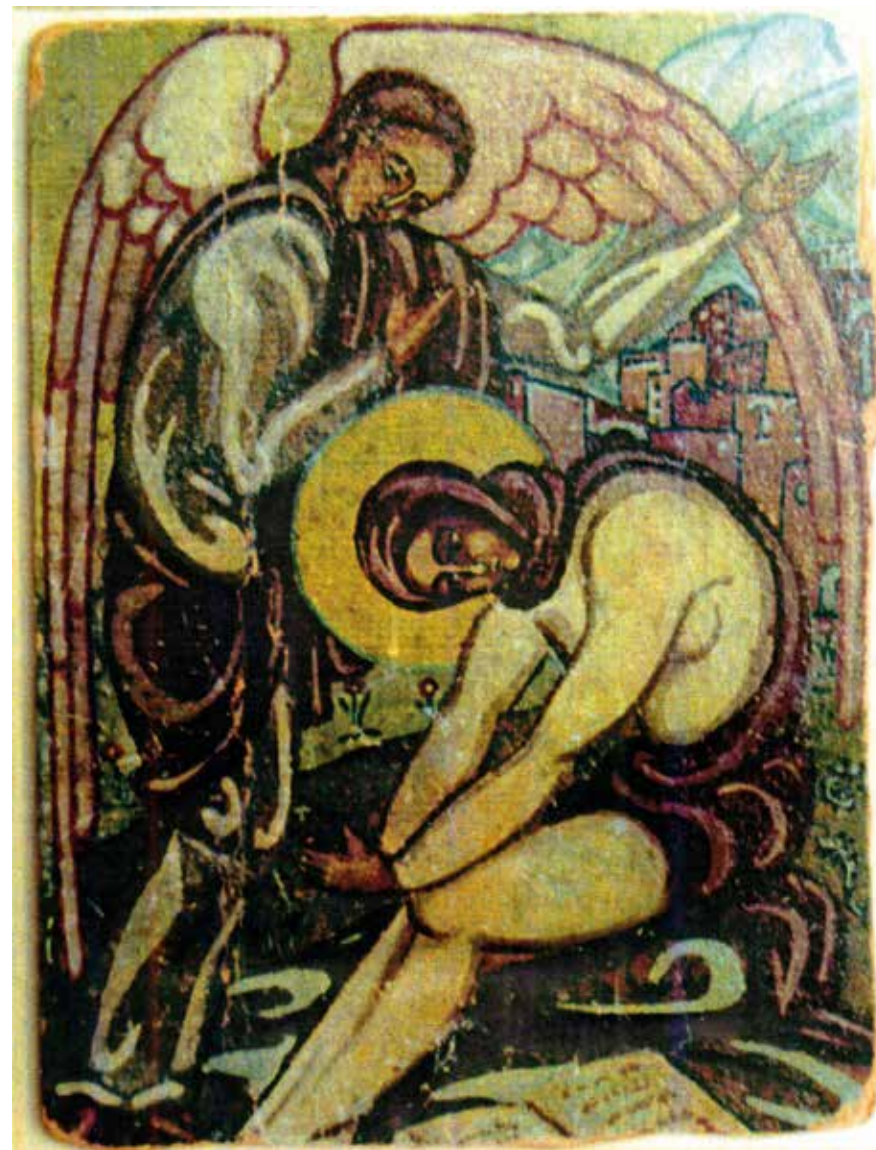
Икона Преподобной Марии Египетской, написана м.Марией к постригу, 1932г

Люди окружавшие монахиню Марию, переживали катастрофу старой России прежде всего как личную трагедию. Мать Мария принадлежала к тем, кто распознал в обстоятельствах времени нечто большее: призвание