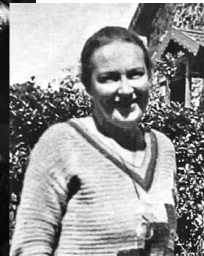
Елизавета Юрьевна Скобцова, Медон под Парижем, 1924г