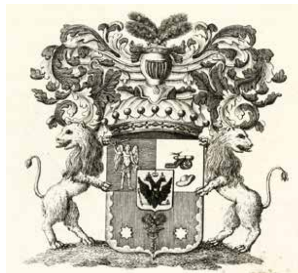
Фамильный герб рода Дмитриевых - Мамоновых