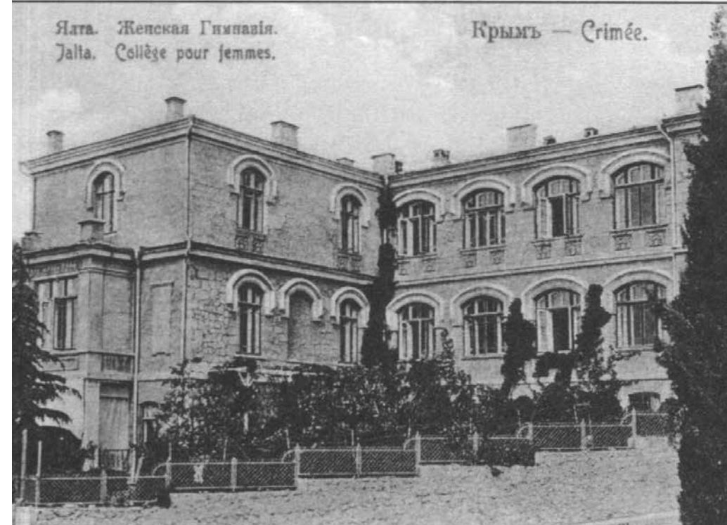
Ялтинская женская гимназия (1891). Арх. Н.П. Краснов. Открытка 1910-х годов.

Потом она призналась, что это были её первые стихи, которые родились тут же на месте и совершенно непонятным образом слетели с языка».