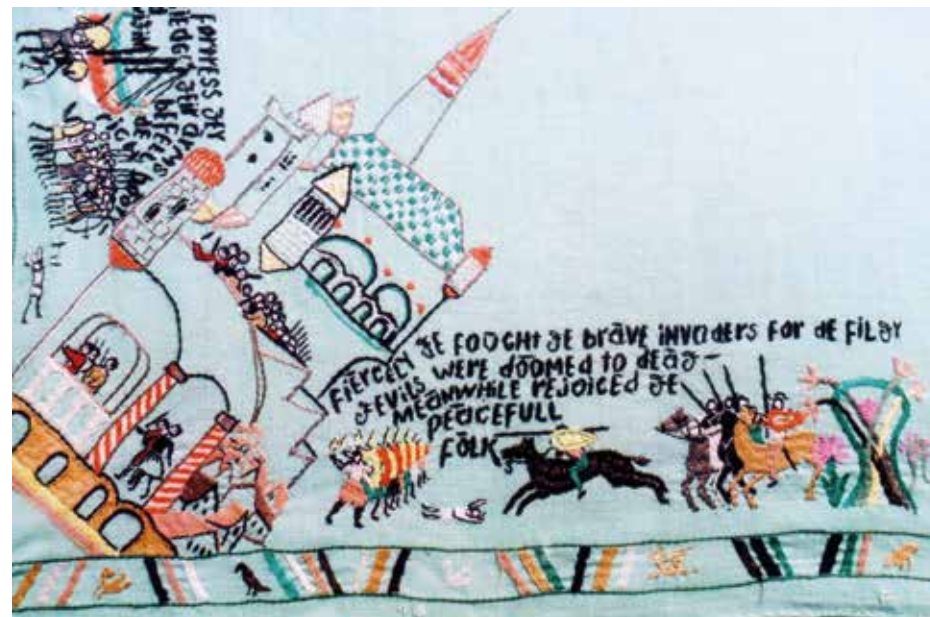
«Победа над злом» Вышивка матери Марии в лагере Равенсбрюк, 1944г.