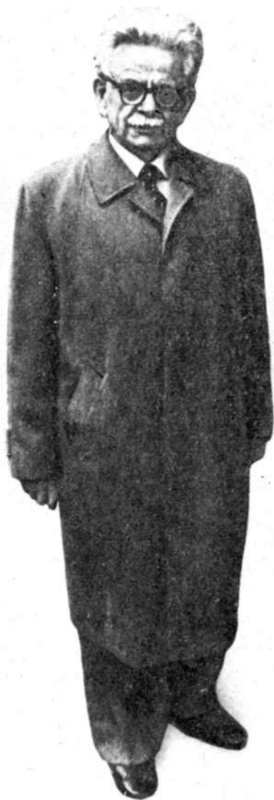
Э. Канетти, начало 80-х годов