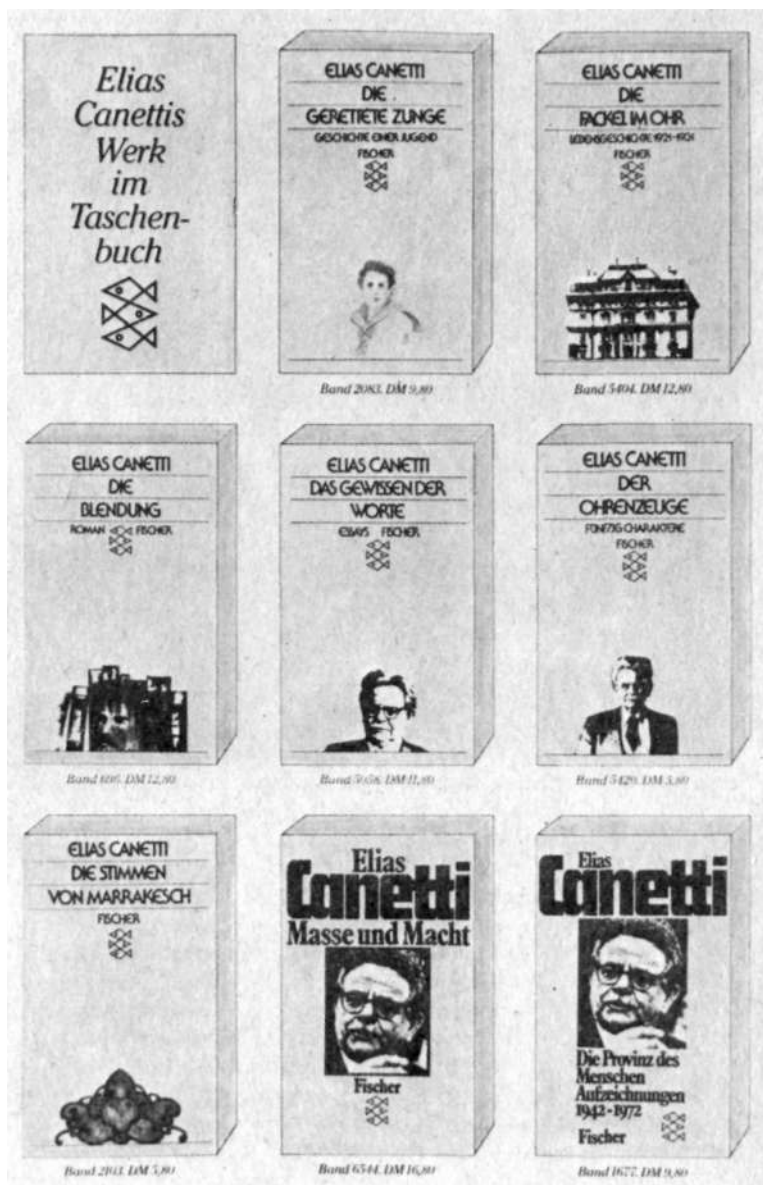
Карманные издания книг Э. Канетти