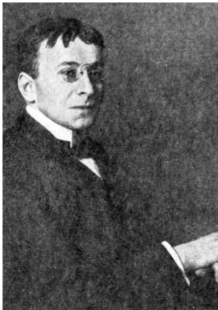
Карл Краус, 1908