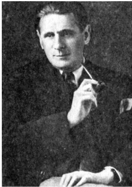
Герман Брох, 1937