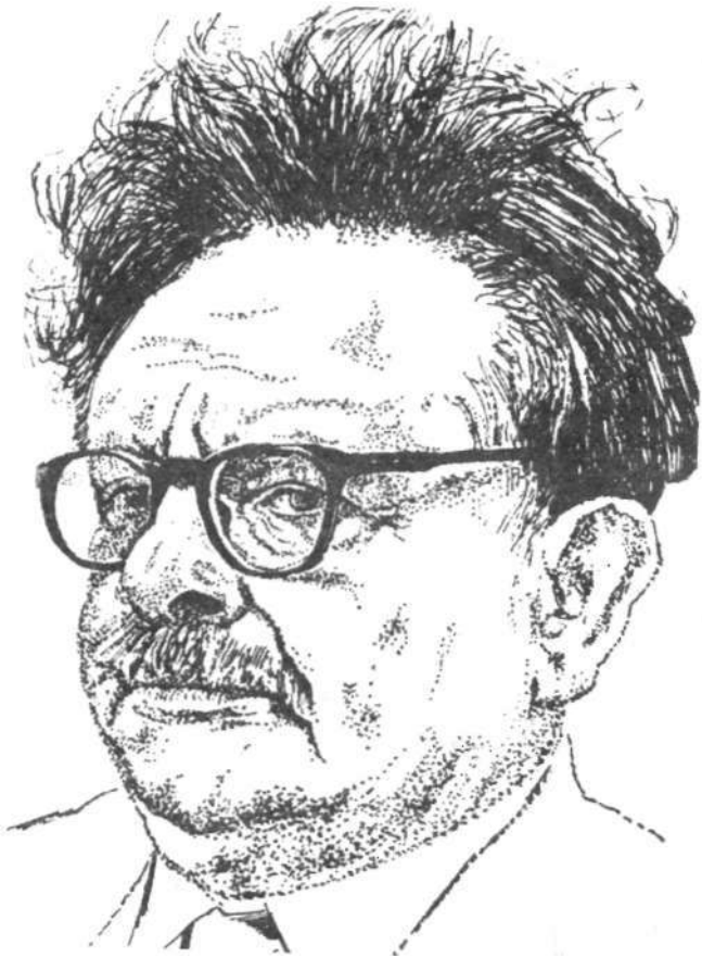
Э. Канетти. Рисунок Р. Шёнвальда