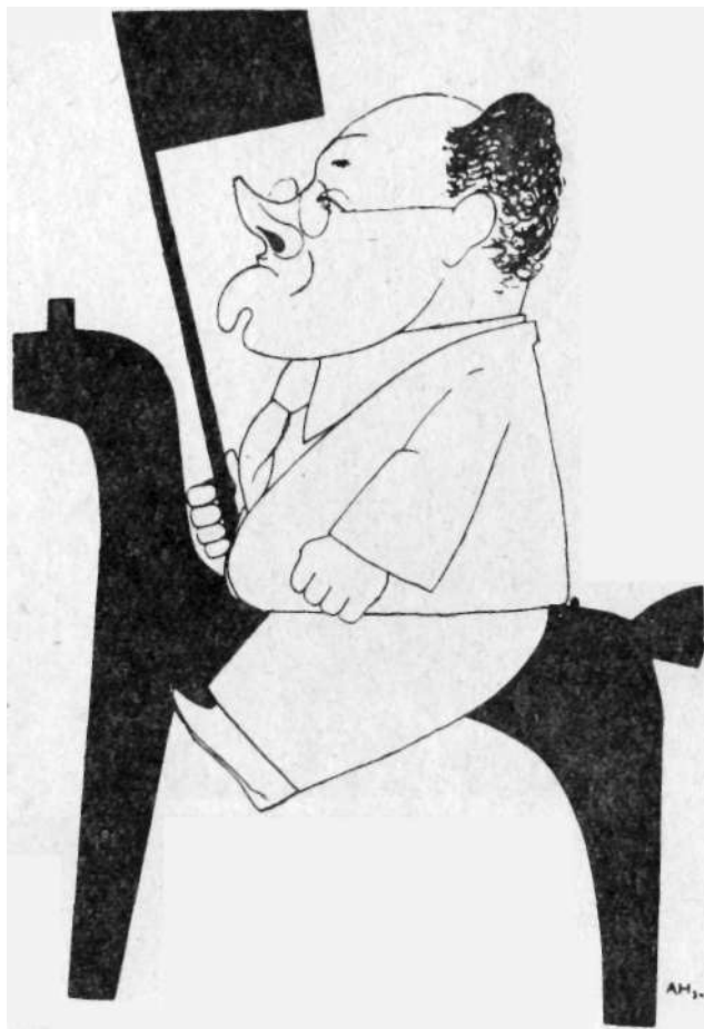
Исаак Бабель. Карикатура А. Гофмейстера, 1934