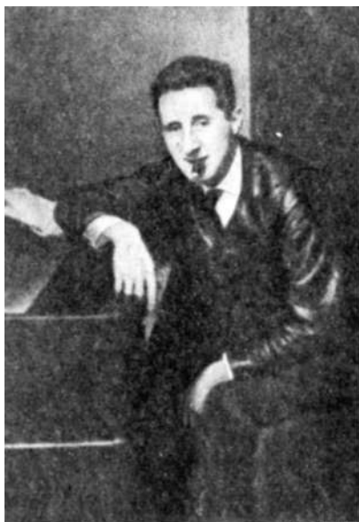
Бертолт Брехт, 1927