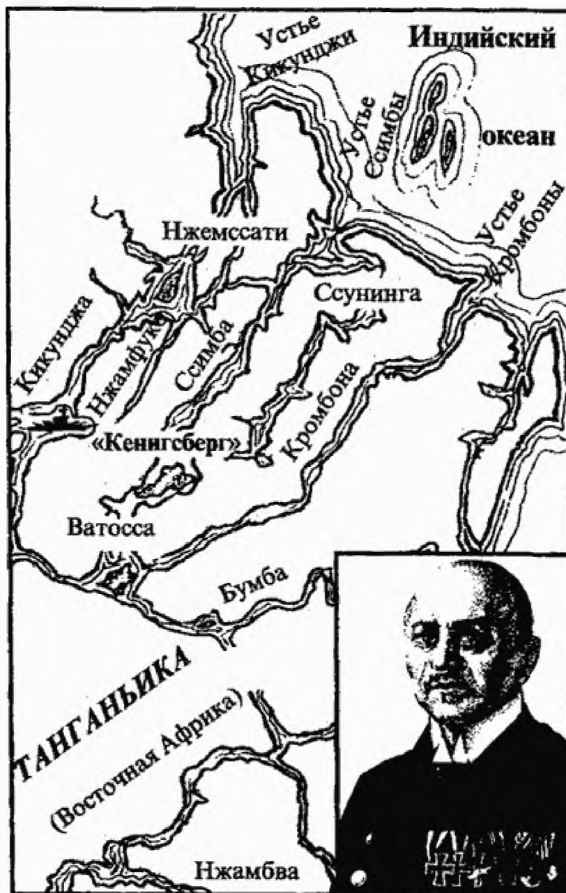
«Кенигсберг» в устье реки Руфиджи

Легкий крейсер «Кенигсберг» был заложен 12 января 1905 г. на казенной верфи ВМС в Киле. От построенных ранее семи легких крейсеров новый корабль отличался большей длиной, мощностью машин и высокой автономностью. 12 декабря 1905 г. «Кенигсберг» был спущен на воду. Крестным отцом нового корабля, как и можно было ожидать, стал обербургомистр Кенигсберга доктор Керте, который и окрестил крейсер именем вверенного его заботам города.