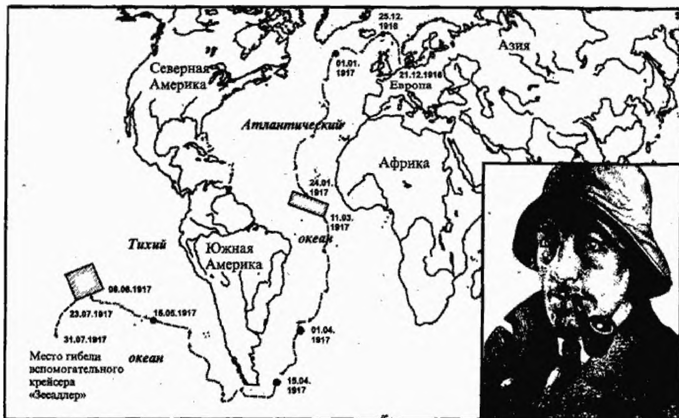
Карта плавания вспомогательного крейсера «Зееадлер»

Капитан-лейтенант Феликс Люкнер происходил из старинного графского рода, но когда он напоминал об этом в кают-компаниии линкора «Кронпринц», где служил вахтенным офицером, то его сослуживцы прятали улыбки — так мало Люкнер походил на аристократа. Грубые повадки и далеко не аристократическая речь делали графа фон Люкнера более похожим на какого-нибудь просоленного шкипера рыболовецкой шхуны. Таким этого странного офицера сделала его полная приключений жизнь, прошедшая вдали от аристократических салонов, на пребывание в которых граф, казалось бы, имел право по рождению.