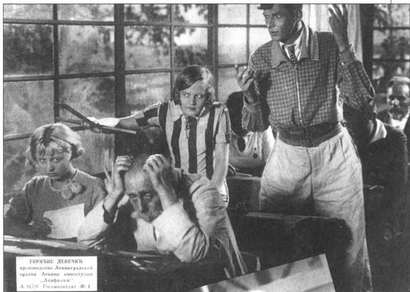
ГОРЯЧЕ ДЕНЕЧКИ производство Ленинградской студии кинематографии «Ленфильм» А. 81788 Госкиноуказ № 1