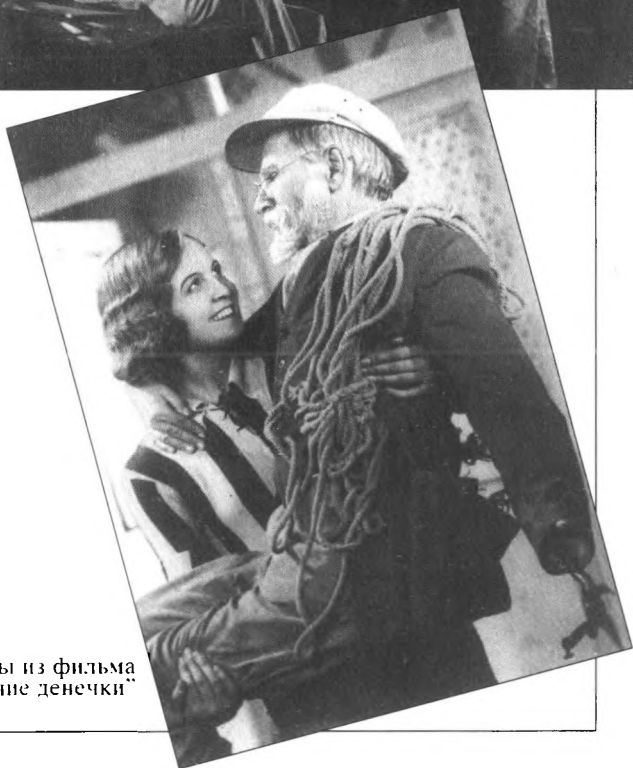
Кадры из фильма "Горячие денечки"