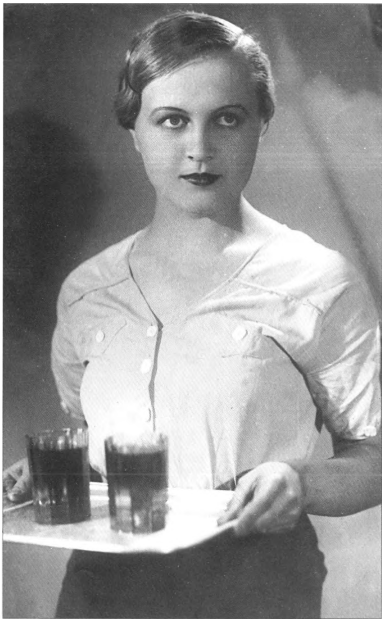
Первый в жизни спектакль — "Аристократы" Николая Погодина