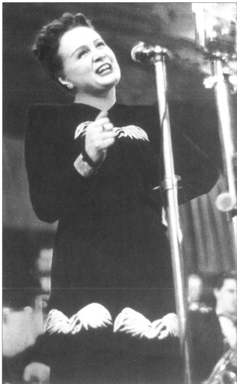
Прага. Выступление в концертном зале "Люцерна"