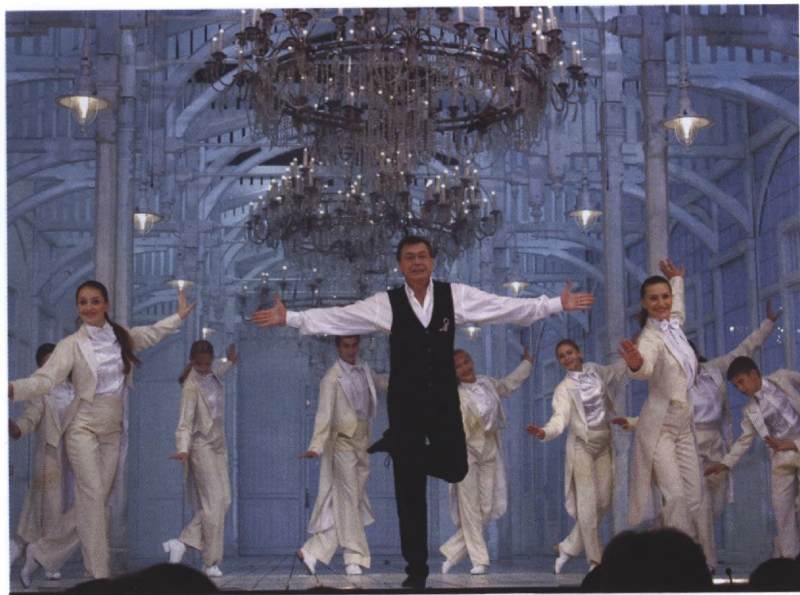
Празднование 70-летия М.А. Захарова в Ленкоме, 13.10.2003 г.