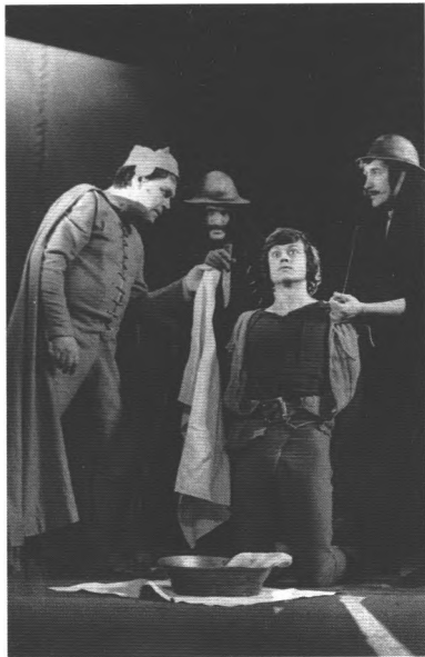
ТИЛЬ, 1974 г.