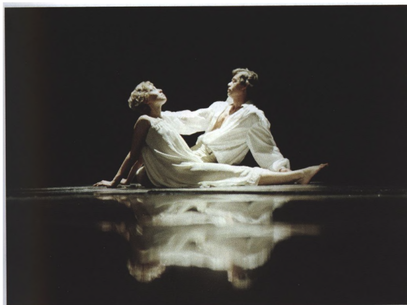
«ЮНОНА» И «АВОСЬ», 1981 г.