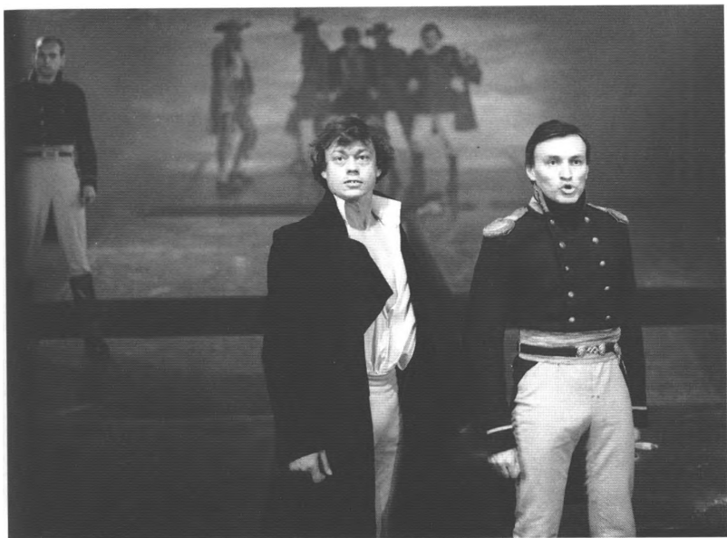
«ЮНОНА» И «АВОСЬ», 1981 г.