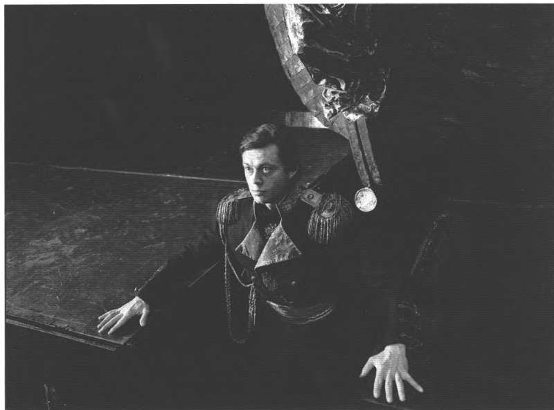
«ЮНОНА» И «АВОСЬ», 1981 г.