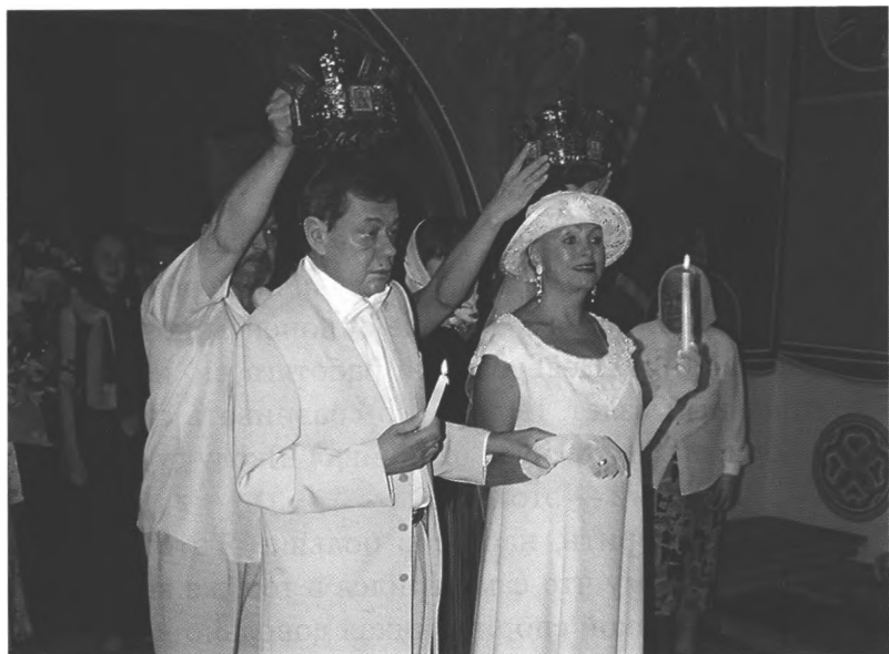
Венчание Н. Караченцова и Л. Поргиной, 2005 г.