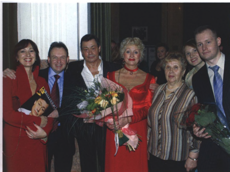
На 60-лети Н.П. Караченцова, 27.10.2004 г.