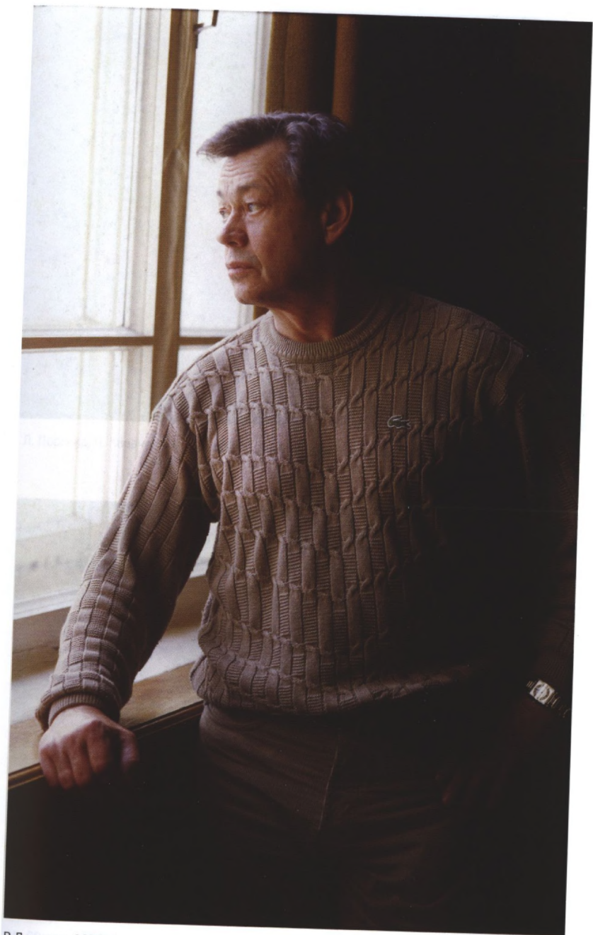
В Ленкоме, 2001 г.