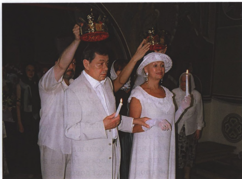
Венчание Н. Караченцова и Л. Поргиной, 2005 г.