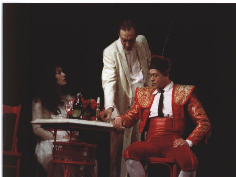
ШКОЛА ДЛЯ ЭМИГРАНТОВ. Серж – Н. Караченцов, Трубецкой – О. Янковский, Девушка – И. Пиварс, 1990 г.