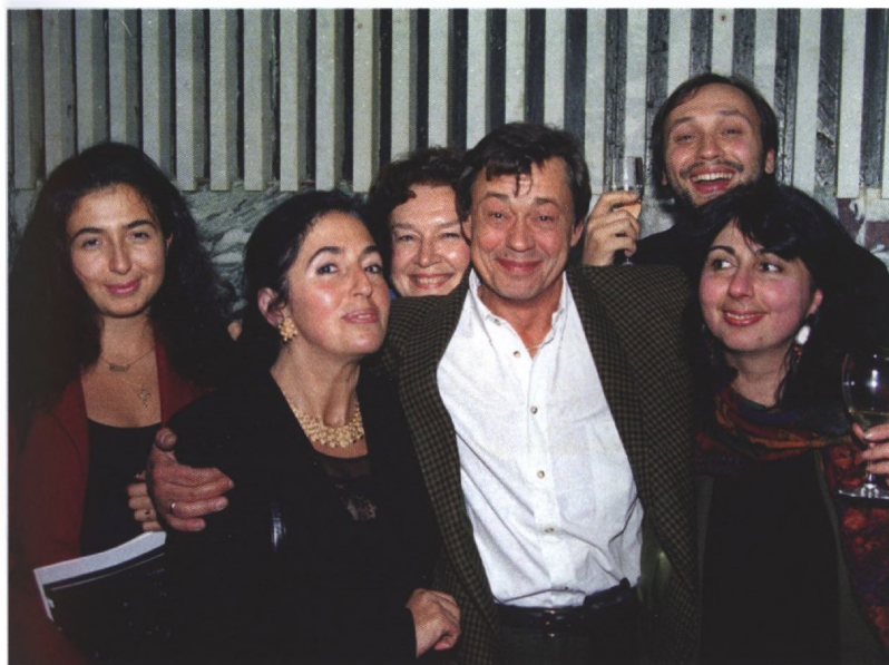
На открытии театра ET Cetera, 1996 г.