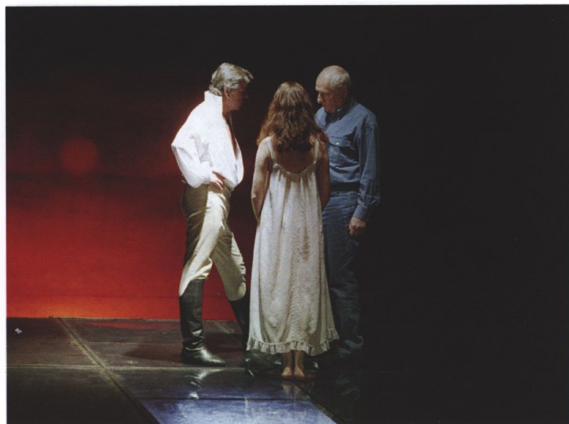
«ЮНОНА» И «АВОСЬ», репетиция перед съемкой, 2001 г.