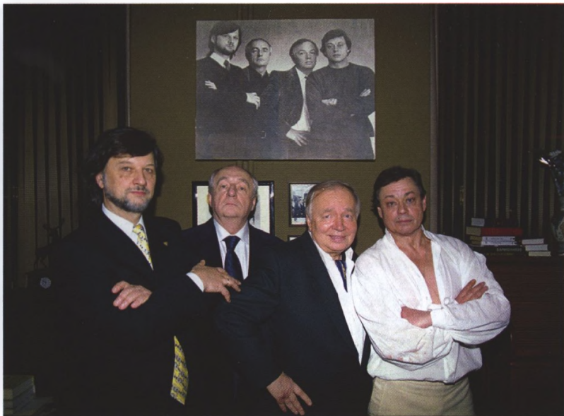
На 20-летию «ЮНОНЫ» и «АВОСЬ». А. Рыбников, М. Захаров, А. Вознесенский, Н. Караченцов, 2001 г.