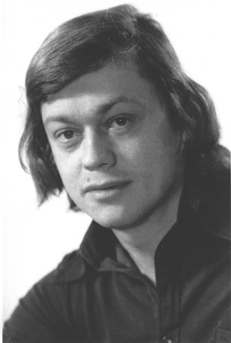
Н. Караченцов, 1970-е гг.