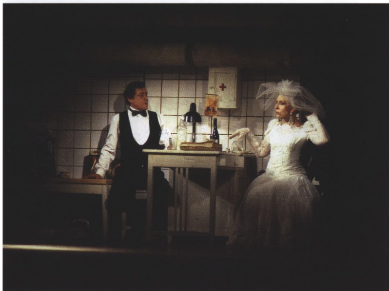
SORRY, 1992 г.