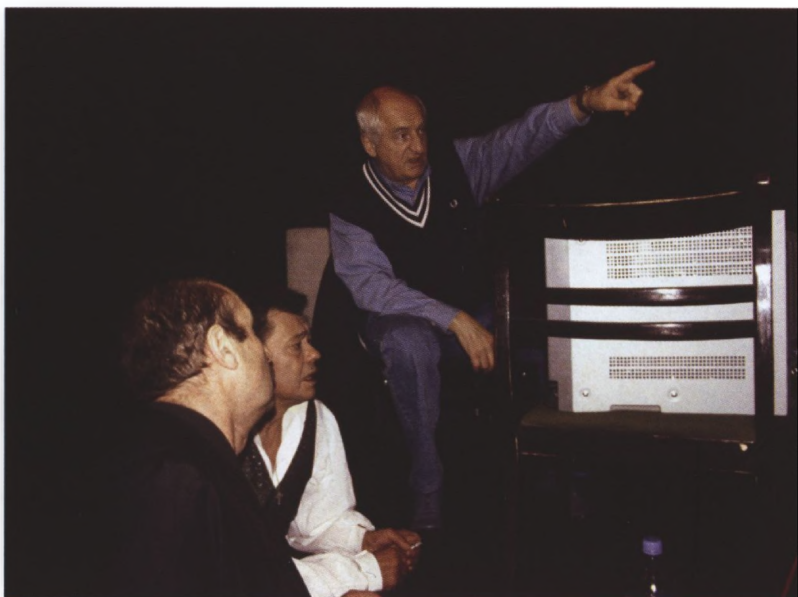
На съемках фильма о «ЮНОНЕ» и «АВОСЬ», 2001 г.