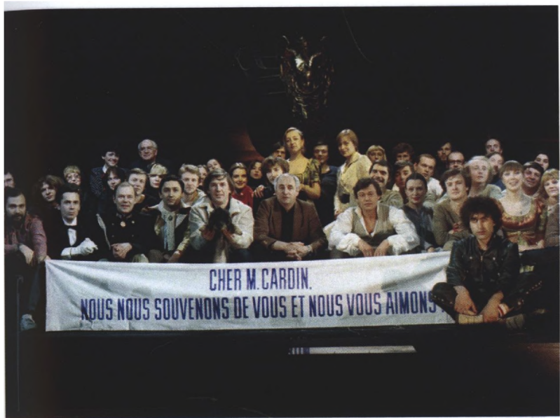
«ЮНОНА» И «АВОСЬ» перед гастролями в Париже, 1983 г.