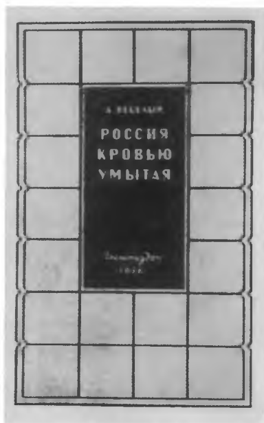
Первая книга Артема Веселого — и последние прижизненные издания