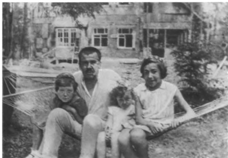
1 января 1937 г. отец сфотографировал нас у плотины в Переделкине (в центре — Фанта, справа — Гайра)

Последняя из известных фотографий отца (август 1937 г.). Слева от отца — Волга и Гайра. Фотографировал друг отца художник Даниил Борисович Даран