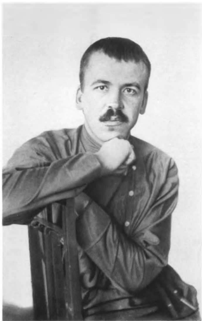
Отец. 1927 г.