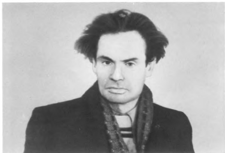
Место ссылки — сибирское село Пихтовка. Этюд с натуры Н. Л. Билетова