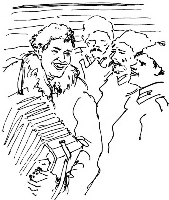
Иллюстрации Д. Б. Дарана к «России, кровью умытой»