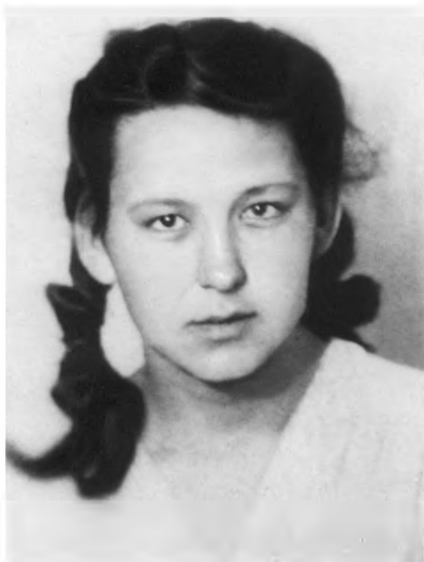
Незадолго до ареста