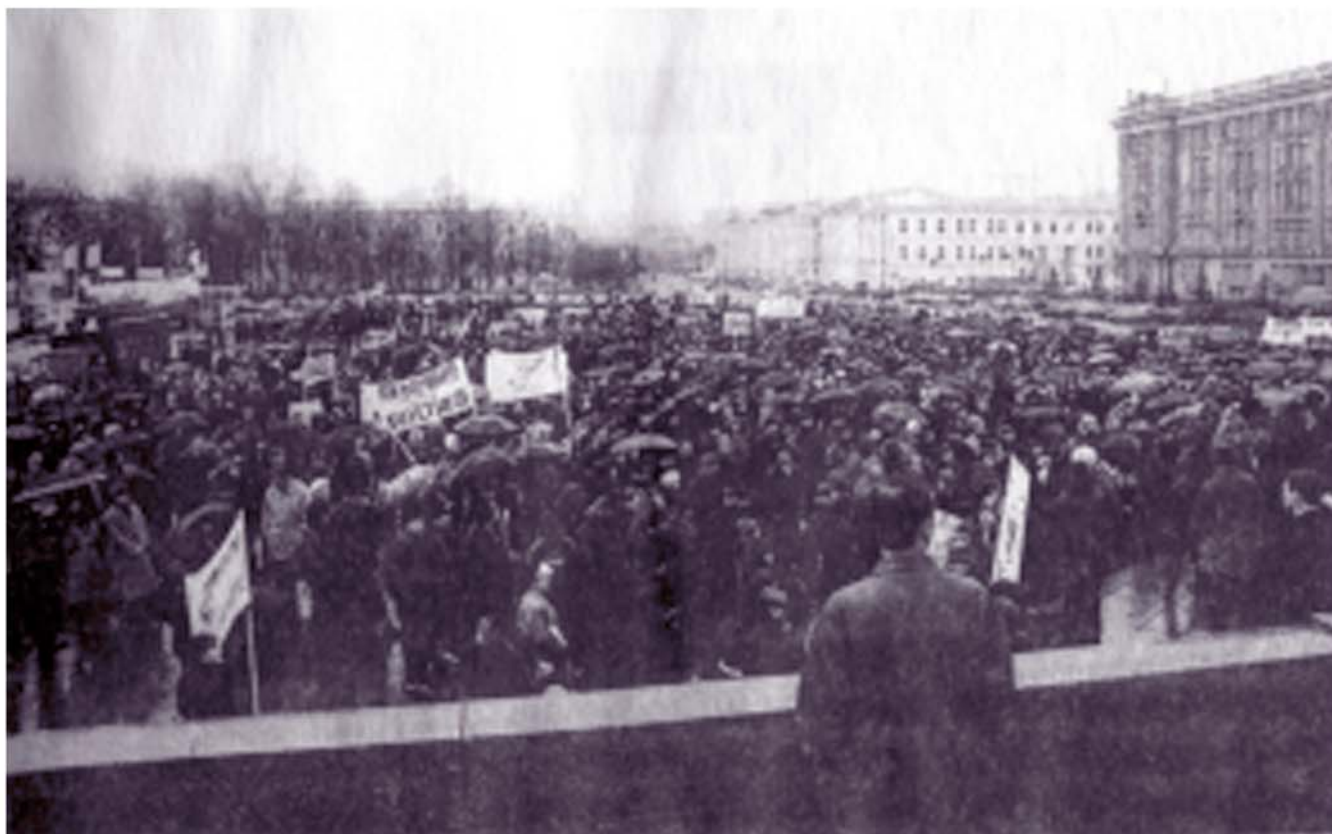
Митинг на площади 1905 года.