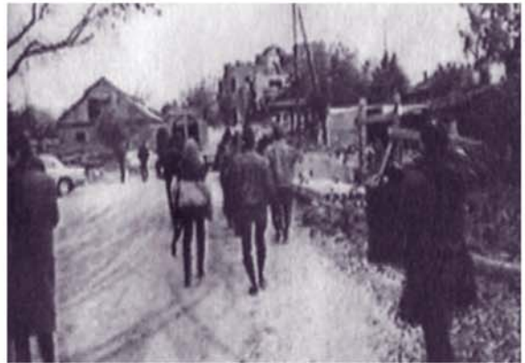
Торговля в цыганском поселке. Толпы наркоманов.