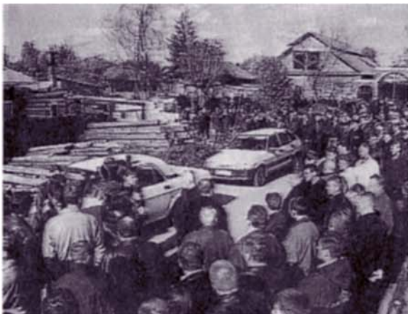
1. Стояние в цыганском поселке.