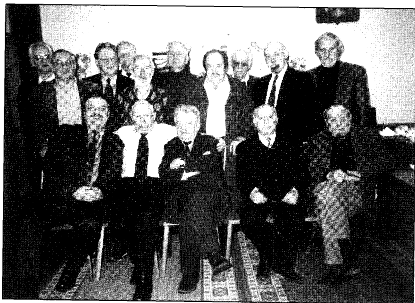
Один из прощальных снимков Комиссии по помилованию. Апрель 2001