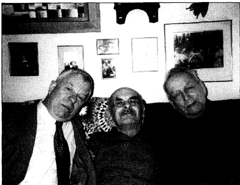
Анатолий Приставкин, Булат Окуджава, Лев Разгон. 1997