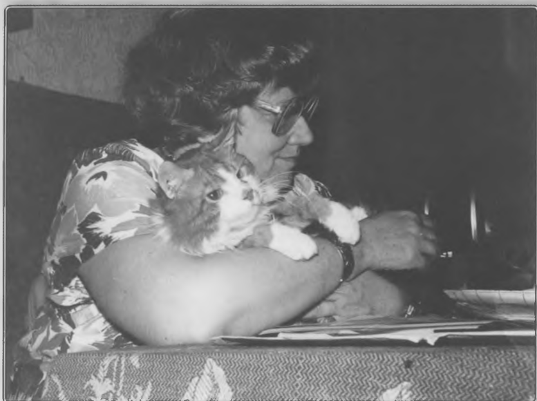
«Люблю котов, потому что они индивидуалисты, либералы и западники».