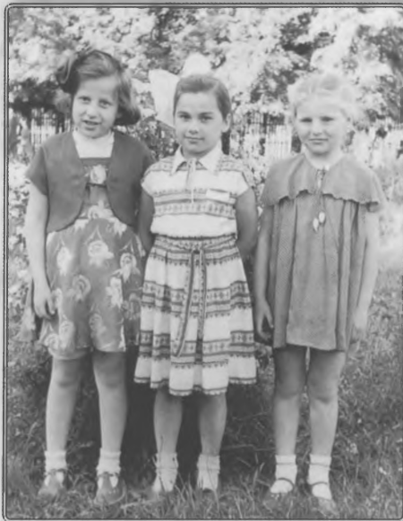
С соседками по даче