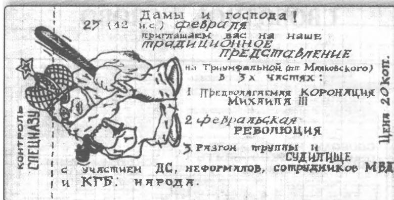
Приглашение на митинг