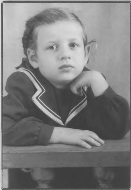
1954 год