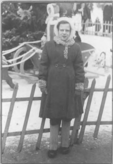
В школьные годы