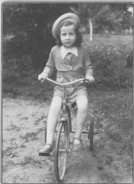
1956 год