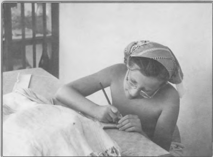
Начало 60-х годов