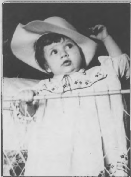
Будущий мушкетер