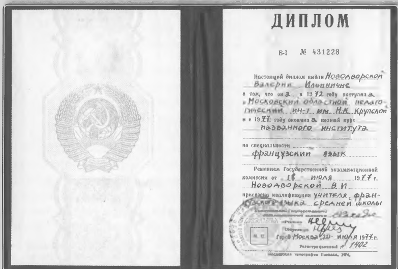
Диплом об окончании пединститута имени Крупской