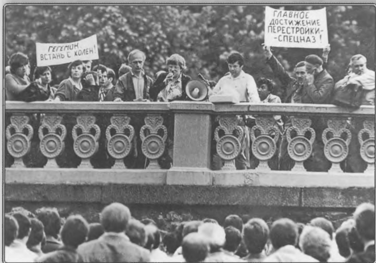
Митинг за отделение Украины от России. Харьков, июль 1990 года.