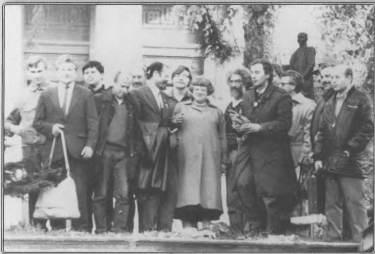
Делегаты 4-го съезда «Демократического Союза». Киев, май 1990 года.