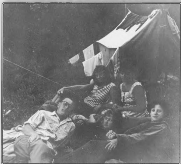
Конец 60-х, студенчество