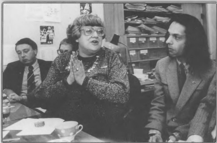
В редакции. Из архива ДС