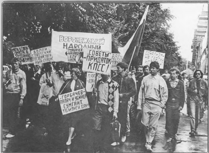
Антигорбачевский митинг. Воронеж, июнь 1990 года.