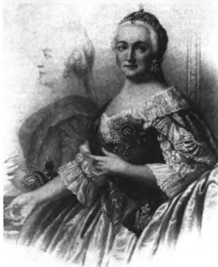
Императрица Екатерина II Алексеевна