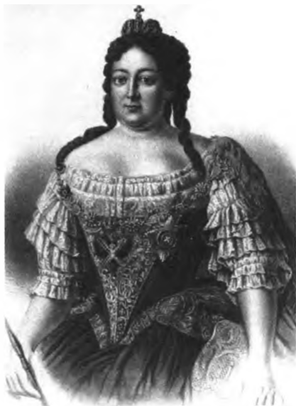
Императрица Анна Иоанновна