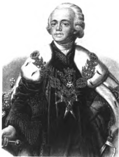
Император Павел I Петрович

Великая княгиня Наталья Алексеевна, первая жена императора Павла I