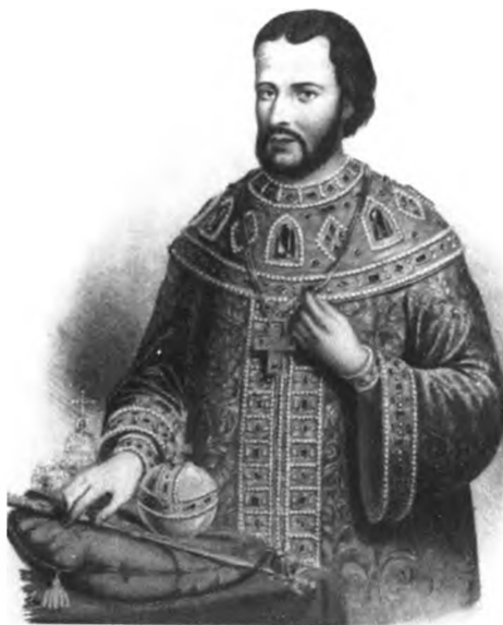
Царь Иван Алексеевич