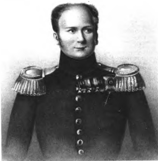
Император Александр I Павлович