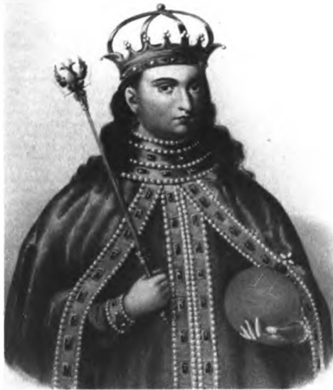
Правительница Софья Алексеевна