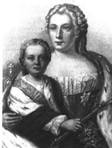
Императрица Елизавета Петровна