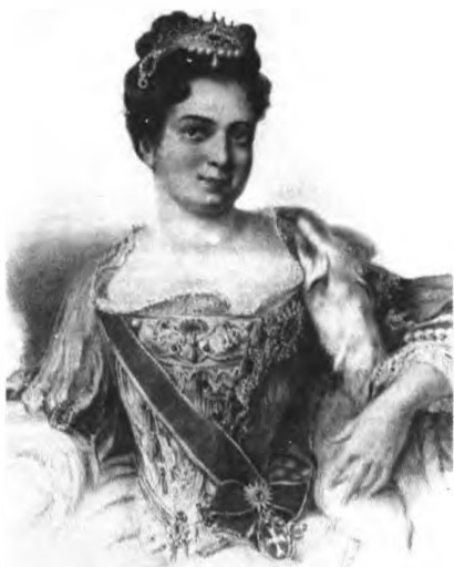
Императрица Екатерина I Алексеевна