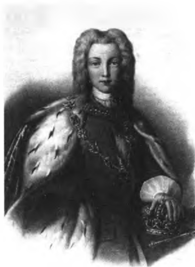
Император Петр II Алексеевич