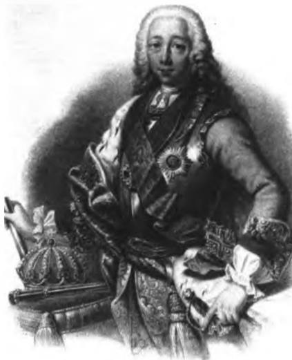
Император Петр III Федорович