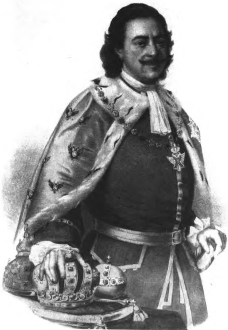
Император Петр I Алексеевич