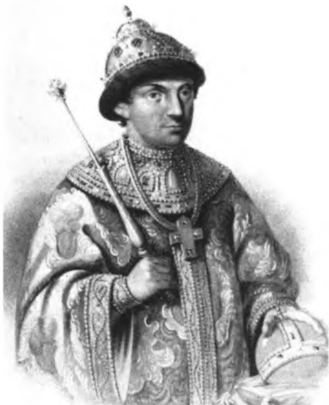
Царь Федор Алексеевич