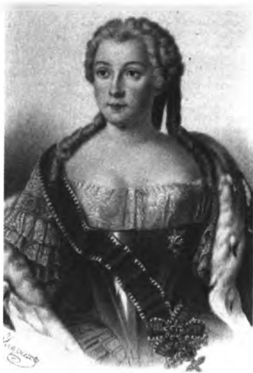
Правительница Анна Леопольдовна