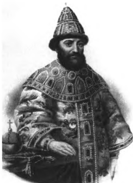
Царь Михаил Федорович