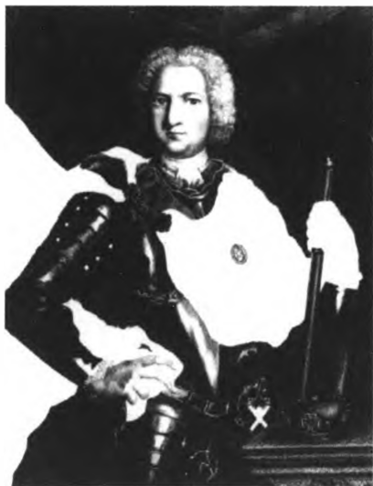
Герцог Курляндский Эрнест Иоганн Бирон