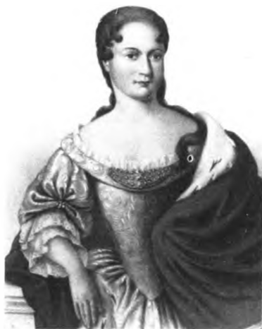
Царица Прасковья Федоровна, жена царя Иоанна V