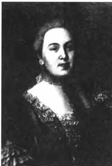
Графиня Елизавета Романовна Воронцова