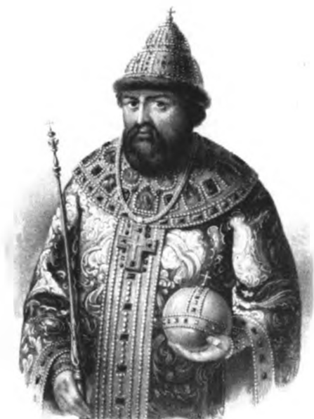
Царь Алексей Михайлович

Царица Мария Ильинична, первая жена царя Алексея Михайловича