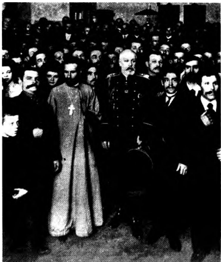
Г.Гапон (в центре) и градоначальник Петербурга Фуллон среди рабочих — членов «Собрания русских фабрично-заводских рабочих г.Петербурга». 1905 г.