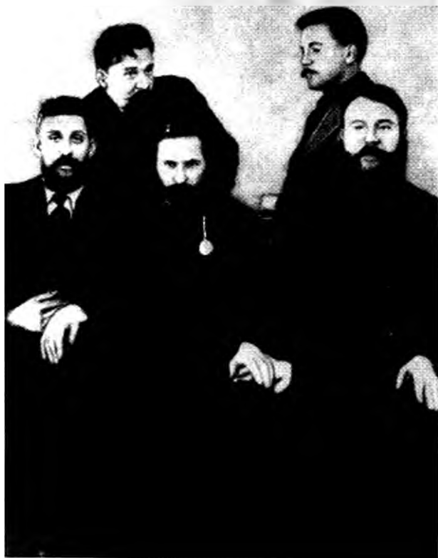
Г.Гапон и его ближайшие сотрудники. Сидят: Иноземцев, Гапон, Филиппов. Стоят: Харитонов и Янов. 8 января 1905 г.