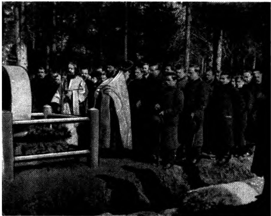
Панихида на могиле Г.Гапона.