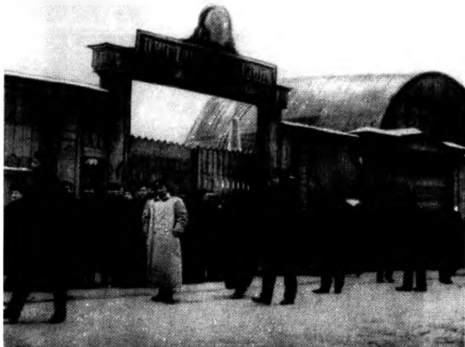
Бастующие рабочие Путиловского завода перед закрытыми воротами завода. Петербург, январь 1905 г.