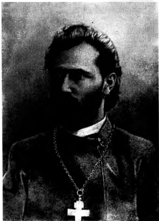
Георгий Гапон. Петербург, 1905 г.