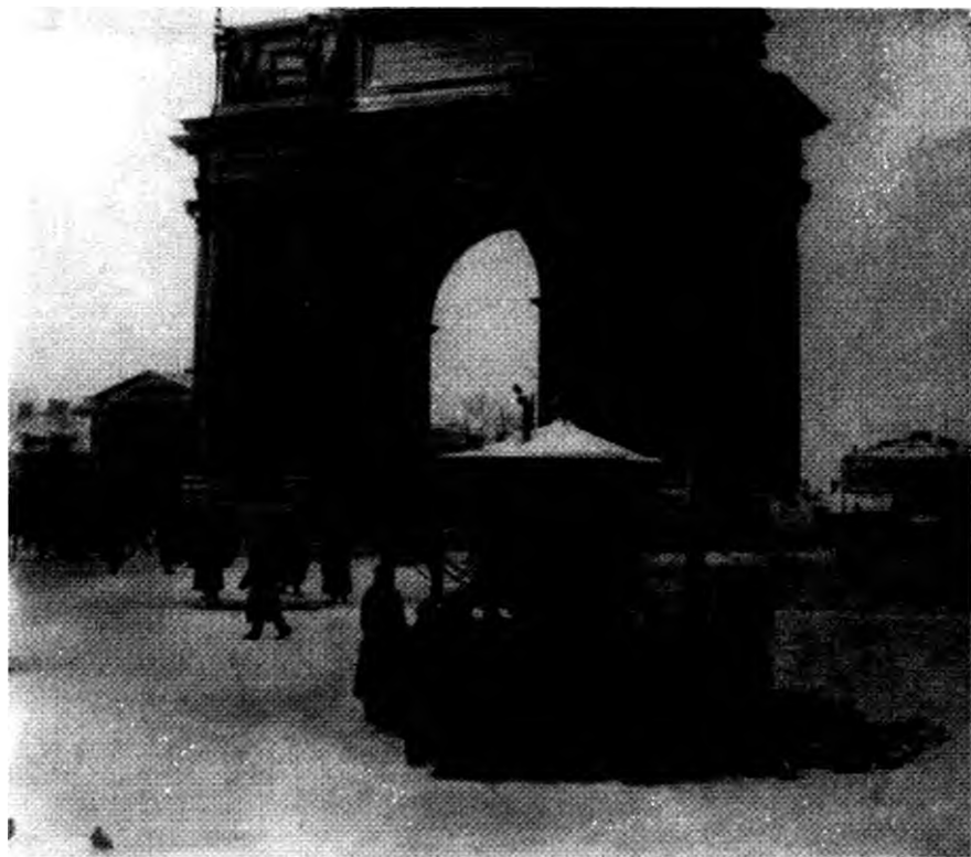
Войска у Нарвских ворот, ожидающие шествия рабочих. Петербург, 9 января 1905 г.