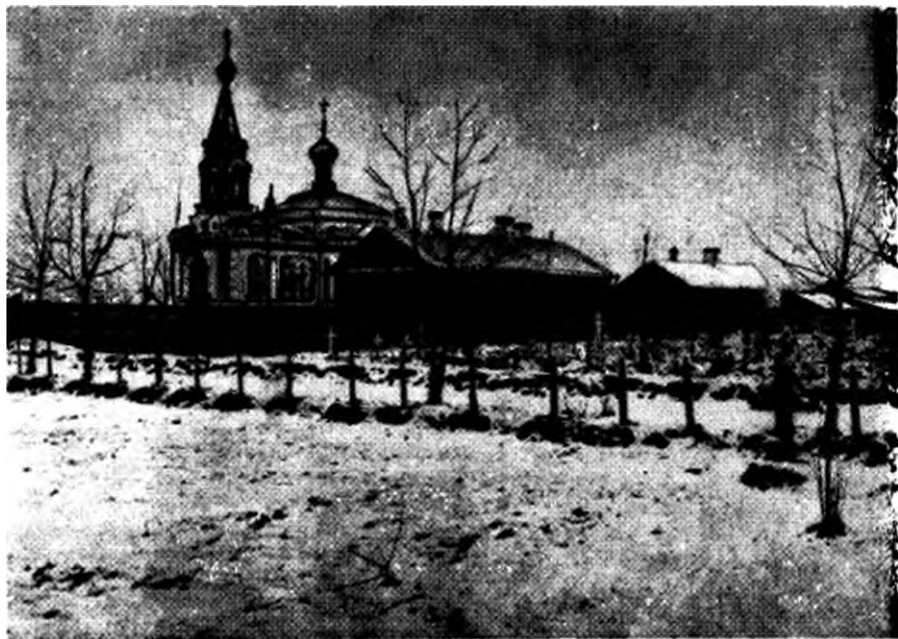
Могилы жертв 9 января на Преображенском кладбище.